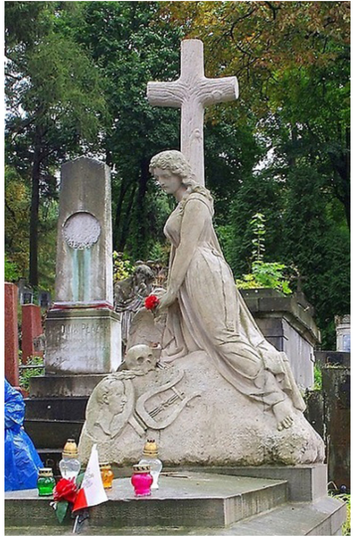
Pomnik nagrobny Artura Grottgera.