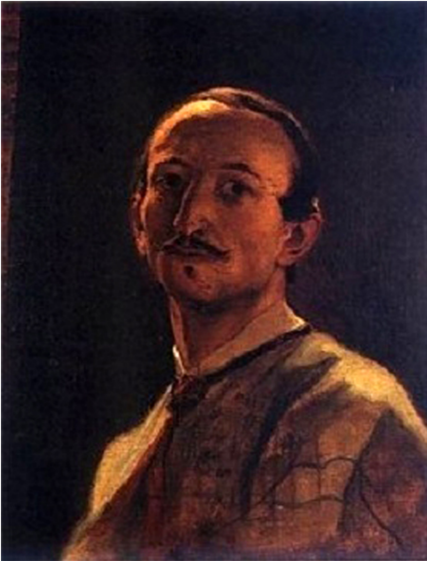
Artur Grottger, Autoportret

Dziwi mnie, że o tej wspaniałej, szaleńczej, niespełnionej miłości tych dwojga ludzi nie powstała jakaś powieść czy film. Fabuła jest pełna, nie trzeba niczego podmalowywać, upiększać, a w tym szaleństwie nie ma jakiegoś melodramatu. To najczystsza, najwspanialsza miłość, co potrafi przenosić góry. Fakty są tu piękniejsze od fantazji. Na takie wyżyny potrafią się wznieść chyba tylko nasi Kresowiaczy i to nie tylko w dziedzinie miłości indywidualnej. Dla nich do dzisiaj słowa Ojczyzna, patriotyzm, ofiara i poświęcenie dla Kraju, polskość to ciągle słowa wielkie, święte. W Polsce obecnie deklamują je najczęściej politycy, tak na wyrost, bo ich czyny i życie niekiedy przeczą temu co wypowiadają usta. Słowa te wśród nas tracą znaczenie, stają się coraz bardziej słowami wstydliwymi. Jaka szkoda, że granice oddzieliły Kresowiaków od nas. Tak bardzo jest ich nam brak w naszej obecnej, zmaterializowanej Rzeczypospolitej.