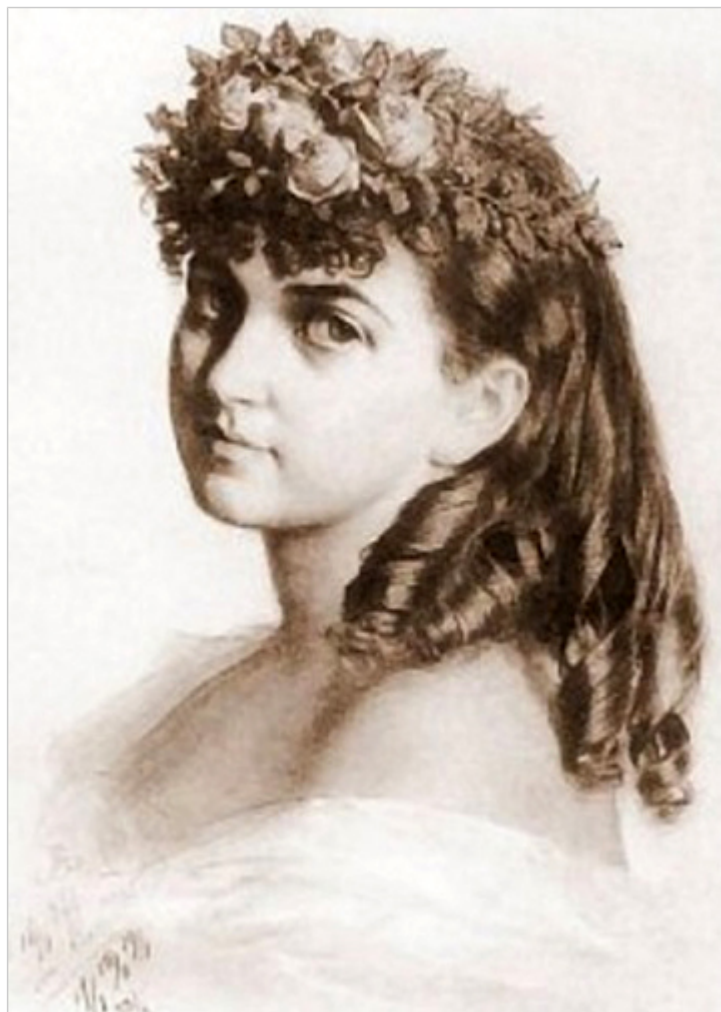
Wanda Monné autorstwa Artura Grottgera.

coraz bardziej słowami wstydliwymi. Jaka szkoda, że granice oddzieliły Kresowiaków od nas. Tak bardzo jest ich nam brak w naszej obecnej, zmaturalizowanej Rzeczpospolitej.