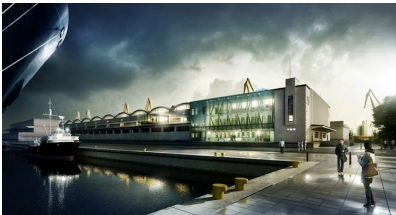
Nowoczesny budynek Muzeum Emigracji w Gdyni, fot. Muzeum Emigracji.

artystów – emigrantów. Spotkały się odmienne szkoły badające migracje Polaków do Ameryki Północnej. Konferencja w Muzeum Emigracji pokazała, jak ważnym, aktualnym i ciągle niezbadanym do końca, jest fenomen emigracji. Podkreślany był zarówno heroizm, jak i tragizm emigracji, osiągnięcia diaspory polskiej, jak i błędy tkwiące w jej strukturze, analizowano statystyki i przedstawiano pojedyncze losy.