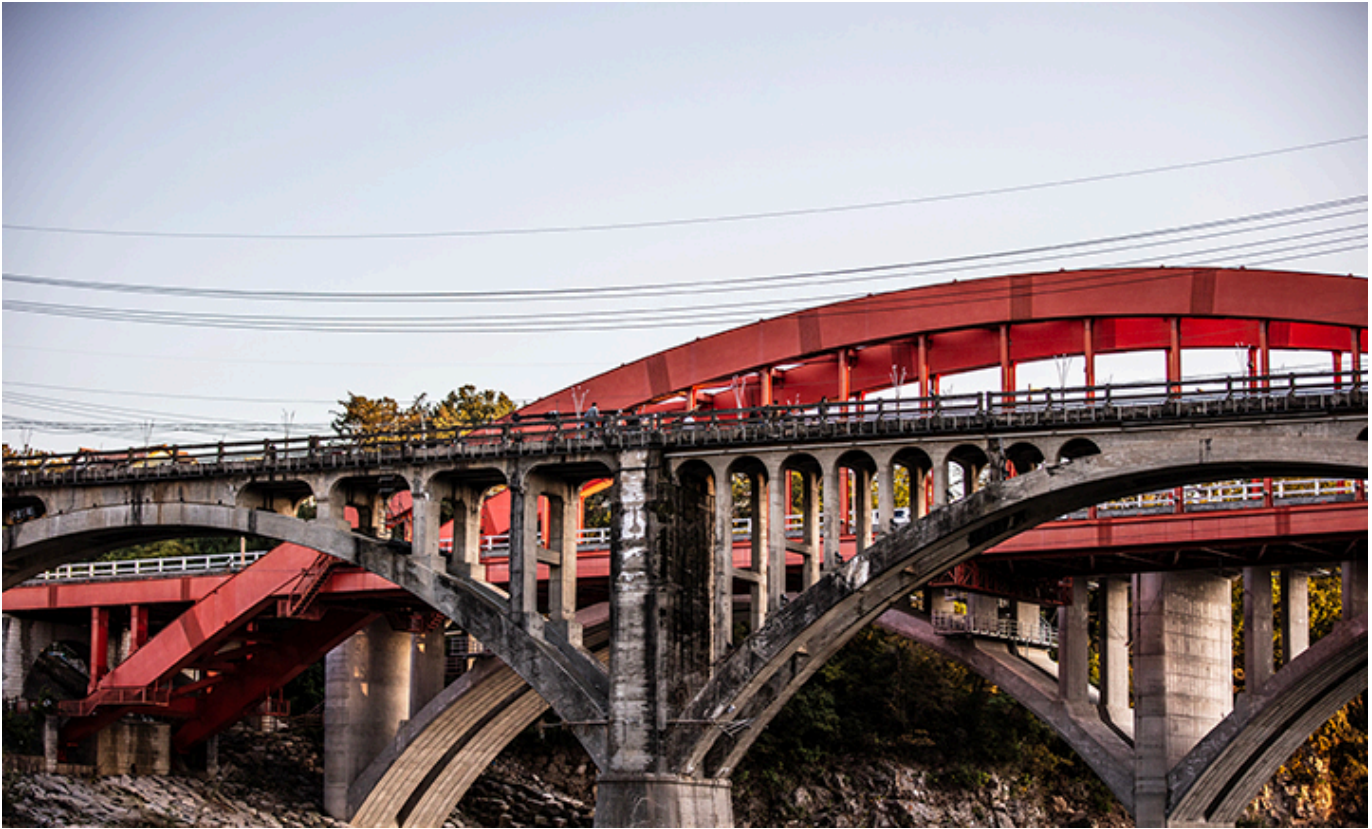
Most dzielący dwie Koree, kadr z filmu „Chopin. Nie boję się ciemności”

[Redacted text area consisting of multiple horizontal black bars]