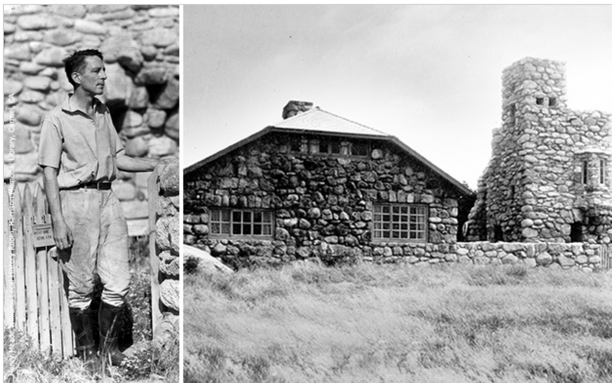
Robinson Jeffers i jego dom w Carmel na wybrzeżu Kalifornii.

Echa tych sanskryckich wierszy można znaleźć u Jeffersa, kiedy mówi o hałasie, który czyni słońce ”, a także o „ wojnie, łamiącej