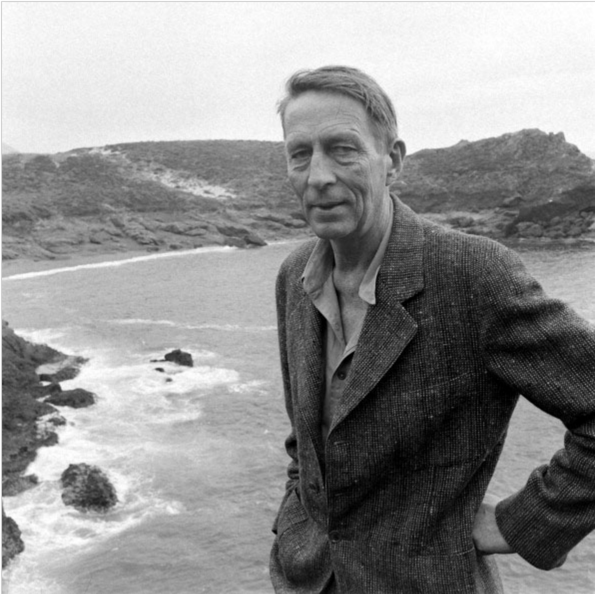
Robinson Jeffers, fot Getty Images.

Ów kosmiczny wymiar egzystencji wyznawany i proponowany przez Jeffersa pozwalał poecie na taki dialog z oceanem. Jest we mnie starsze, twardsze i bardziej bezstronne oko, mówił do oceanu, niż to, które patrzyło na ciebie jak wypełniałeś swe dno zagęszczając ciężką mgłę i określając w dół swe granice, jedząc skałę i zamieniając się na miejsca z kontynentami.