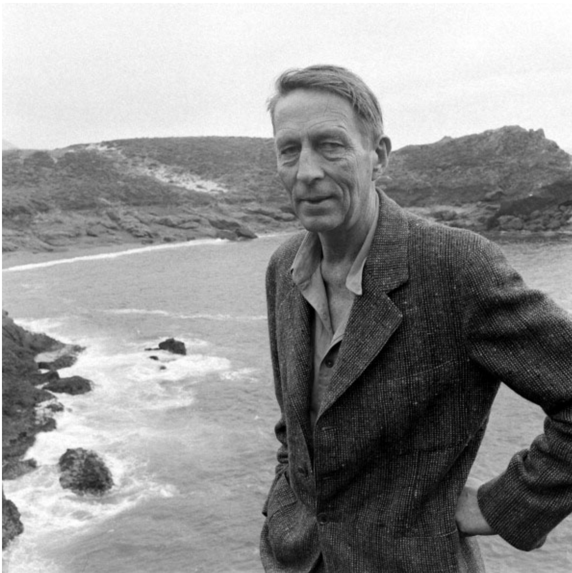
Robinson Jeffers

Podziwiałem piękno wtedy gdy byłem człowiekiem, teraz jestem częścią piękna. Wędruję w powietrzu będąc, ogólnie, gazem i wiatrem i tym co krąży w oceanie. Dotykam ciebie i Azji w tej samej chwili; zanurzam rękę we wschodzie słońca i w iskrzeniu trawy. Zostawiłem światło aby się sączyło z grobu do ziemi na dowód swojej miłości.