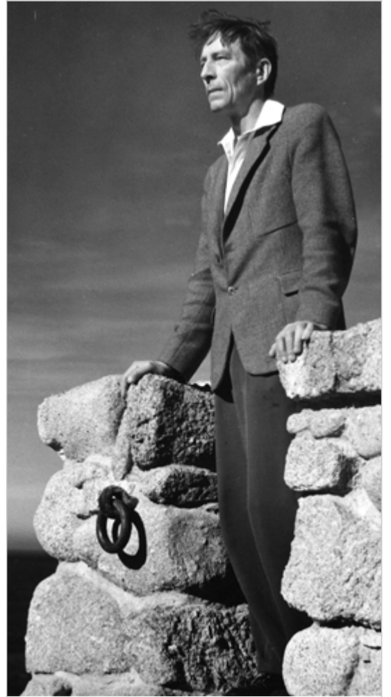
Robinson Jeffers, 1940 r.

Kiedy ptaki nadciągną znowu znad wód, niech zakwilą wieloma głosami. A myśli ludzkie niech im odpowiedzą też na wiele głosów, wieloma językami, wieloma wierszami. Bo mnogość myśli jest potrzebna duszy ludzkiej. Mnogość takich kwilących myśli, gdy nastaje nowy świt nad skałami Wielkiego Południa. Potrzebne są duszy ludzkiej dźwięcznie hałasujące sokoły i mewy i kormorany. Nad skałami i piaszczystymi brzegami światów,