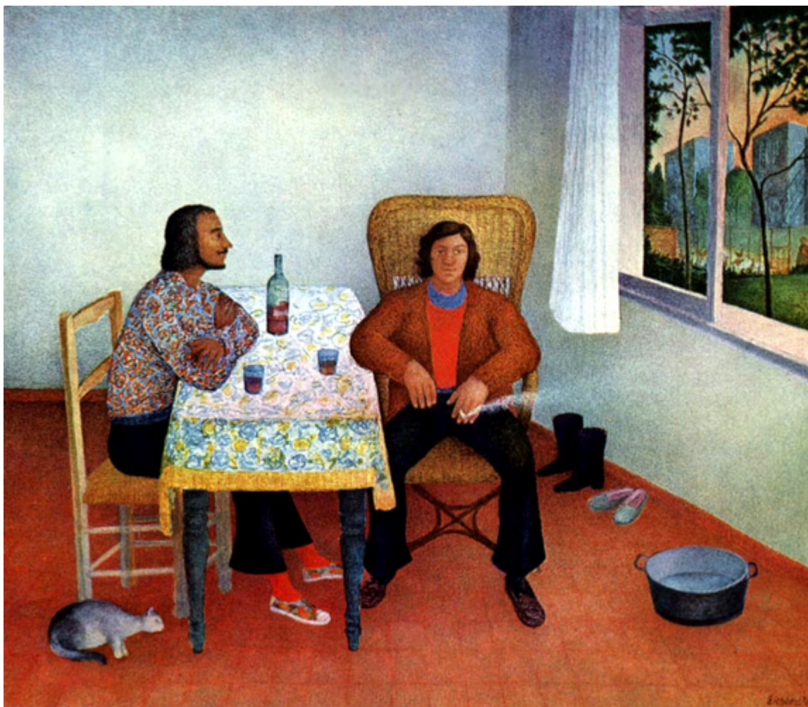
Janusz Eichler, Spotkanie , olej na płótnie, fot. Archiwum Emigracji.