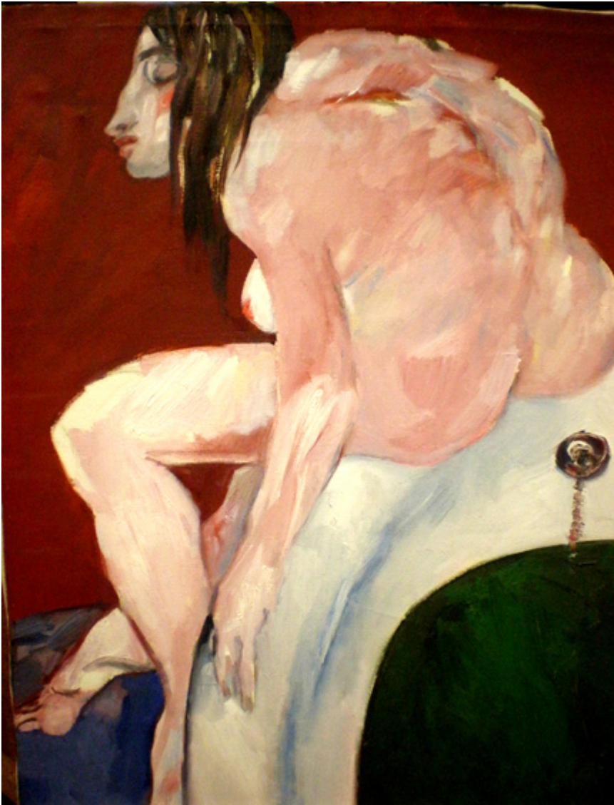
Stanisław Frenkiel, Przed kąpielą, olej na płótnie, ok. 1985 r., Muzeum UMK