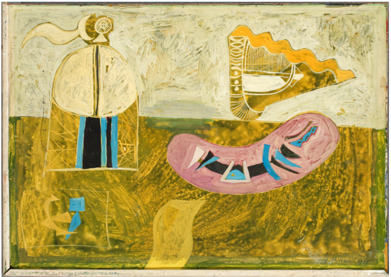
Jan Marian Kościalkowski, Kompozycja, akryl, papier, 1975 r., Archiwum Emigracji, fot. Jan Wiktor Sienkiewicz