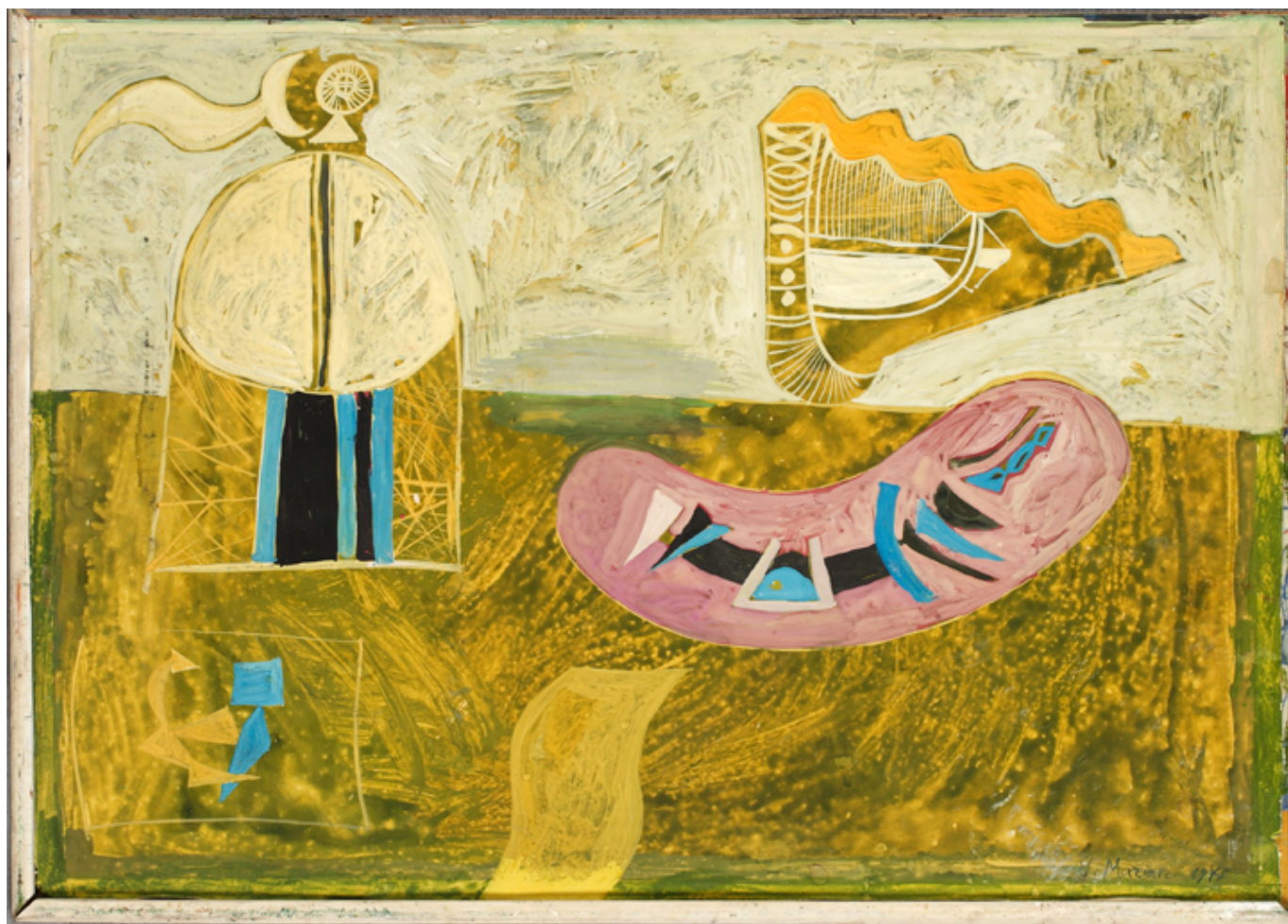
Jan Marian Kościałkowski, Kompozycja, akryl, papier, 1975 r., Archiwum Emigracji