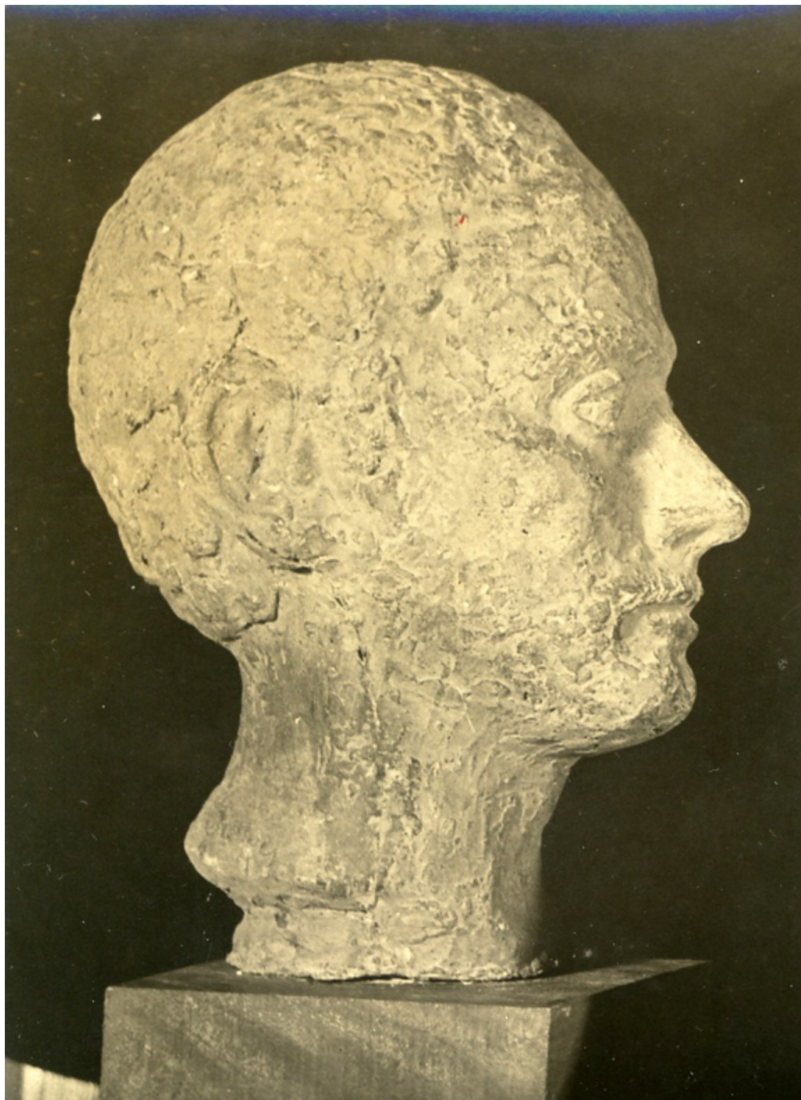
Janusz Eichler, Głowa, rzeźba 1947 r.