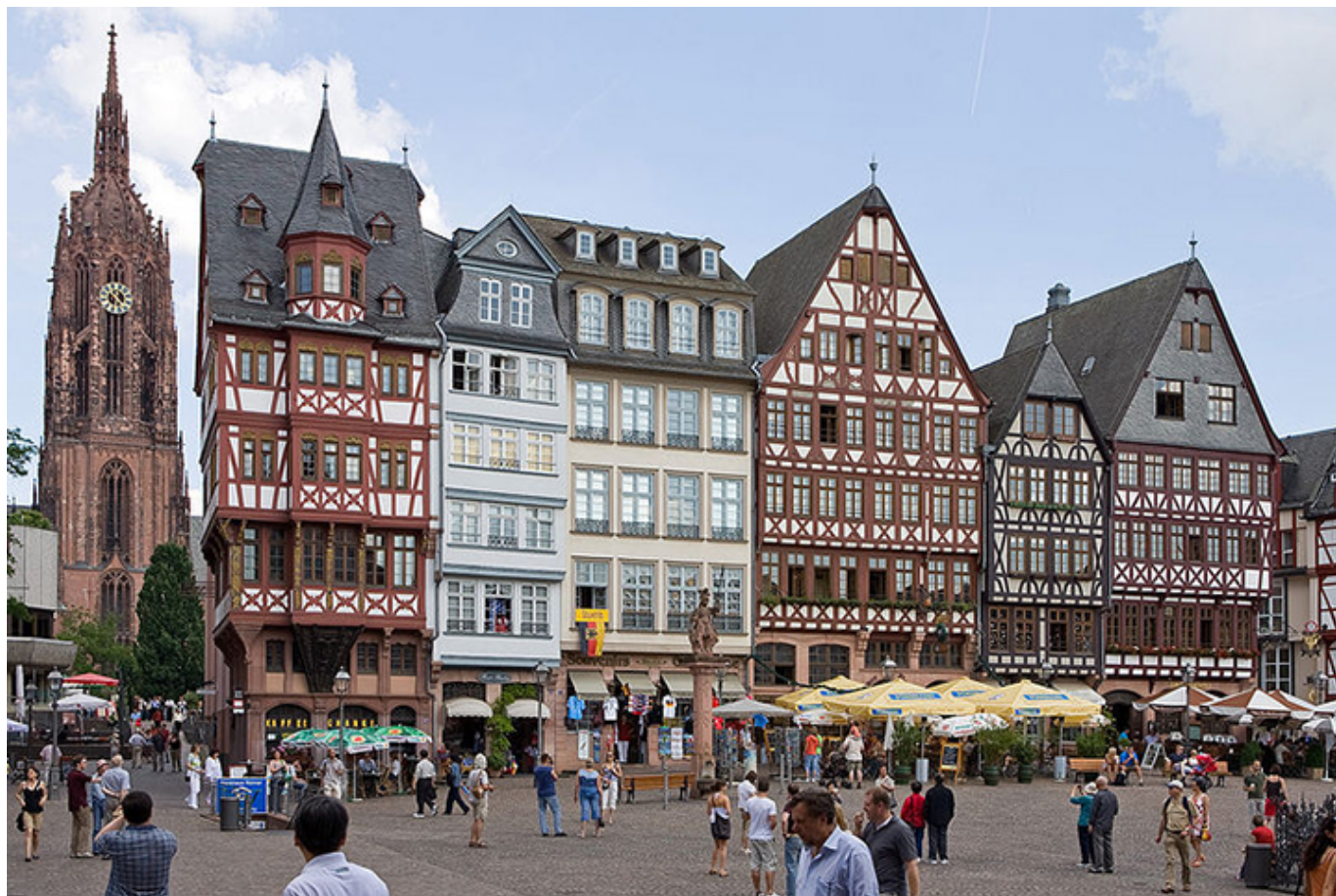
Frankfurt nad Menem. Sobotnie Wzgórze.