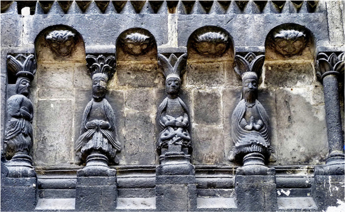
Ratyzbona. Płaskorzeźba na szkockim kościele św. Jakuba.