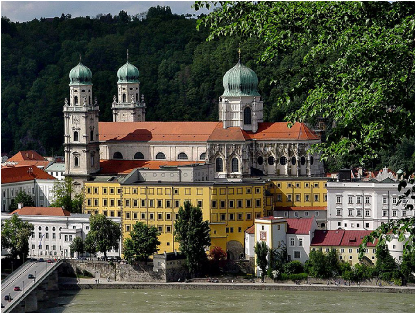
Pasawa. Widok na Katedrę św. Szczepana ze wzgórza Panny Marii Wspomożycielki.