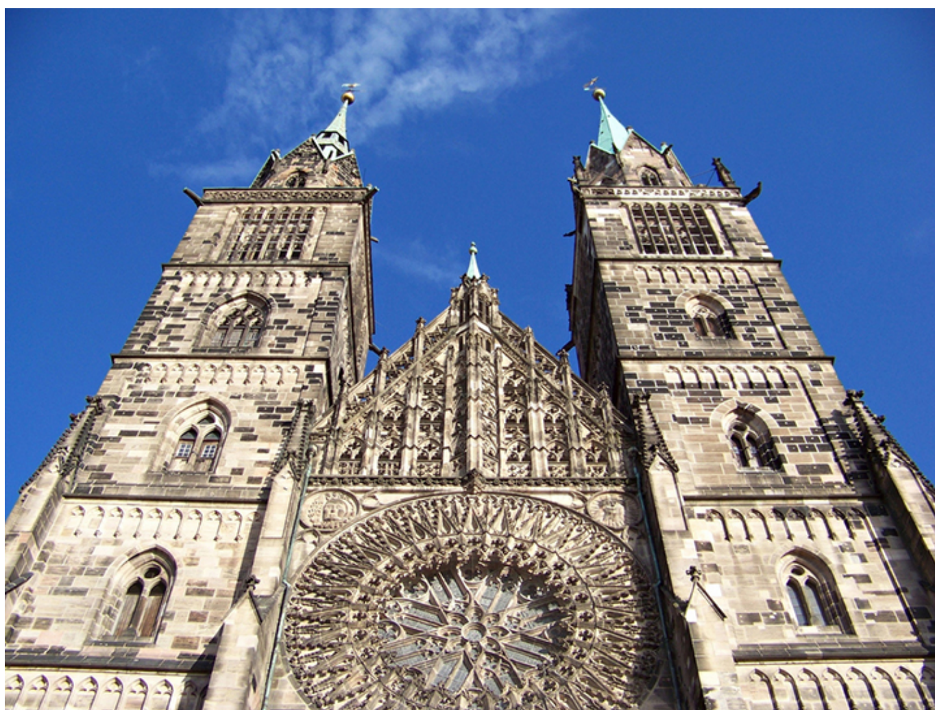
Norymberga. Kościół św. Wawrzyńca.

St. Jakob ). Założony w 1090 r. przez mnichów irlandzkich, później był siedzibą mnichów szkockich. Poczerniała od spalin fasada jest osłonięta szklanym gankiem. Symetrycznie usytuowane postaci ludzi i zwierząt (krokodyle, niedźwiedzie, wilki), oplecione roślinnymi ozdobami kolumny, a wszystko to w najlepszym romańskim guście. Na koniec wspaniałe rokokowe wnętrze kościoła św. Emmerama, zbudowanego najpierw w stylu romańskim w XII w. Obok Starej Kaplicy ten właśnie kościół stanowi najpiękniejsze, najbardziej eleganckie w całej Ratyzbonie osiemnastowieczne wnętrze. Okazuje się, że to właśnie w Ratyzbonie jest największa średniowieczna starówka w całych Niemczech.