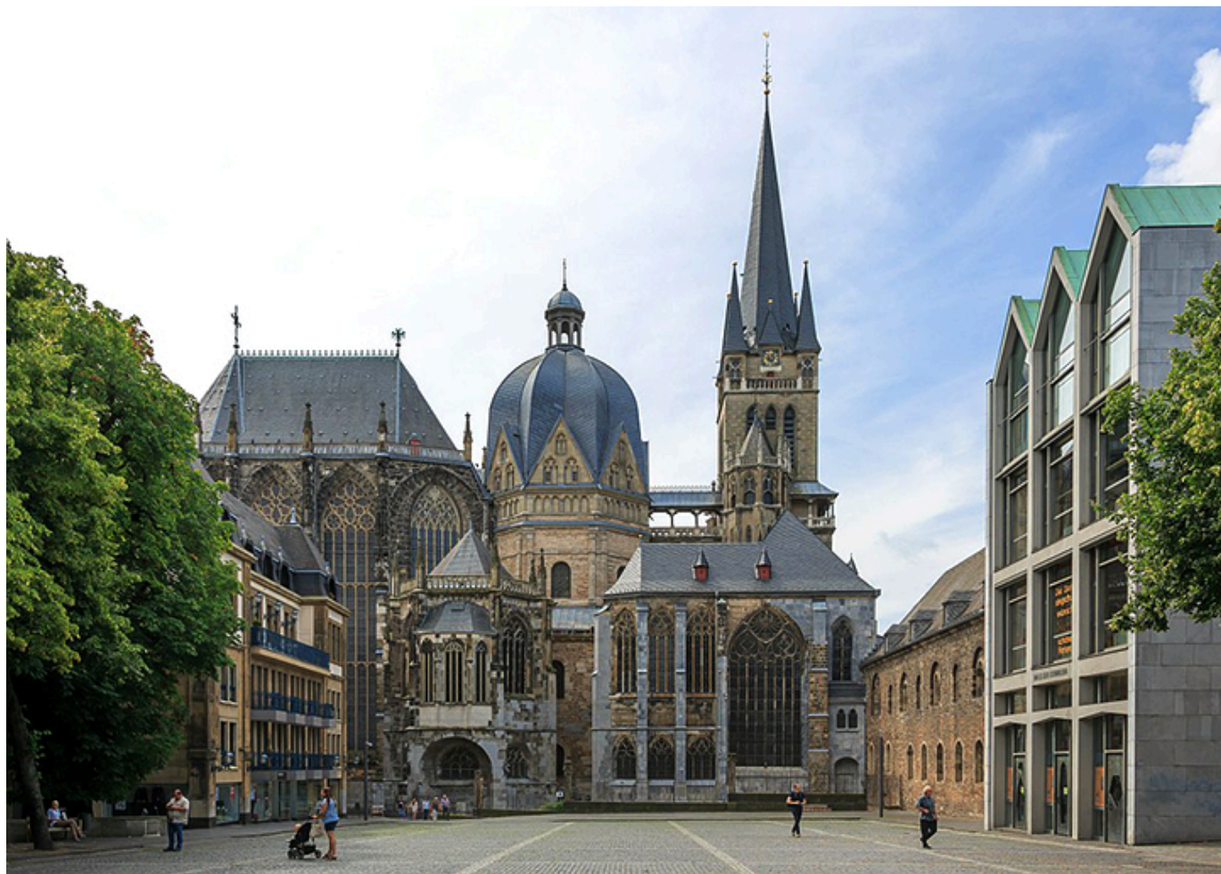
Katedra w Akwizgranie.