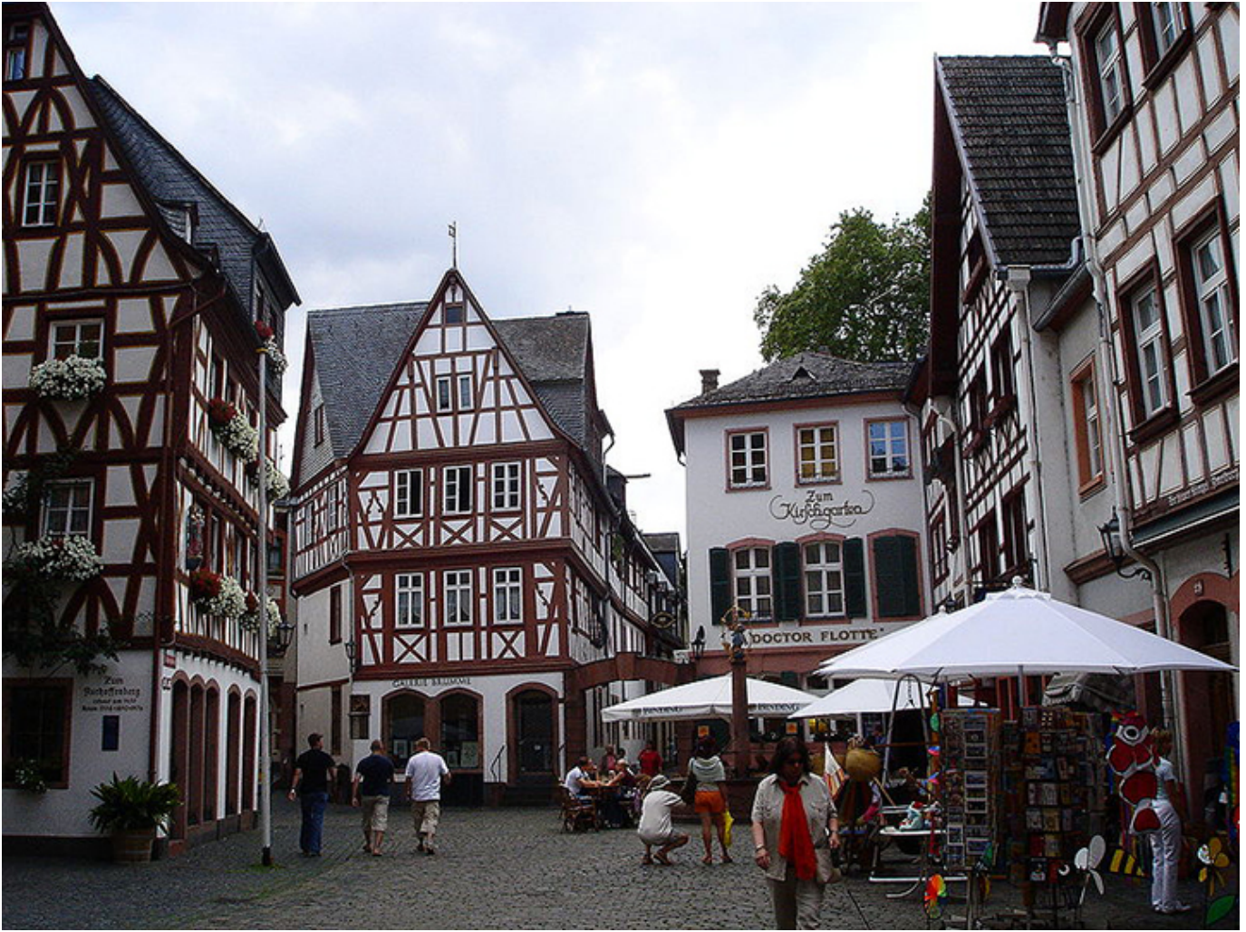
Moguncja. Wiśniowy Sad.