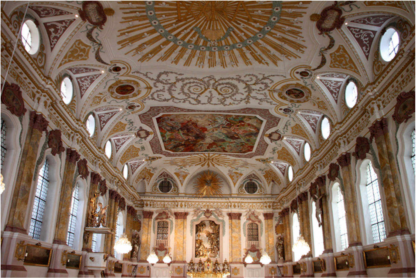
Monachium. Wnętrze Mieszczańskiej Sali.