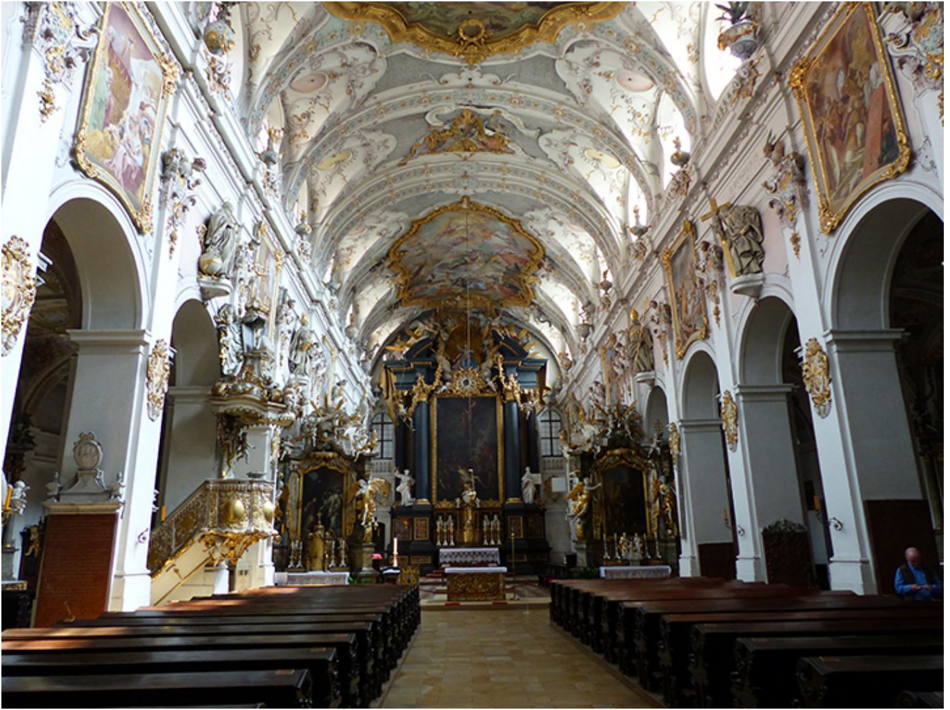
Bazylika św. Emmerama w Ratyzbonie.