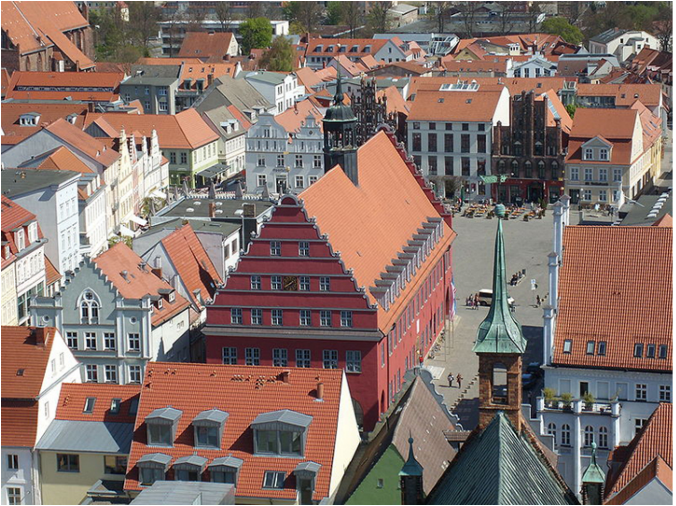
Greifswald. Ratusz na Rynku z wieży Katedry św. Mikołaja.