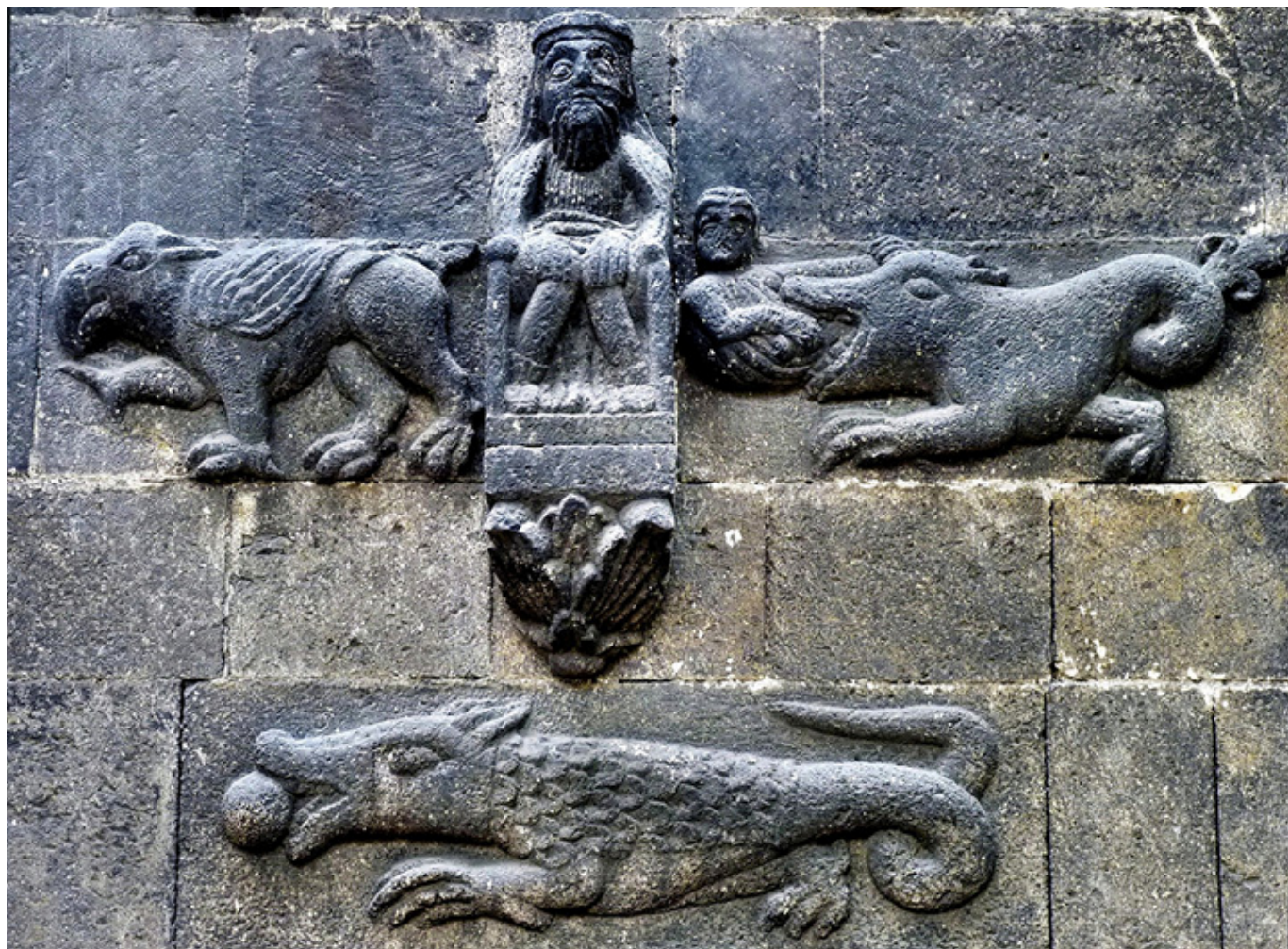
Ratyzbona. Płaskorzeźba na szkockim kościele św. Jakuba