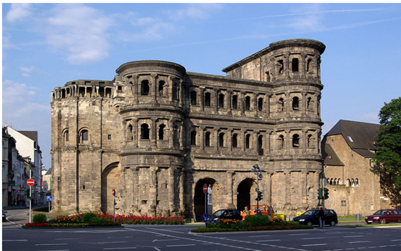
Trewir. Porta Nigra.