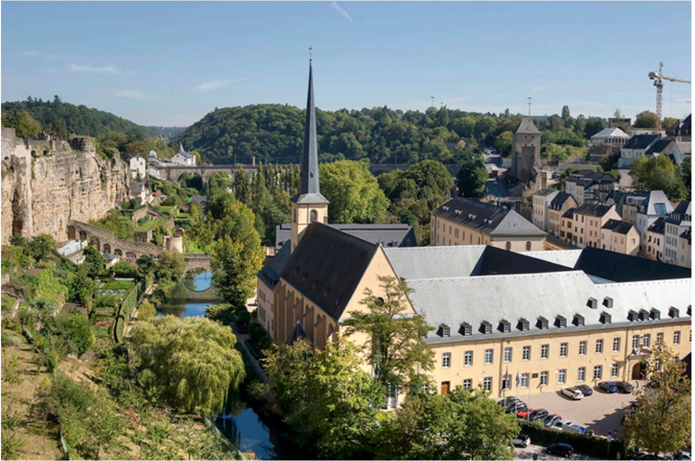
Luksemburg. Kościół św. Jana.