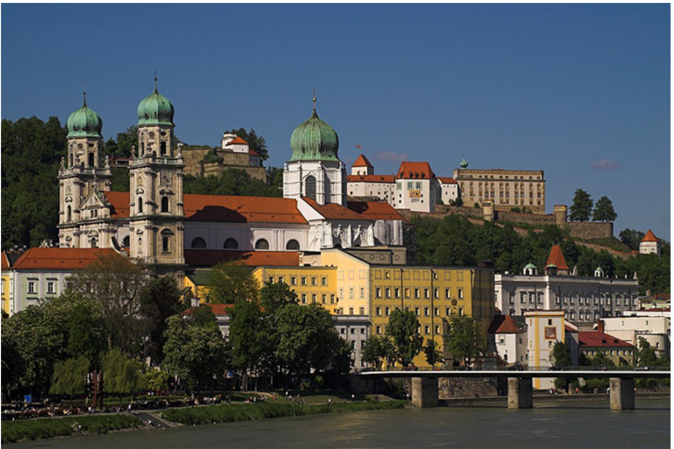
Pasawa. Katedra i Górny Zamek.

Wspinam się potem na wzgórze z kościołem Matki Boskiej Pomocnej. Wewnątrz Matka Boska z Dzieciątkiem, kopia oryginału z Innsbrucku , a oryginał jest pędzla