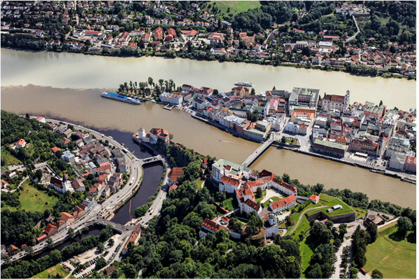
Pasawa. Miasto trzech rzek. Dunaj, Inn i Ilz.