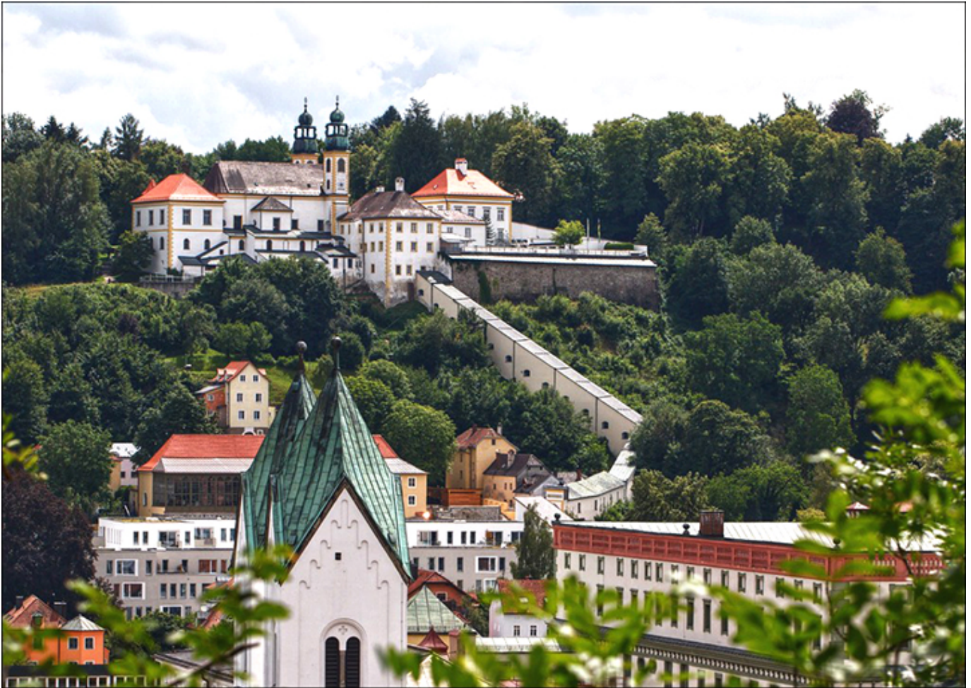
Kościół Pielgrzymkowy Panny Marii Wspomożycielki w Pasawie.