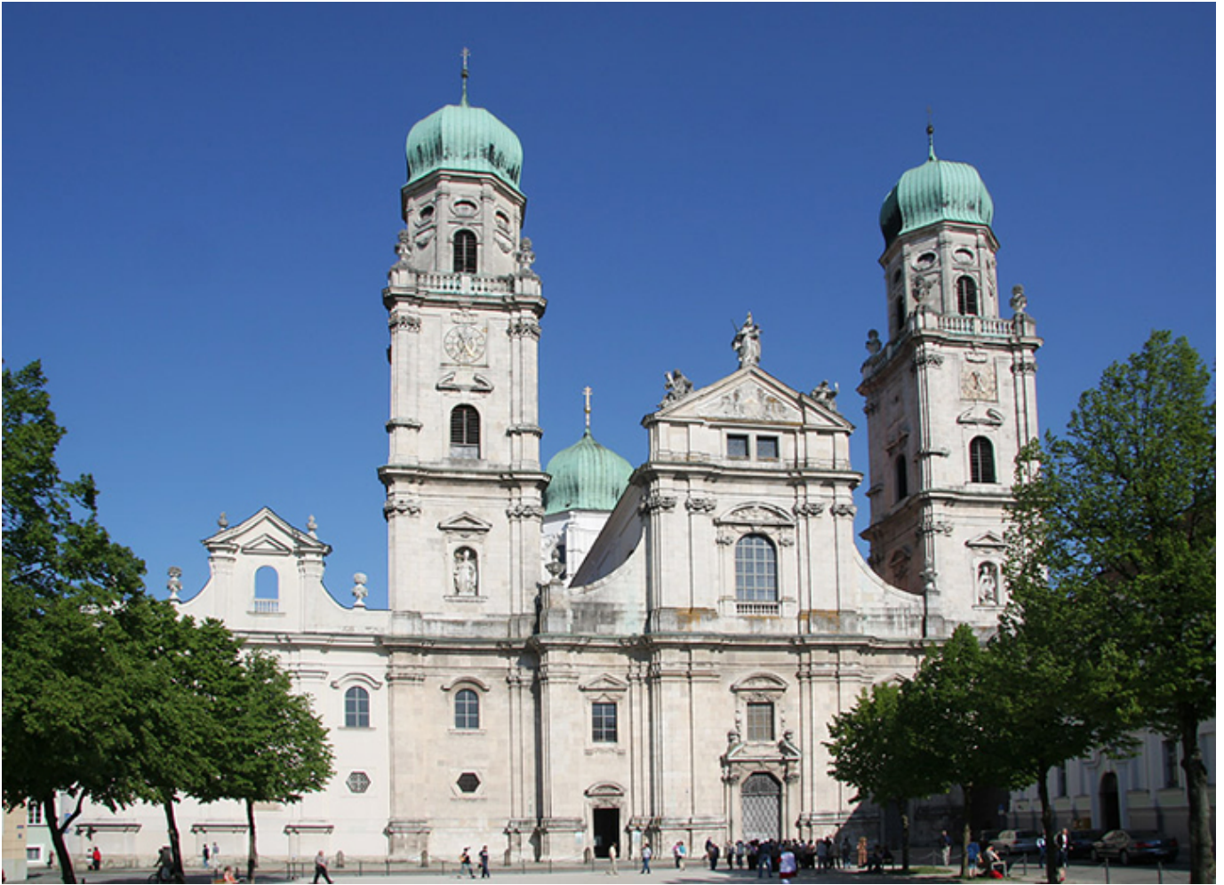
Katedra św. Szczepana w Pasawie.