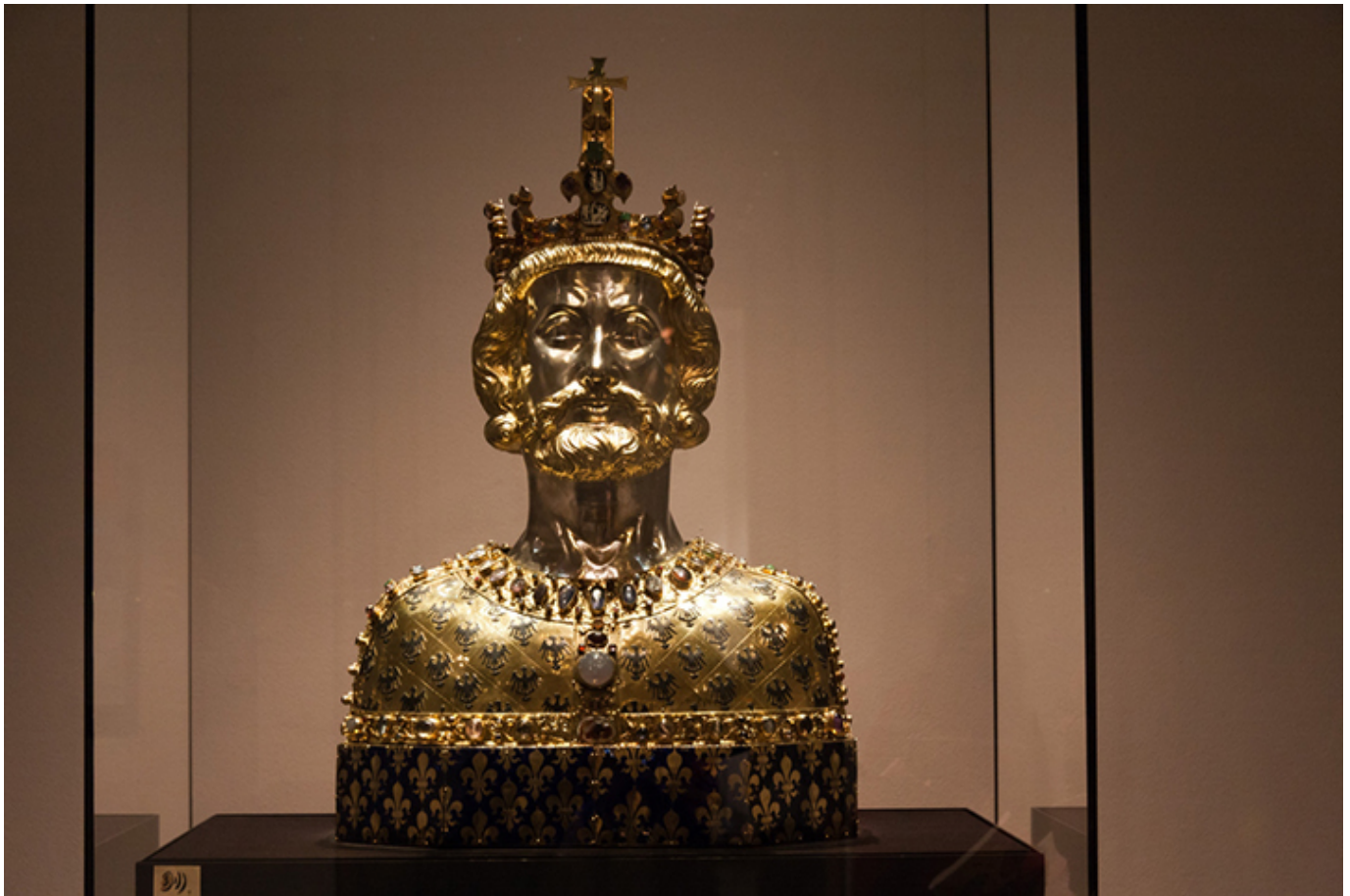
Akwizgran. Karol Wielki.

ozdobiony posągami w niszach na najwyższym piętrze. Wielki ratusz oraz kamienica Löwensteina w rynku są także gotyckie i pochodzą z XIV w. Warowna brama Marchientor została ukończona na początku XIV w. i wchodziła w skład murów obronnych miasta. Przed ratuszem posąg Karola Wielkiego w zbroi i z cesarskimi insygniami, z XVII w. W parku zdrojowym pseudorokokowy Pawilon Couvena, postawiony po II wojnie.