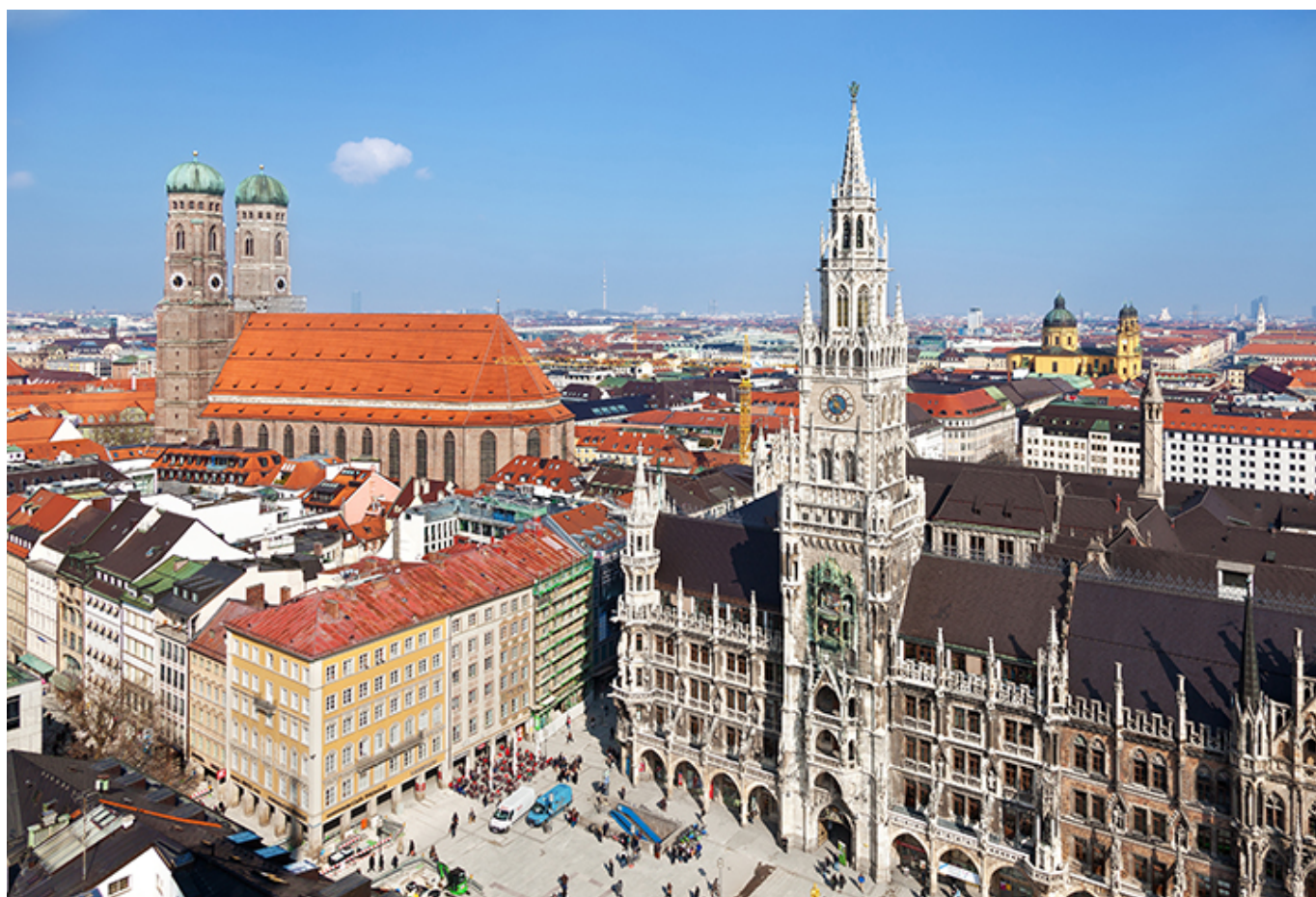
Stare Miasto w Monachium

podróży do tego miasta, Stara Pinakoteka ( Alte Pinakothek ). Dopiero czwarta pytana przeze mnie osoba umiała mi wskazać do niej drogę. Długi blade czerwony budynek, a w nim prawdziwe skarby. Niemożliwością jest obejrzenie wszystkich obrazów, dlatego wybieram moich ulubionych malarzy flamandzkich, włoskich, niemieckich i hiszpańskich, a wśród nich przykuwają moją uwagę Dürer, Cranach, Fra Filippo Lippi, Hans Memling, Martin Schaffner, Rogier van der Weyden, Pantoja de la Cruz. Potem zabytki Starego Miasta: potężny kościół Frauenkirche z charakterystycznymi bliźniaczymi kopułami (wewnątrz całkowicie odbudowany po bombardowaniu), kościół św. Michała z wykonanym przez Bertela Thorvaldsena klasycystycznym grobowcem Eugeniusza de Beauharnais (1781-1824), przybranego syna Cesarza Napoleona. Książę Eugeniusz zmarł na apopleksję właśnie w Monachium i tu z wielką pompą został pochowany.