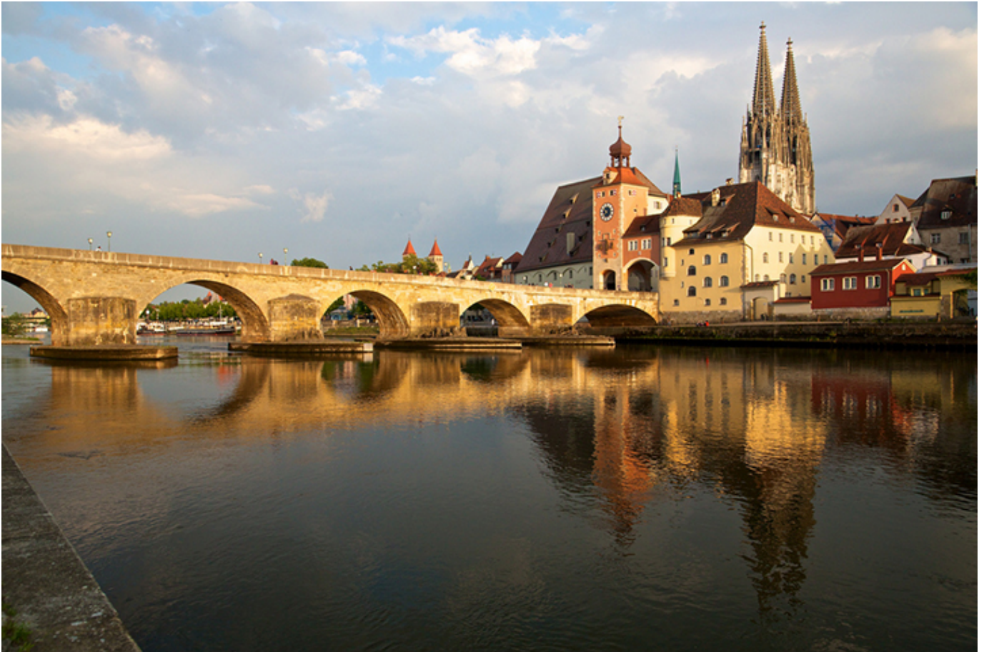
Stary Most i Katedra w Ratyzbonie