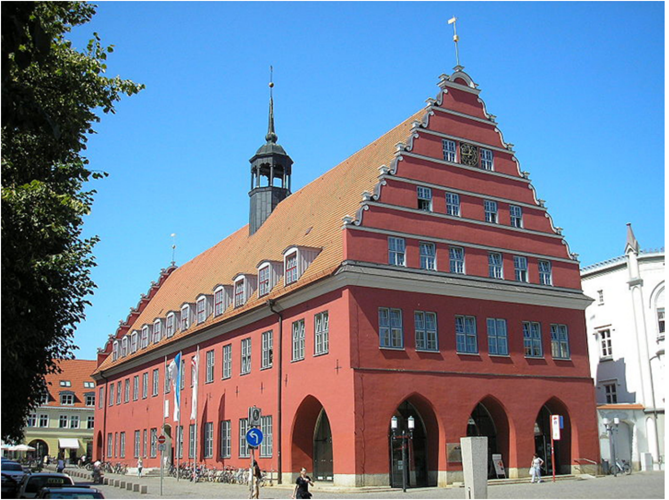
Gotycko-barokowy ratusz w Greifswaldzie.