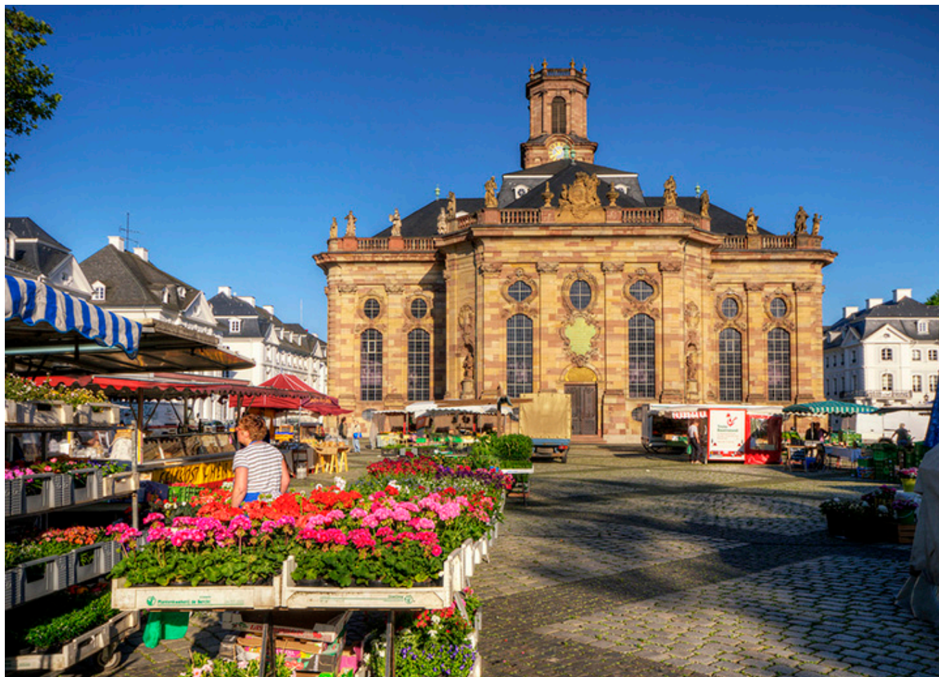
Saarbrücken. Rynek Kwiatowy i kościół św. Ludwika.