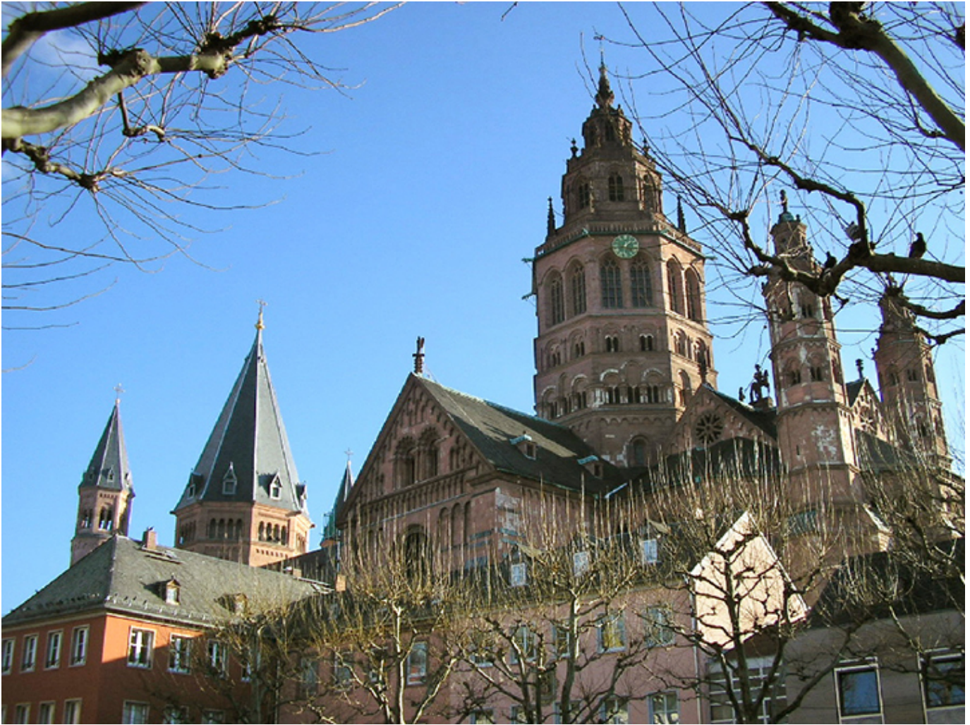
Katedra w Moguncji

(1400-1468), wykonany przez Thorvaldsena w 1837 r. Gutenberg urodził się i zmarł właśnie w Moguncji . Jeszcze wychylam się nad Ren. Szeroko rozlany, czekoladowy, niezbyt atrakcyjnie się prezentuje. O godzinie 21.45 rusza autobus do Wrocławia, dokąd docieram nazajutrz o 8.30.