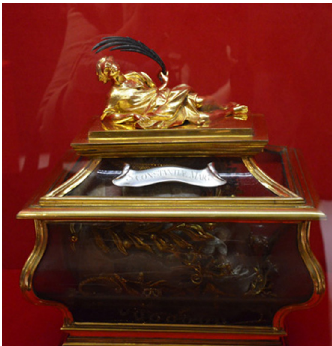
Relikwiarz św. Konstancji, 1. poł. XVIII w.