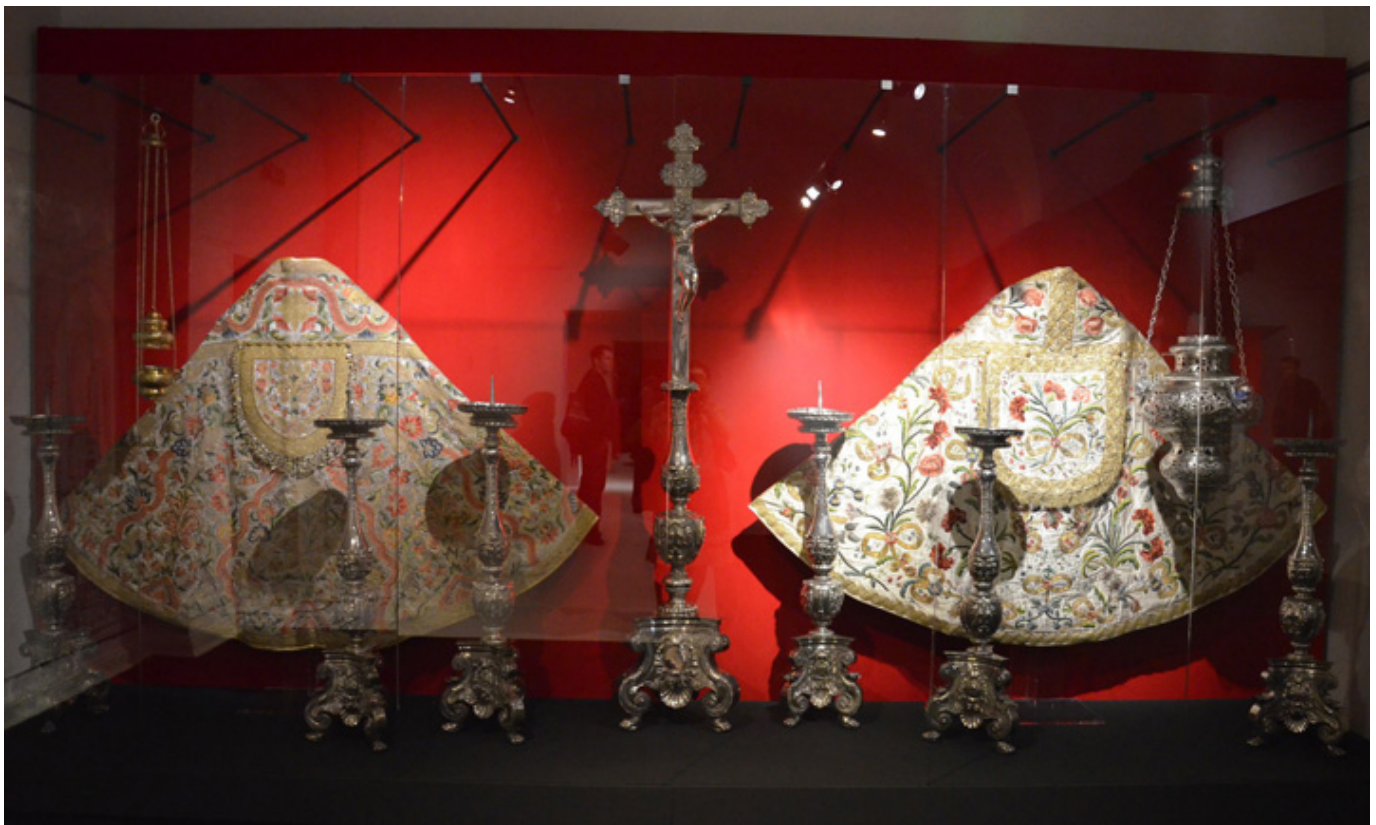
Komplet ołtarzowy krucyfiks, sześć świeczników, Christian Mentzel - Starszy 1692-95, fot. B. Lekarczyk-Cisek.

Na uwagę zasługują także liczne relikwiarze - prawdziwe arcydzieła sztuki złotniczej, różniące się od siebie kształtami i stylem wykonania. Są wśród nich m.in. relikwiarz św. Jana Chrzciciela, patrona Archikatedry - dzieło Caspara Pfistera, herma relikwiarzowa św. Wincentego Tobiasza Plackwitza z 1723 roku, relikwiarz św. Konstancji z 1. połowy XVIII wieku.