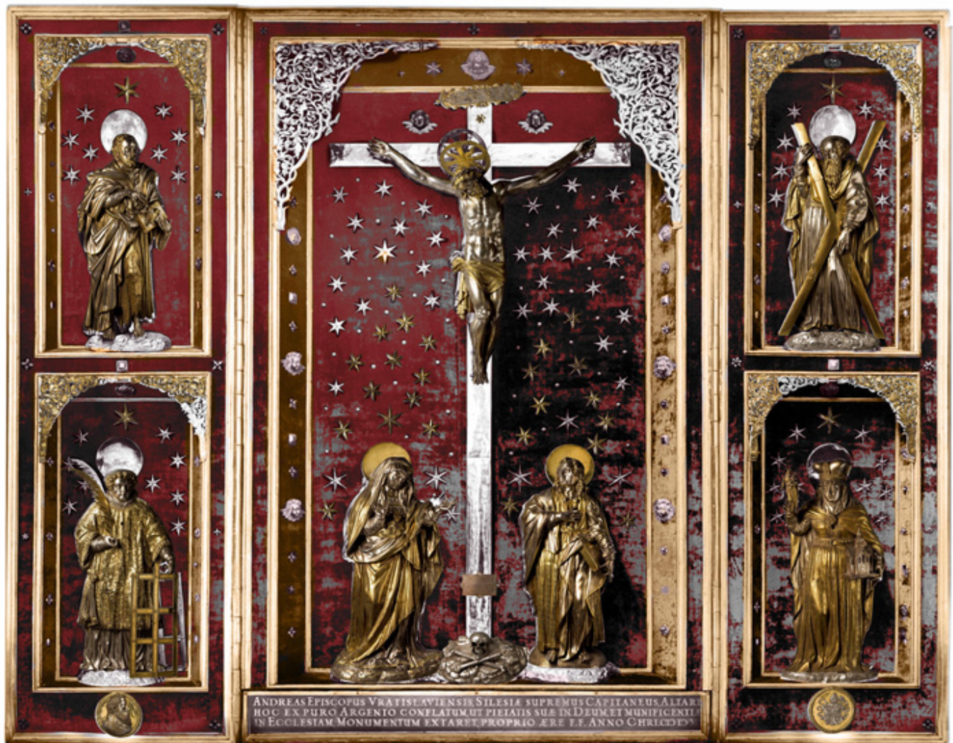
Ółtarz główny Katedry