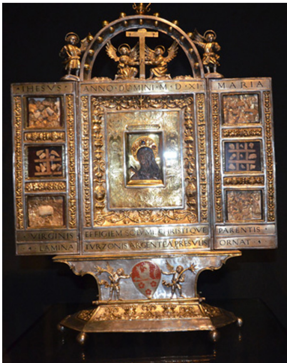
Ołtarzyk relikwiarzowy biskupa Johanna V. Thurzonia, 1511 r., fot. B. Lekarczyk-Cisek.