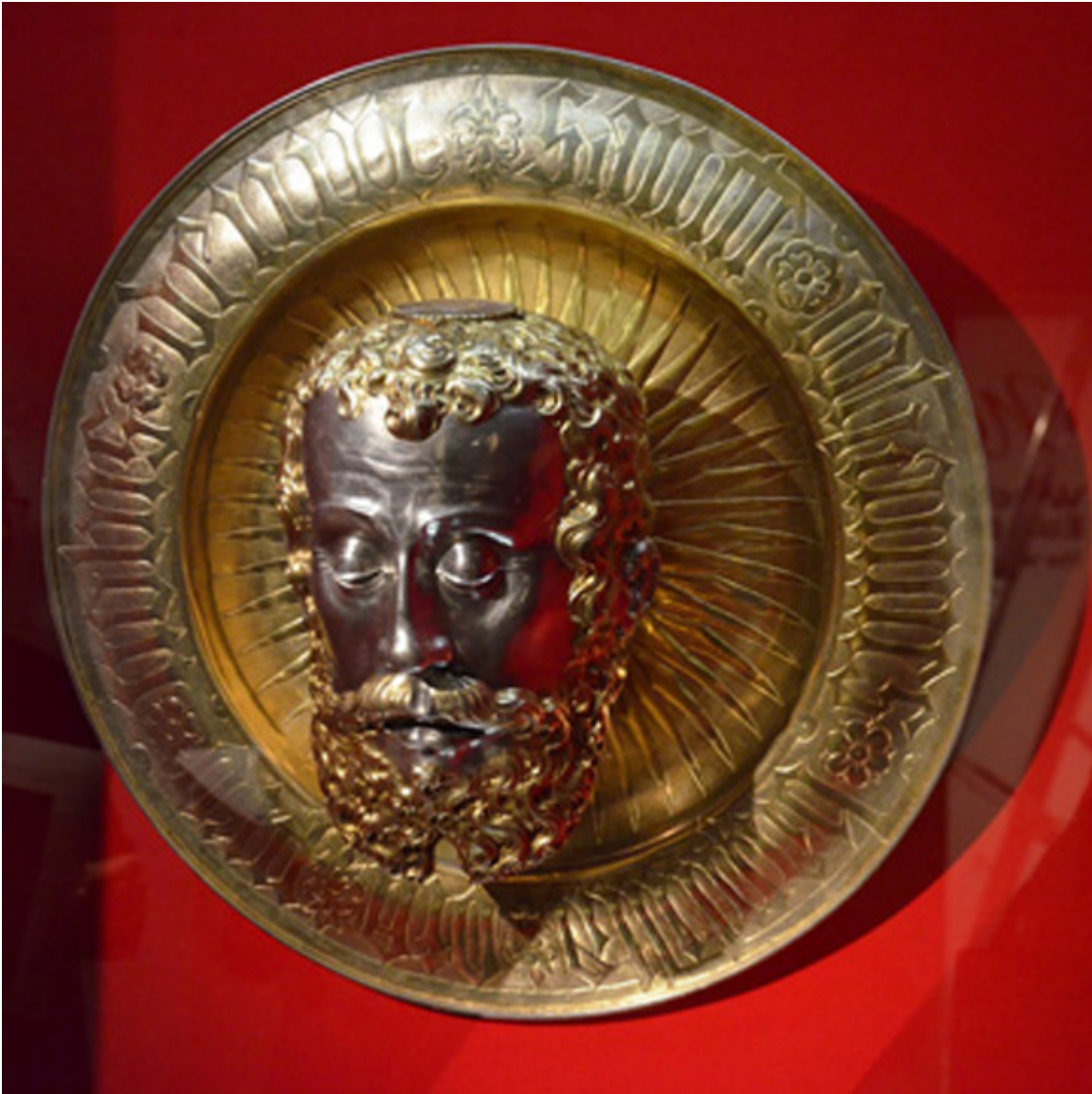
Relikwiarz św. Jana Chrzciciela, Caspar Pfoster 1611 r.