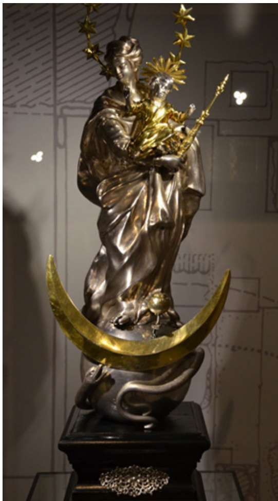
Matka Boska Niepokalanie Poczęta, Johann Klinge 1736, fot. B.-Lekarczyk-Cisek.

wrocławskie siostry urszulanki w 1792 r. dla uświetnienia jubileuszu 500-lecia opactwa w Krzeszowie, buty biskupie z przełomu XVIII i XIX w. oraz ozdobne rękawiczki - elementy ubioru liturgicznego, które wyszły dziś z użycia i zobaczyć je można już tylko w zbiorach skarbcza.