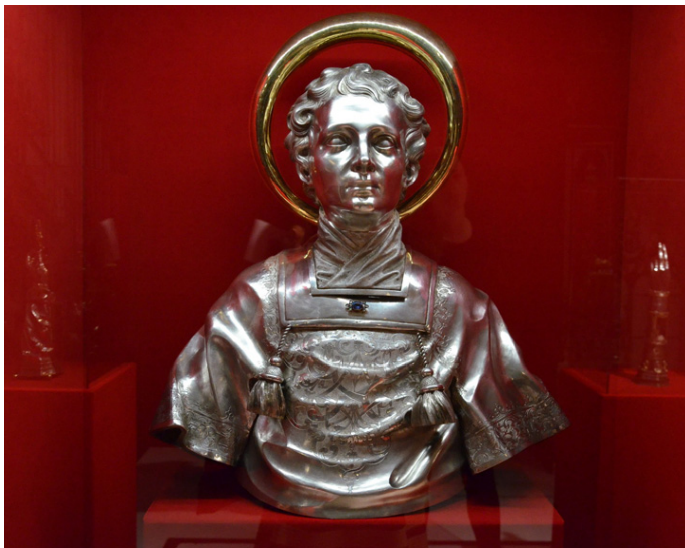
Herma relikwiarzowa św. Wincentego, Tobias Plackwitz 1723, fot. B. Lekarczyk-Cisek.