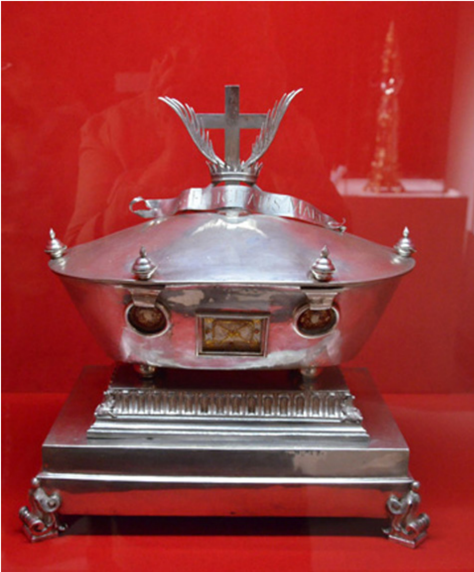
Relikwiarz św. Felicyty, Rzym 1676 r., fot. B. Lekarczyk-Cisek.