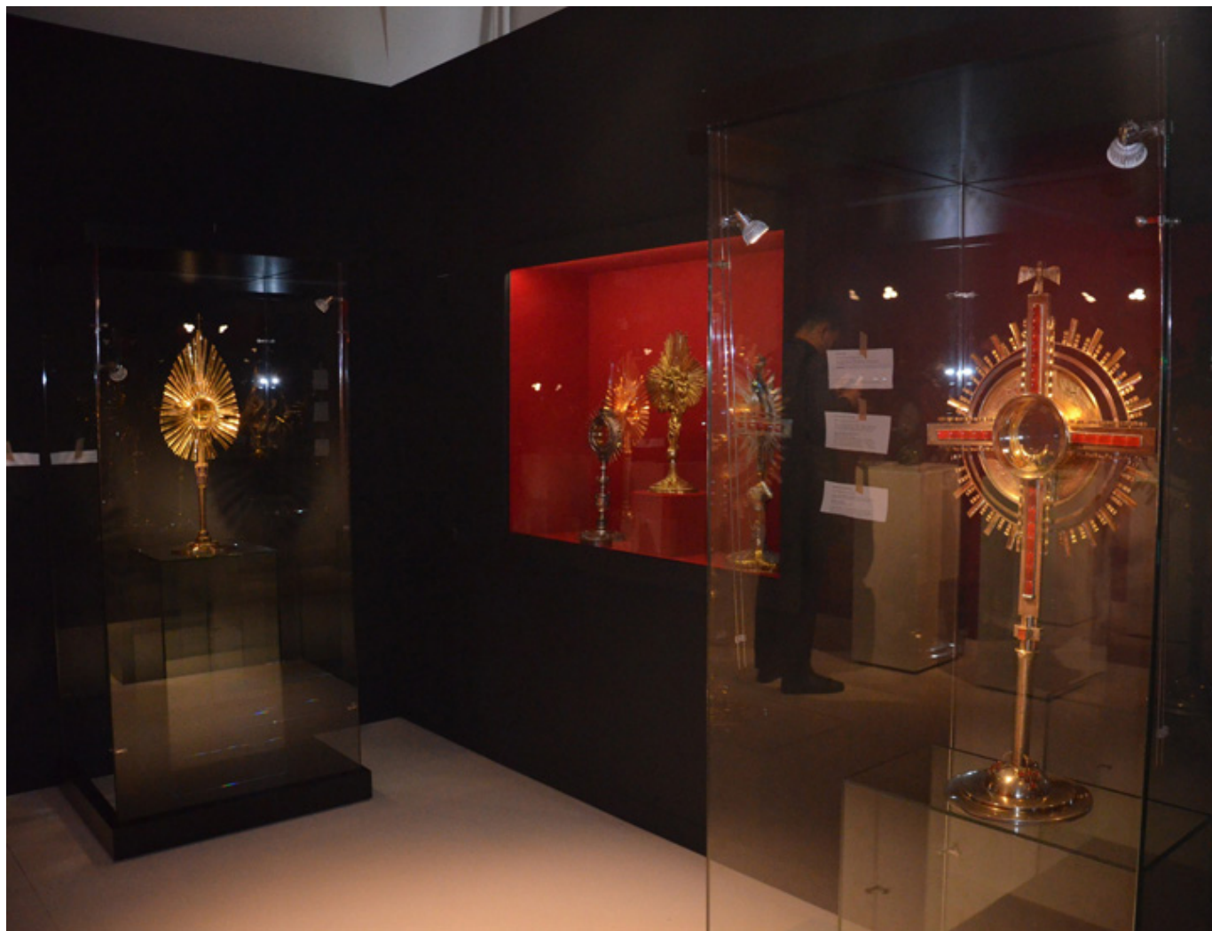
Monstrancje - pierwsza po prawej wykonana przez Ericha Adolfa ok. 1940 r., fot. B. Lekarczyk-Cisek.