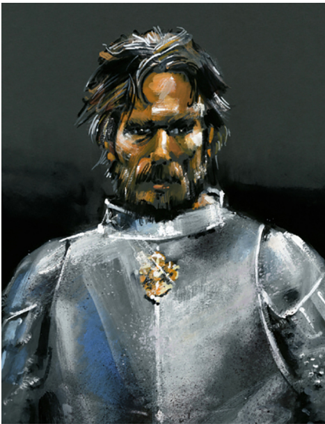
Konrad Mazowiecki, autor: Waldemar Świerzy, copyright: Kreacja Pro.