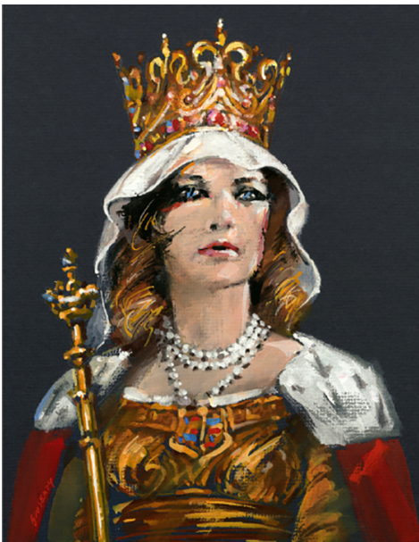
Królowa Jadwiga, autor: Waldemar Świerzy, copyright: Kreacja Pro.