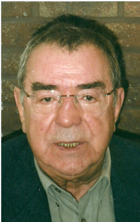
Prof. Waldemar Świerzy

W dniu 18 maja 2015, już po śmierci Waldemara Świerzego, na Zamku Królewskim w Warszawie doszło do wernisażu wspaniale przygotowanej wystawy, której towarzyszył pięknie wydany album Nowy poczet władców Polski . Waldemar Świerzy kontra Jan Matejko . Wystawy na której obok siebie zaprezentowano oba poczty z odpowiednimi opisami.