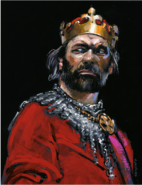
Bolesław Śmiały, autor: Waldemar Świerzy, copyright: Kreacja Pro.