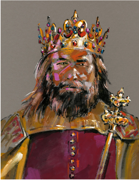
Kazimierz Wielki, autor: Waldemar Świerzy, copyright: Kreacja Pro.