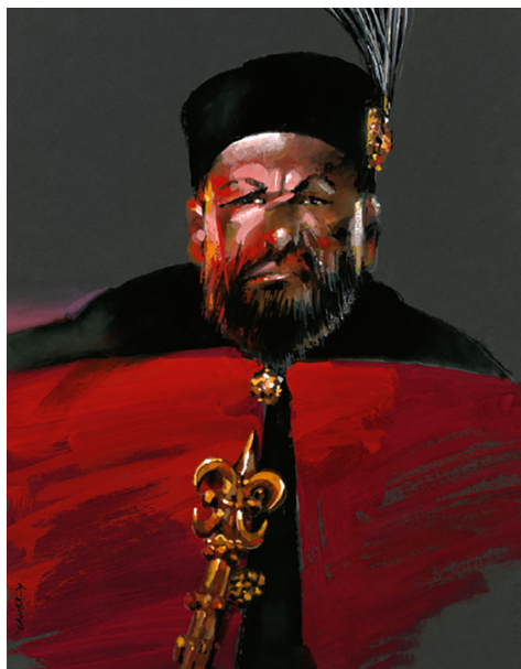
Stefan Batory, autor: Waldemar Świerzy, copyright: Kreacja Pro.

To malowanie miało jednak swoją dramaturgię. Matejko swój poczet malował dwa lata (od lutego 1890 - do końca stycznia 1892), natomiast Świerzemu, w związku z perturbacjami ze sponsorami, zajęło 7 lat, zaś od pomysłu Andrzeja Pągowskiego do wystawy na Zamku Królewskim w Warszawie aż 10 lat.