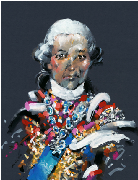
Stanisław August Poniatowski, autor: Waldemar Świerzy

Początkowo malowanie szło dobrze, po namalowaniu dwudziestu czterech postaci wydano nawet kalendarz ścienny z dwunastoma na 2008 rok. Potem jednak nastąpiła kilkuletnia przerwa w realizowaniu tego wielkiego przedsięwzięcia. Zbliżający się do osiemdziesiątki Waldemar Świerzy zaczął się obawiać, czy