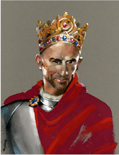
Władysław Jagiełło, autor: Waldemar Świerzy

Do tego poczet Jana Matejki jest niekompletny. Artysta pominął siedmiu nie bardzo wygodnych władców, dodał zaś żony Mieszka I i Mieszka II. W sumie poczet ten liczy 44 jednobarwnych, potem pokolorowanych, ołówkowych rysunków namalowanych przez artystę dla podreperowania domowej kasy, na zamówienie wiedeńskiego wydawcy Maurycego Perlesa. Matejko miał zamiar namalować go następnie olejno, lecz nie wystarczyło mu życia, zmarł 1 listopada 1893 roku.