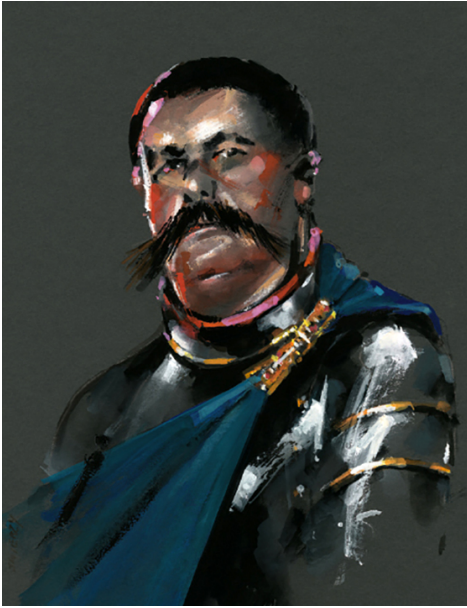
Jan III Sobieski, autor: Waldemar Świerzy, copyright: Kreacja Pro.