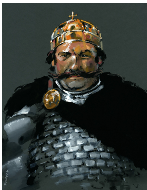
Bolesław Chrobry, autor: Waldemar Świerzy, copyright: Kreacja Pro.