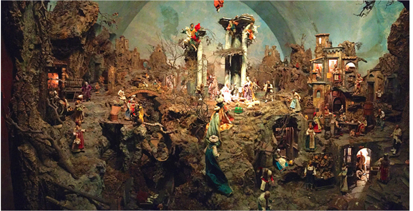
Szopka neapolitańska