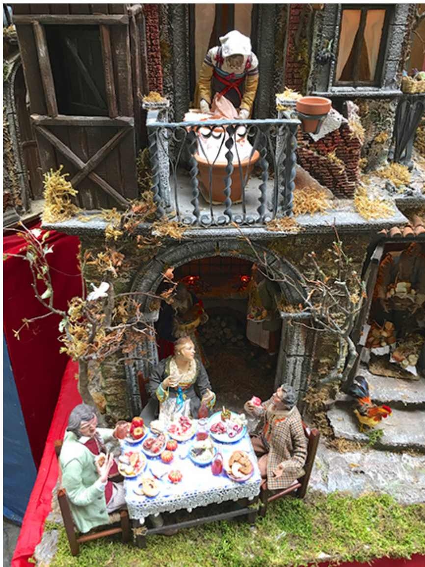
Szopka neapolitańska, fot. http://www.josephtufo.com/

Rozwój wyobraźni i zalecenia trydenckie będą silnie wspierać rozwój szopki neapolitańskiej, którą należy uznać za jedną z najwspanialszych realizacji sztuki konterreformacyjnej. Wizualizacje sprzyjały też aktualizacjom – tak pejzażu, jak i szczegółów obyczajowych. Historia święta coraz bardziej schodzi na ziemię, miesza się z krajobrazem, miejscowymi sytuacjami, wciąga do akcji konkretne żyjące osoby. I tak w 1532 r. – na zamówienie szlachcica z dworu aragońskiego – artysta