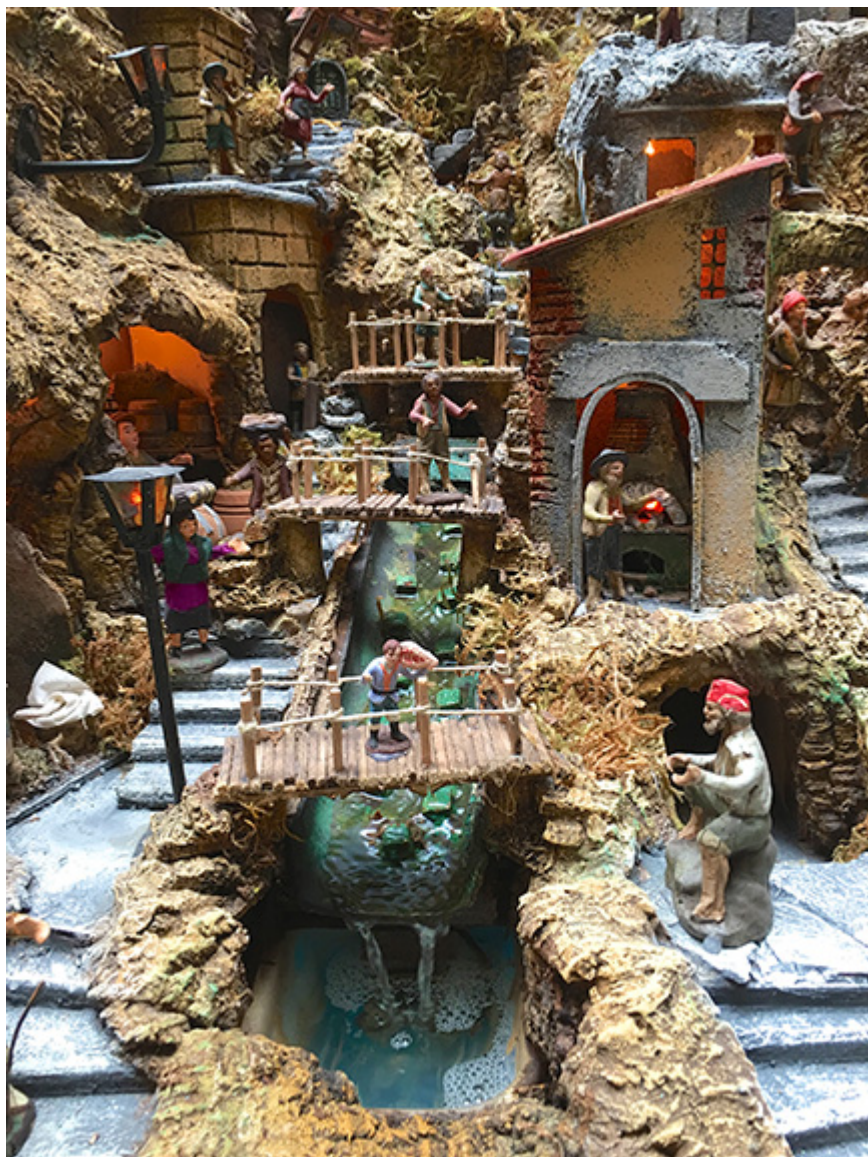
Szopka neapolitańska