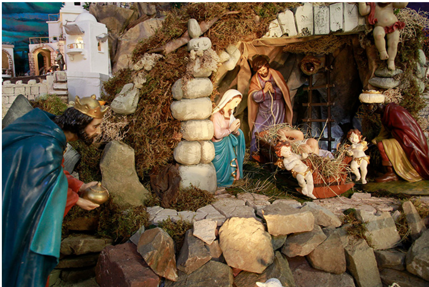
Szopka w Kalwarii Zebrzydowskiej

Rzymskiego o czasie i miejscu narodzenia Syna Bożego w ciele. I kiedy Dzieciątko zostaje włożone do żłóbka, rozbrzmiewa Wśród nocnej ciszy , a gdy zabrzmie Chwała na wysokości , w sanktuarium rozbłyskują światła, na znak, że to Jezus jest światłem dla świata.