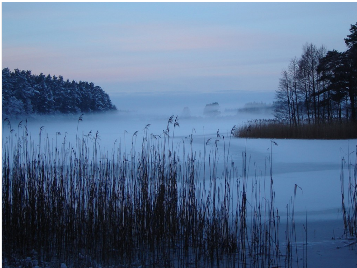
Jeziro Pogorzelec