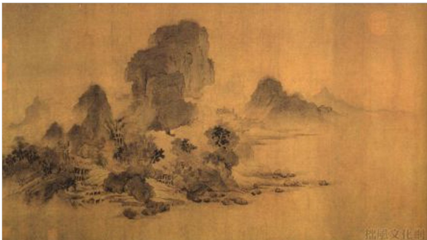
Wang Shen [1036-ok. 1093], Piętrzące się urwiska wyłaniające się z mgły i rzeki.

jednak tematu samego w sobie. Za przykład mglistości w malarstwie chińskim może służyć poniższy obraz: