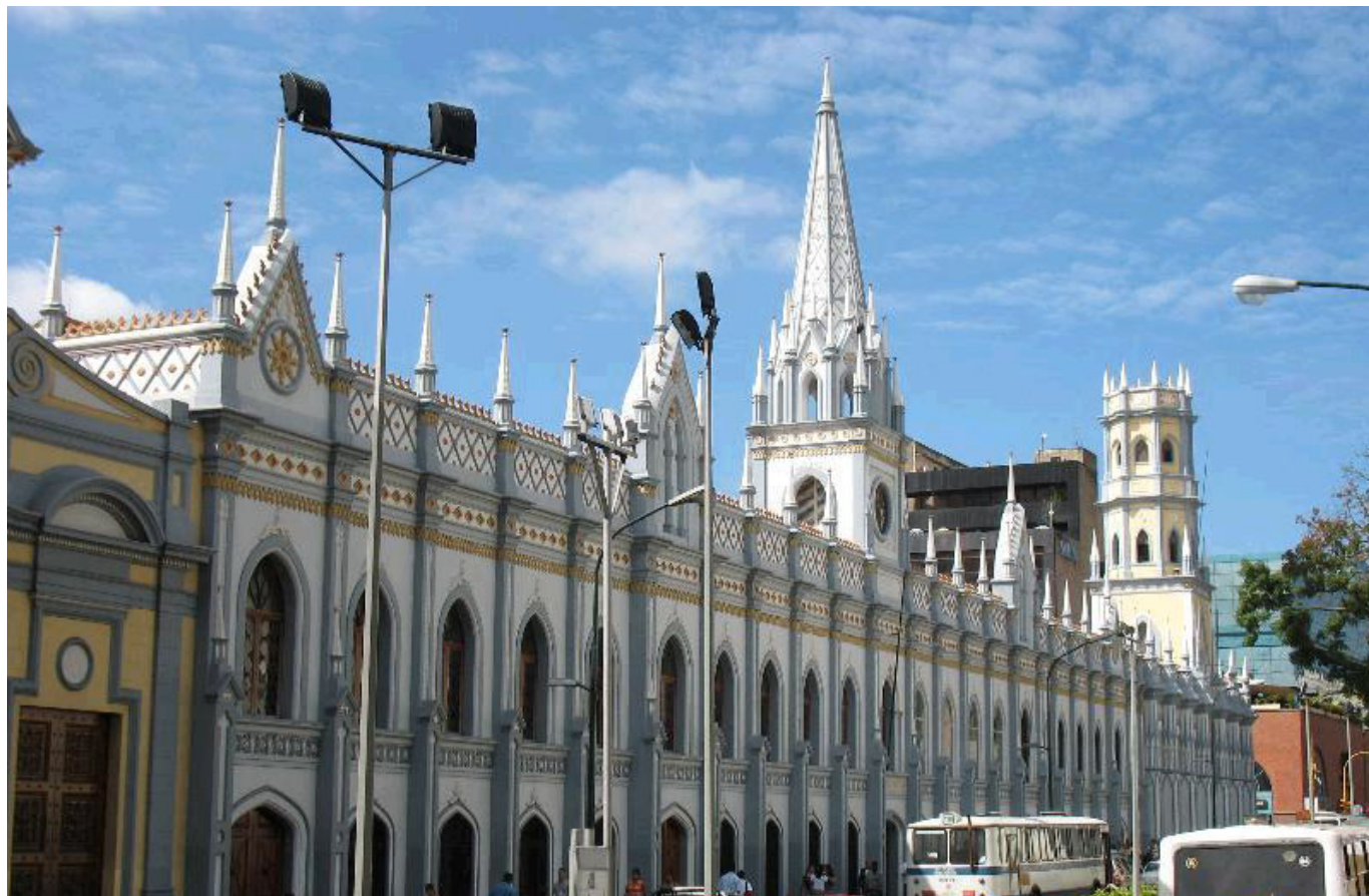
Biblioteca Nacional, Caracas