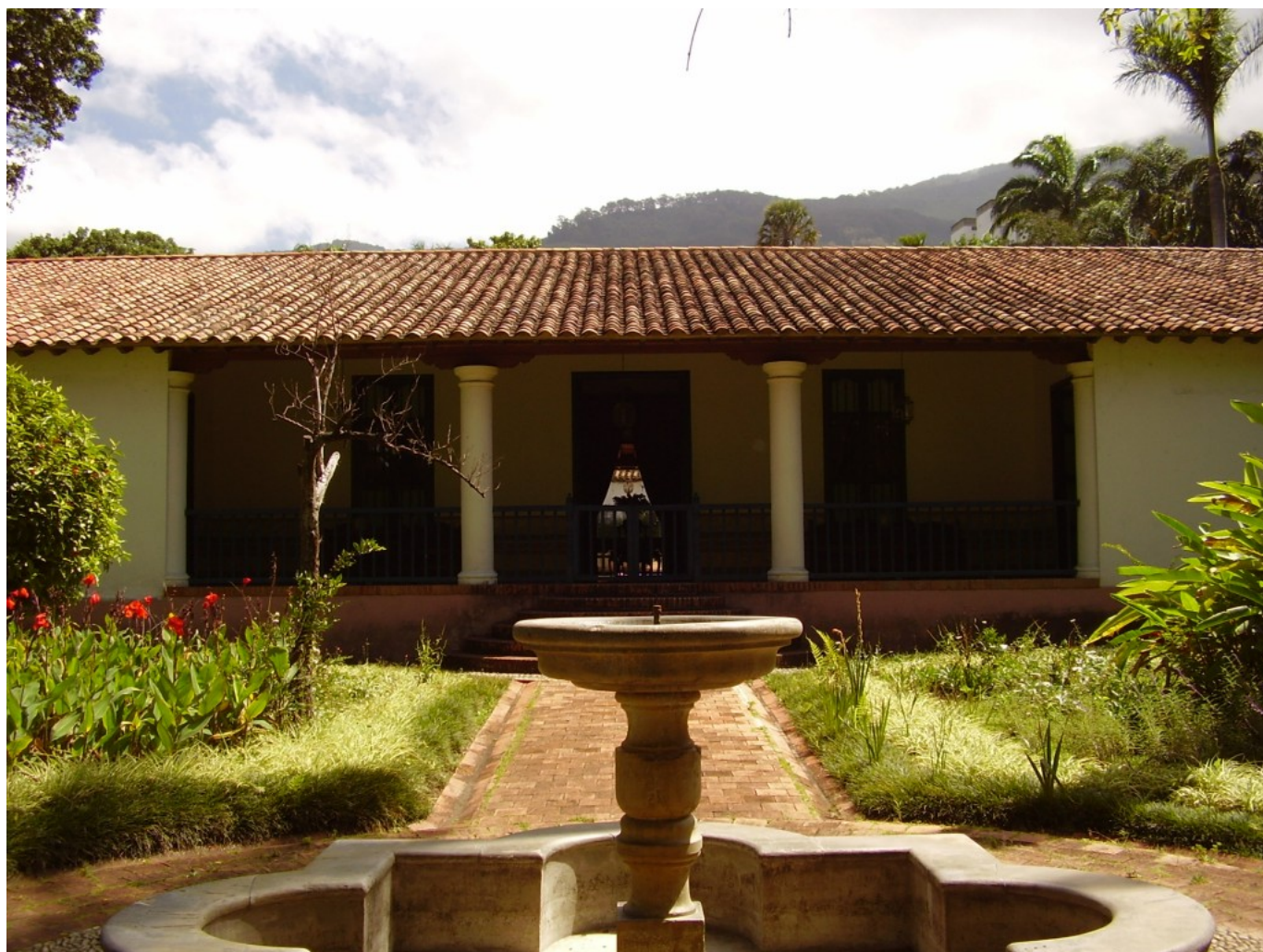
Quinta Anauco, Caracas