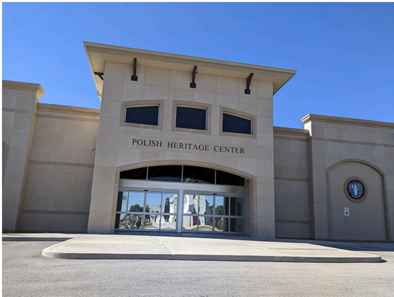
Polish Heritage Center w Pannie Marii w Teksasie, na przeciwko kościoła, fot. Joanna Sokołowska-Gwizdka