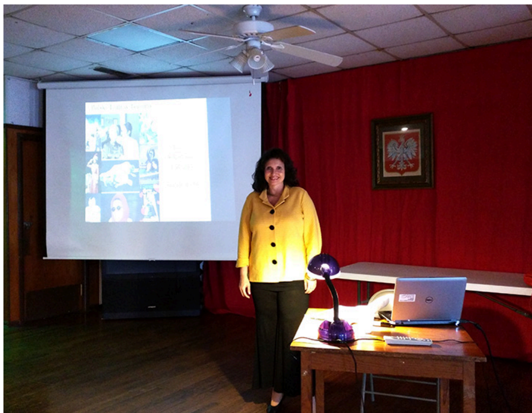
Prelekcja na temat polskiego teatru w Toronto, 6 marca 2016 r. w Polish-American Center w San Antonio