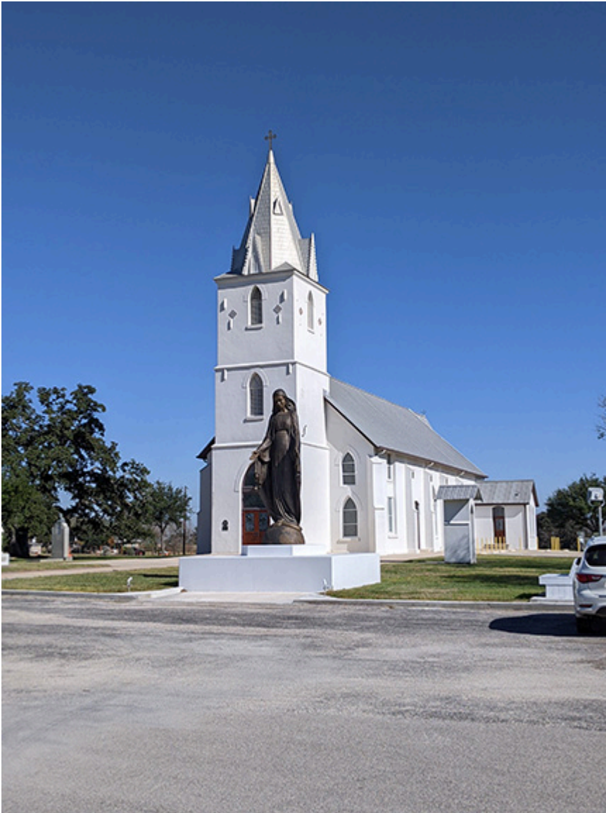
Najstarsza polska parafia w USA, w miejscowości Panna Maria koło San Antonio w Teksasie

[Redacted text block consisting of multiple horizontal black bars]