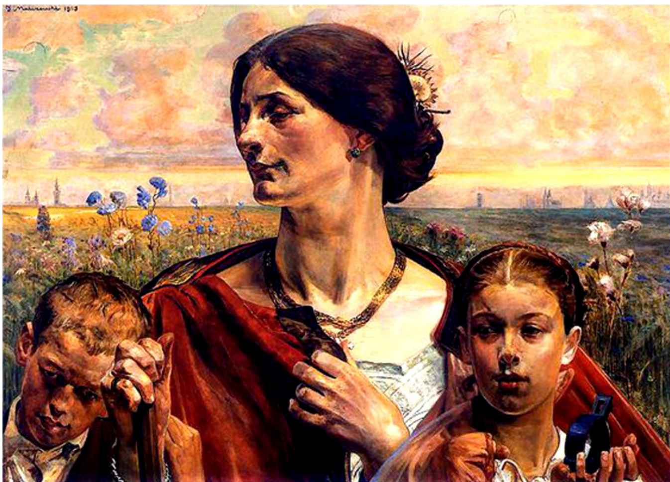
Jacek Malczewski, Ojczyzna, Tryptyk (Prawo, Ojczyzna, Sztuka), 1903 r., olej, deska, 69,5 × 98 cm, Muzeum Narodowe we Wrocławiu.