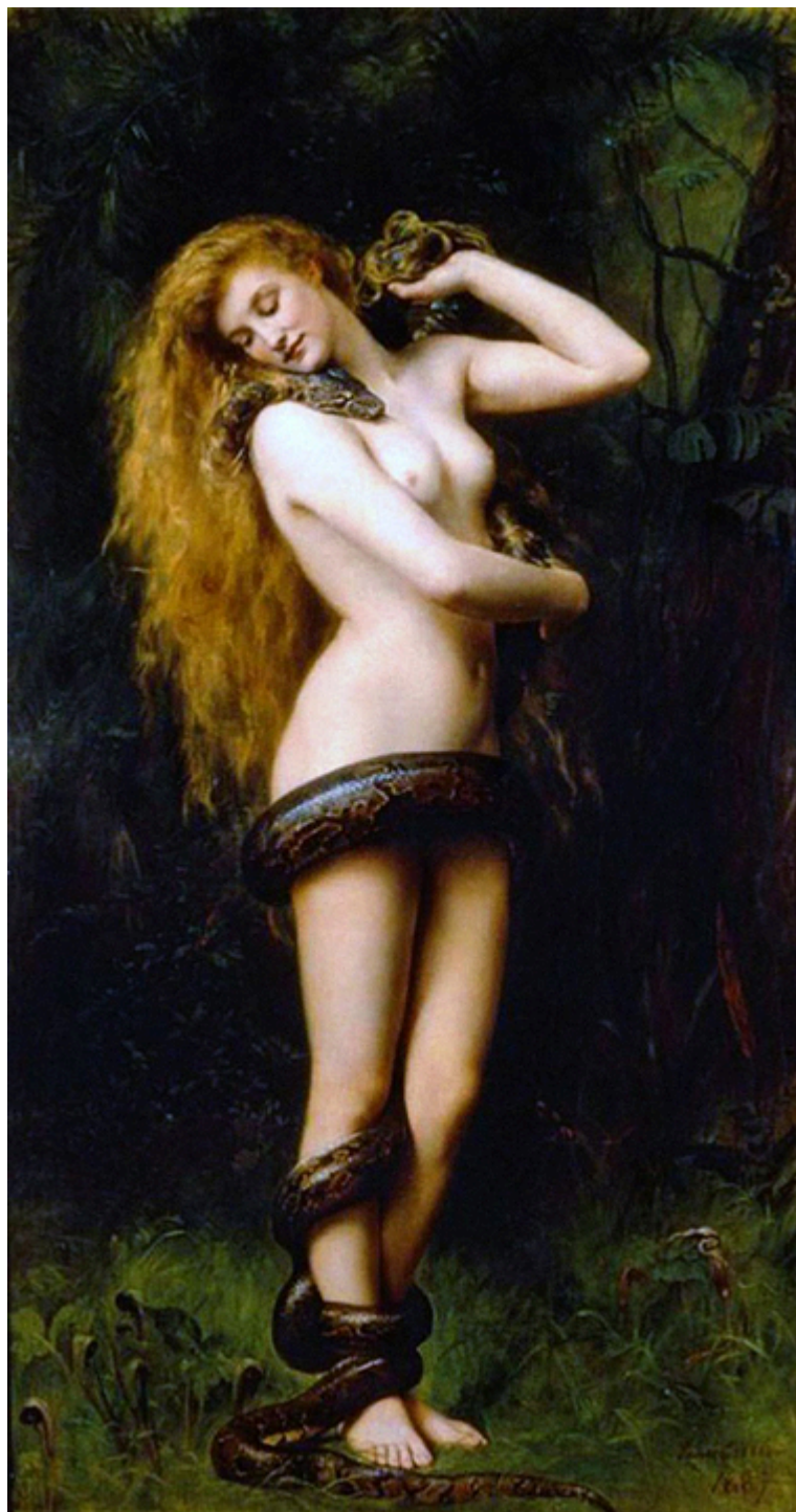
John Collier, „Lilith”, 1892, The Atkinson Gallery, Anglia.