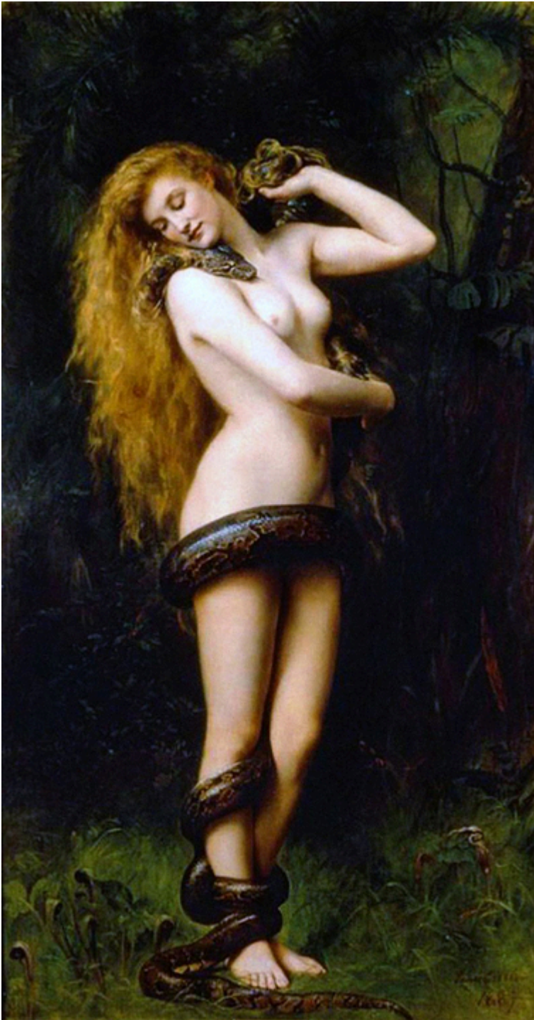
John Collier, „Lilith”, 1892, The Atkinson Gallery, Anglia.