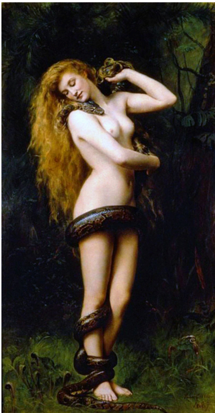
John Collier, „Lilith”, 1892, The Atkinson Gallery, Anglia.

wiem to. A jednak syn zdradza ojca, bo sam został niegdyś przez ojca zdradzony... I nie zostaje nikim wielkim.