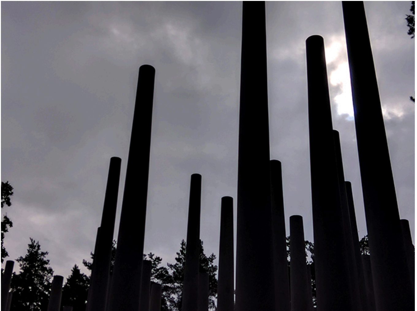
Pomnik ku czci pomordowanych w Lesie Szpęgawskim - betonowy las, a wśród drzew ścięte pnie z nazwiskami.