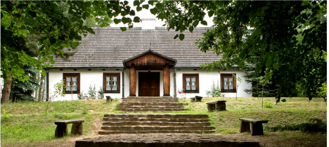
Muzeum Wsi Radomskiej. Dwór z Pieczysk, fot. Z. Wojski.