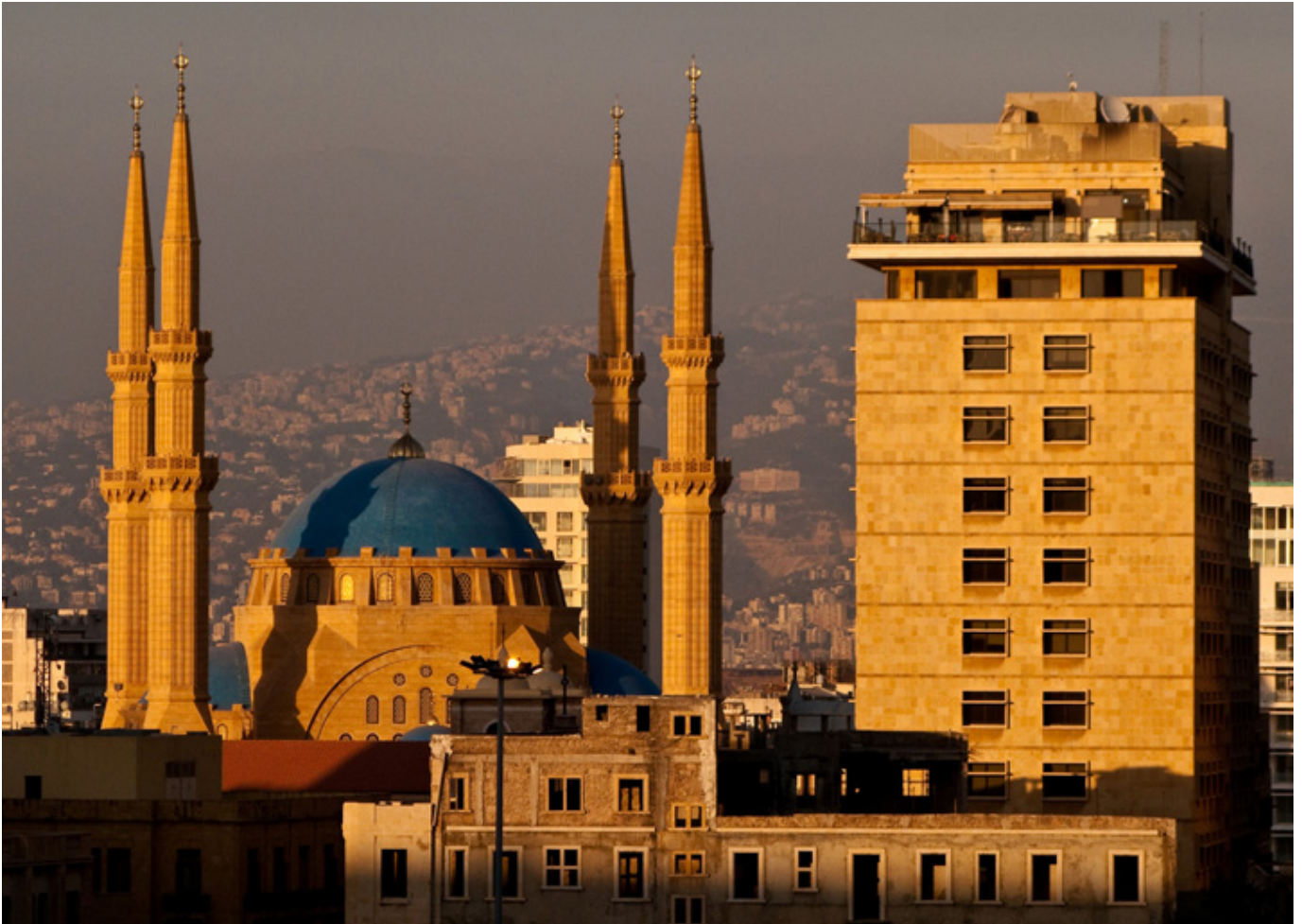
Beirut. Meczet Mohammada al-Amina, fot. flickr.