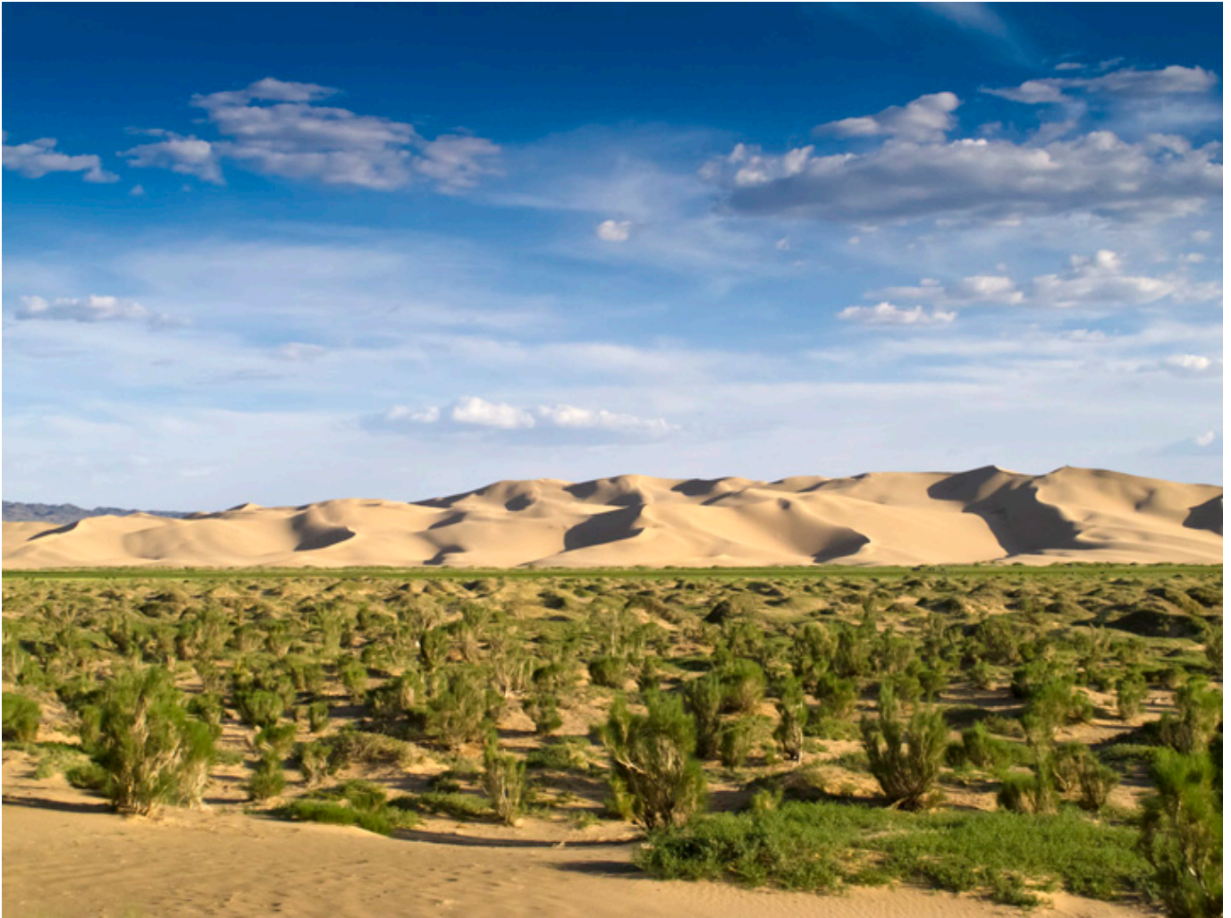
Las saksaulowy, fot. flickr.