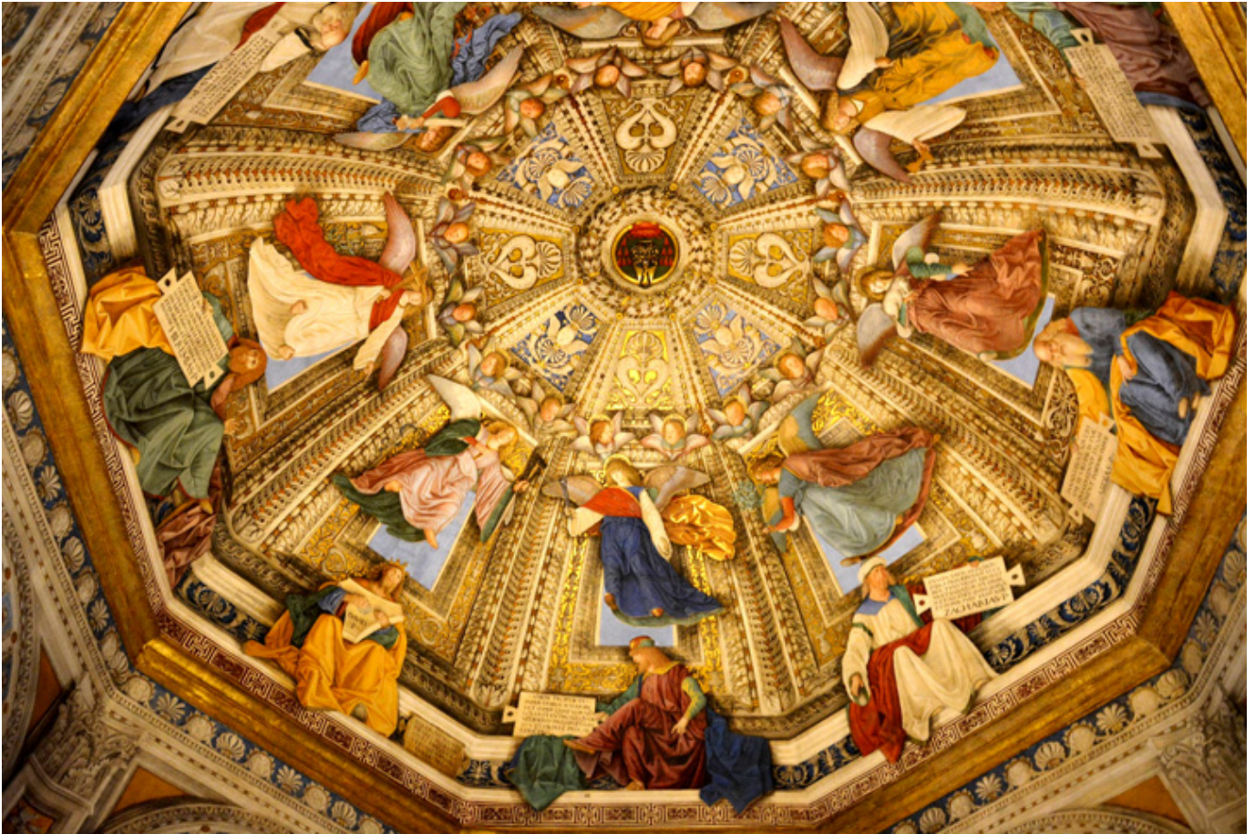
Loreto. Zakrystia św. Marka w Bazylice, fot. flickr.