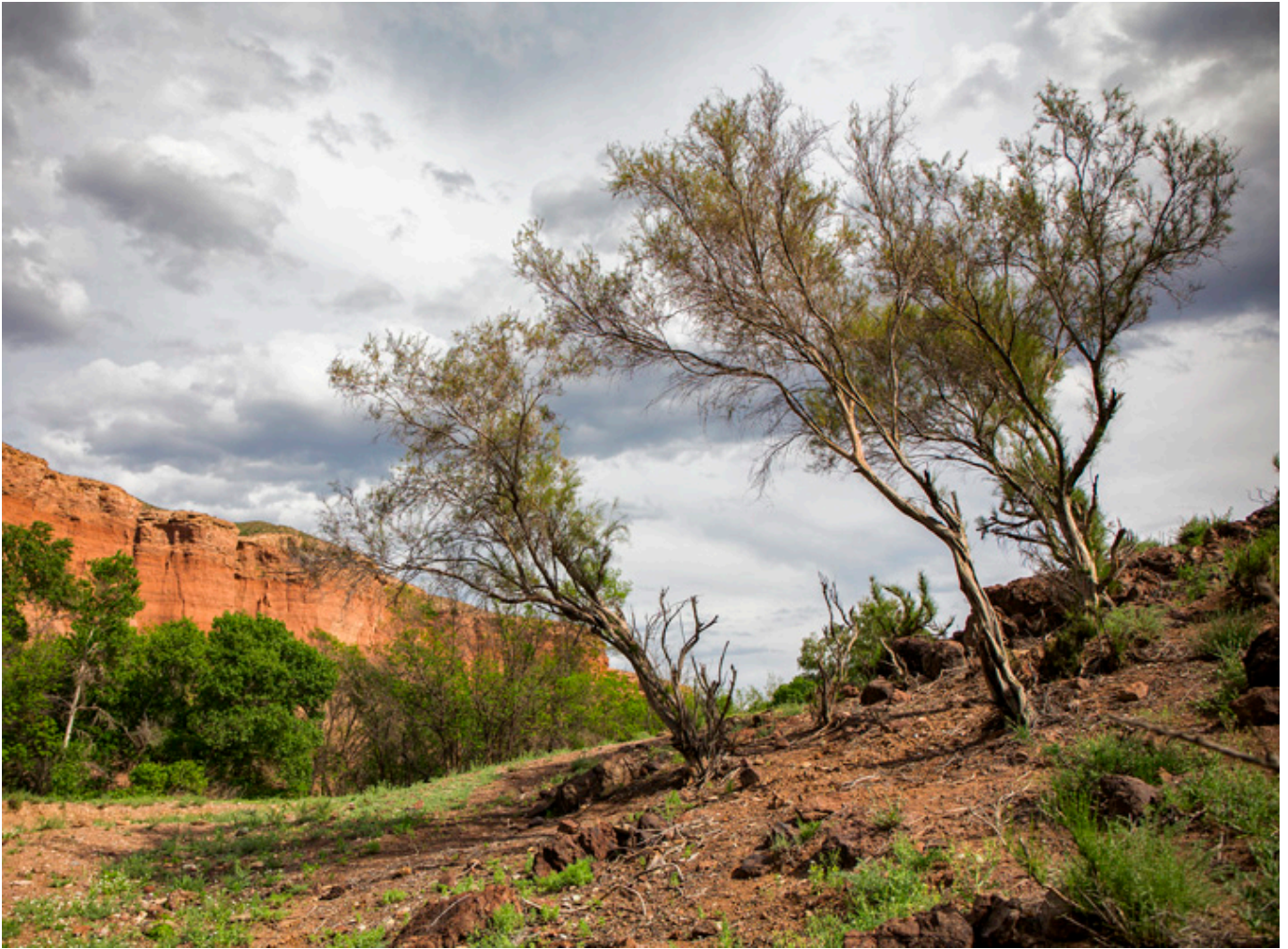
Saksaul (Haloxylon), fot. flickr.