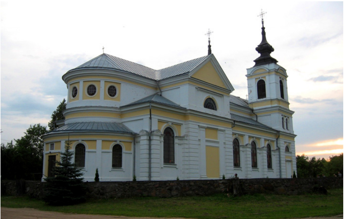
Bieniakonie. Kościół św. Jana Chrzciciela, fot. Flickr.