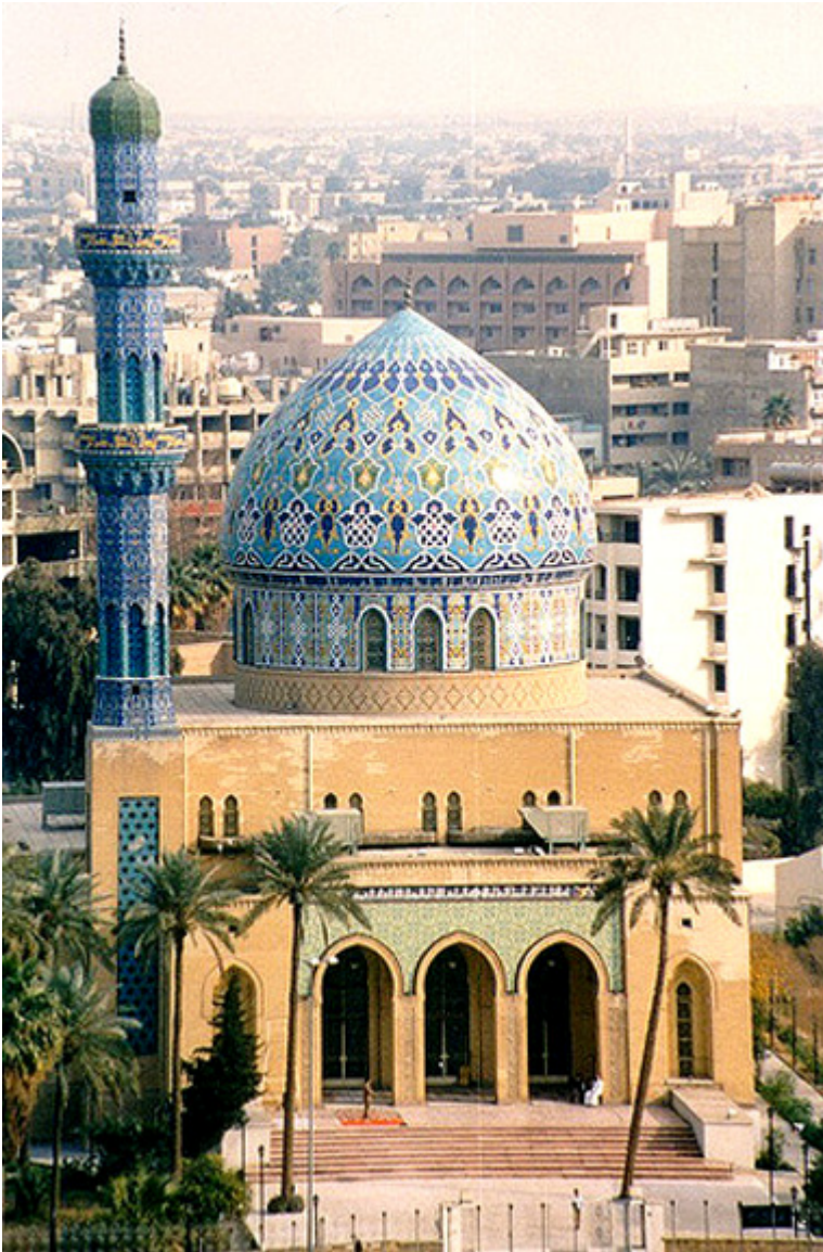
Meczet w Bagdadzie.