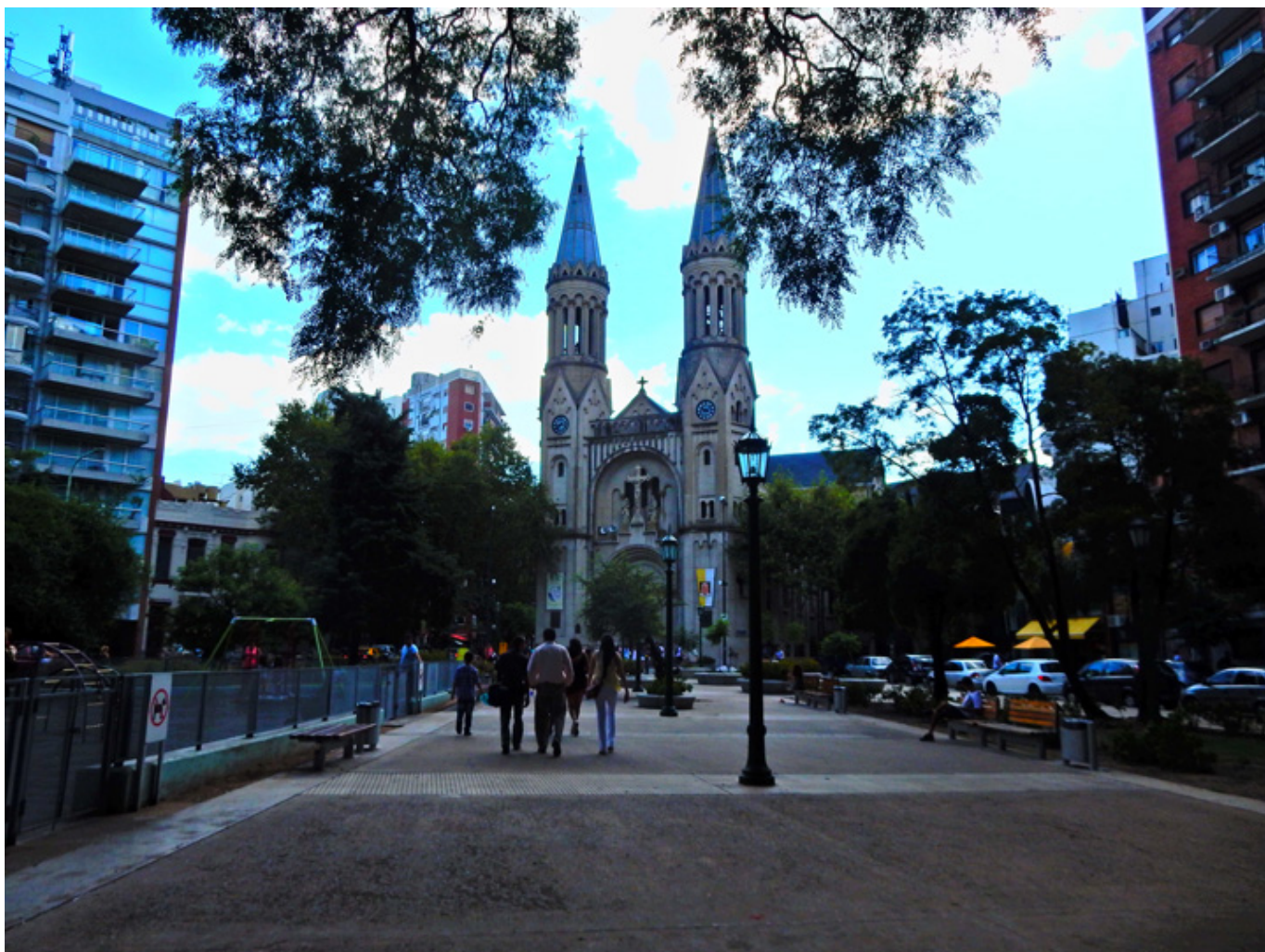
Polski kościół Matki Boskiej z Guadalupe w Buenos Aires przy ulicy Mansilla, fot. flickr.