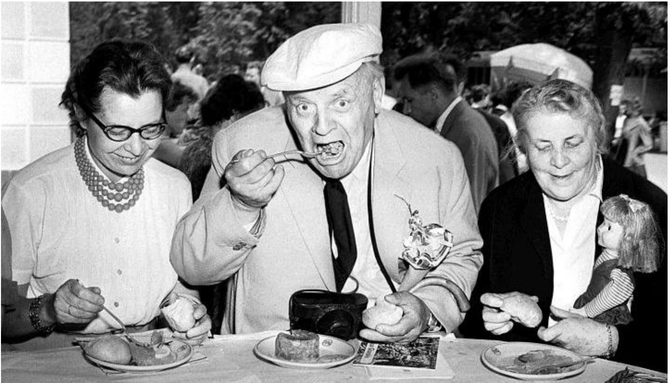
Melchior Wańkowicz z żoną i córką, 1960 r.