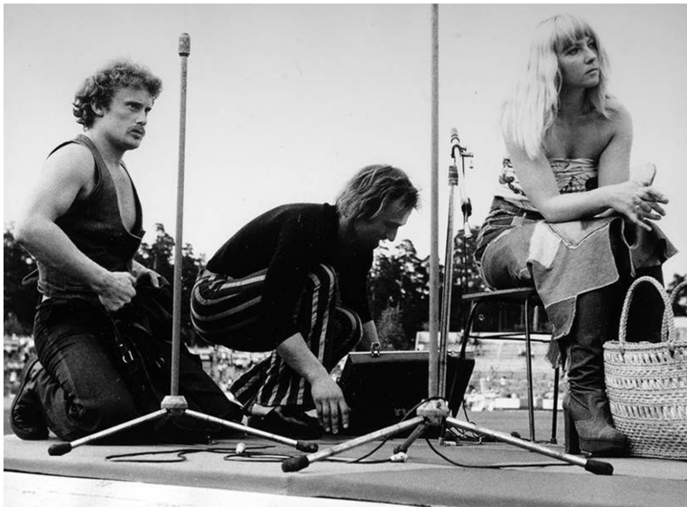
„Maryla. Tak kochałam”, reż. Michał Bandurski i Krystian Kuczkowski