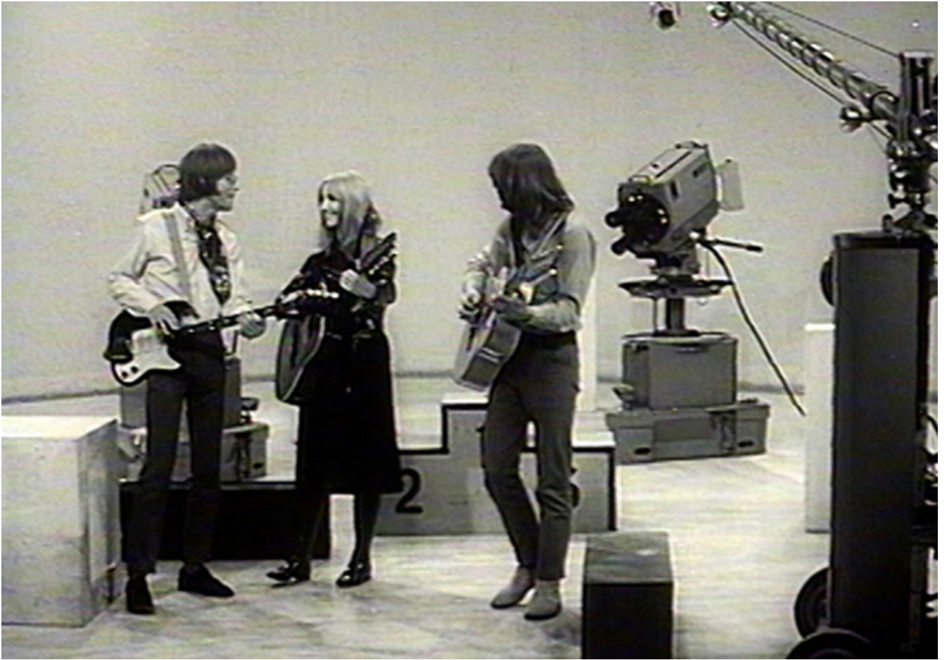
„Maryla. Tak kochałam”, reż. Michał Bandurski i Krystian Kuczkowski