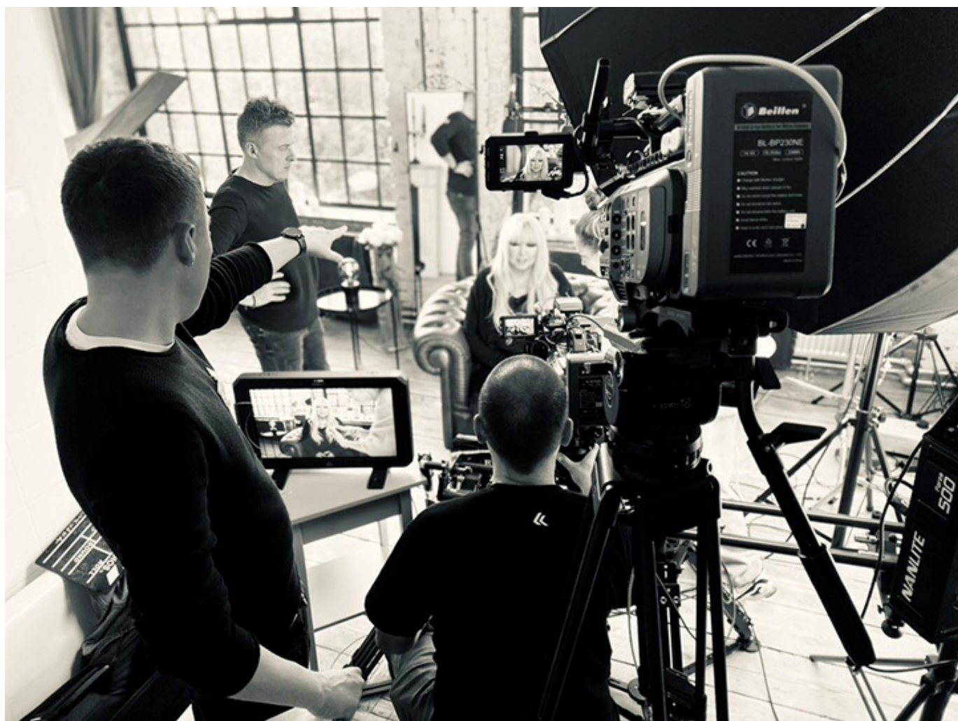
„Maryla. Tak kochałam”, reż. Michał Bandurski i Krystian Kuczkowski