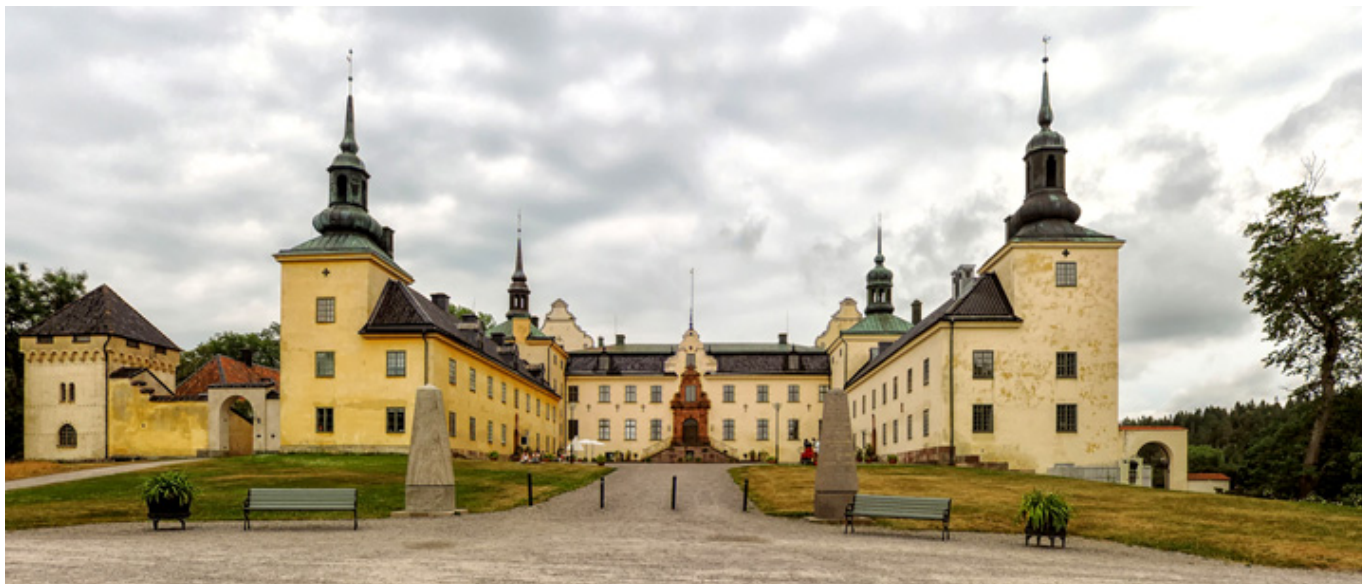
Palac Tyresö