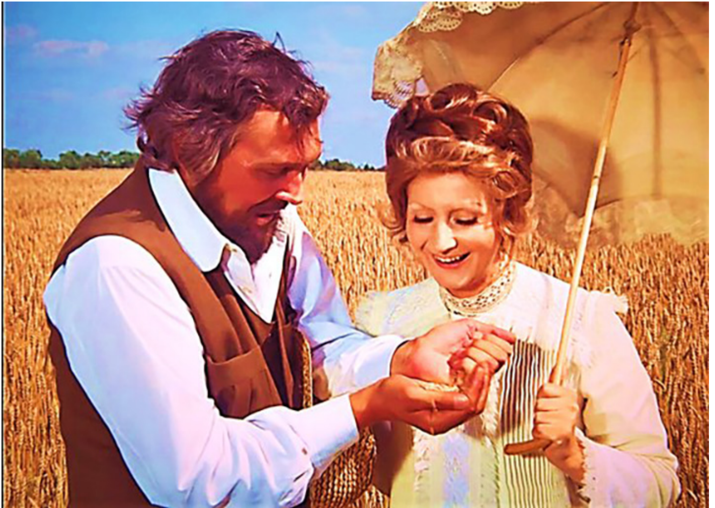
Jerzy Bińczycki jako Bogumił Niechcic i Jadwiga Barańska jako Barbara Niechcic w filmie „Noce i dnie”