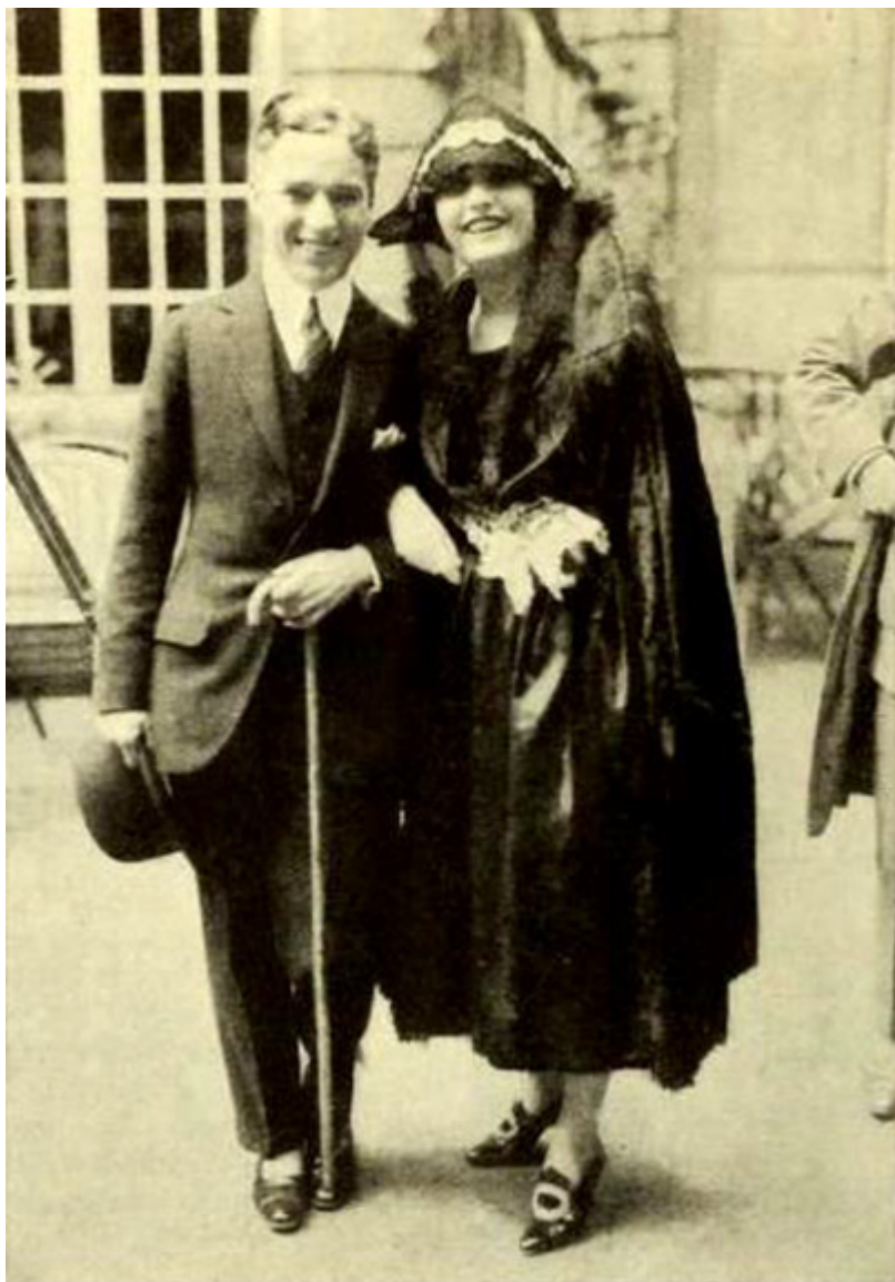
Pola Negri i Charlie Chaplin, Berlin, 1922 r., fot. wikimedia commons