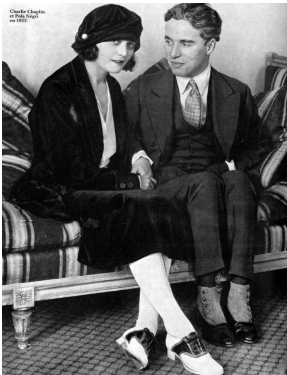
Pola Negri i Charlie Chaplin 1922 r.

czasach. W historię Hollywood Pola wpisała się filmem „Zakazany Raj” – ukazującym losy Katarzyny Wielkiej. To uderzyło w strunę amerykańskich sufrażystek. Krytyka uznała „Zakazany Raj” za czołowy film 1925 roku.