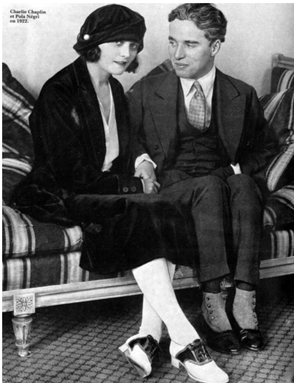
Pola Negri i Charlie Chaplin 1922 r.

czasach. W historię Hollywood Pola wpisała się filmem „Zakazany Raj” – ukazującym losy Katarzyny Wielkiej. To uderzyło w strunę amerykańskich sufrażystek. Krytyka uznała „Zakazany Raj” za czołowy film 1925 roku.