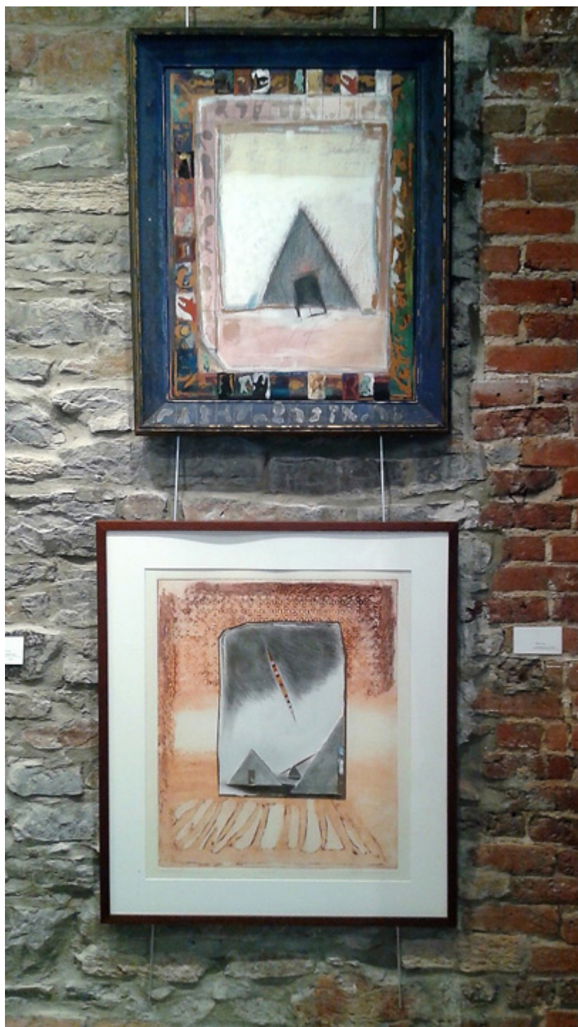
Prace polskich artystów na wystawie w Ottawie.