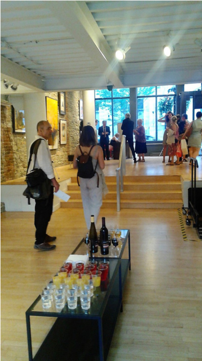
Wystawa prac polskich artystów w Ottawie, fot. arch. autorki,