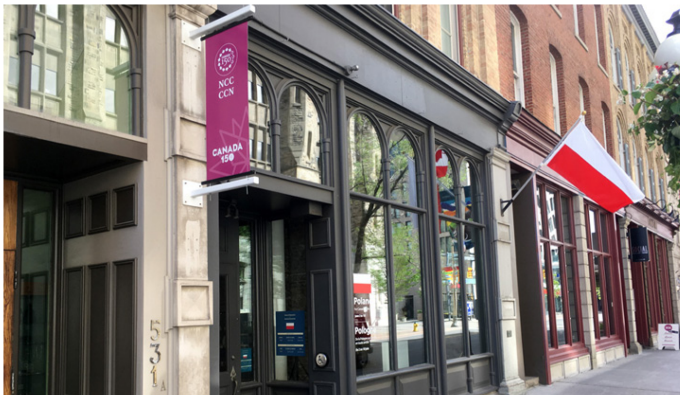
The International Pavilion w Ottawie, gdzie miała miejsce wystawa.