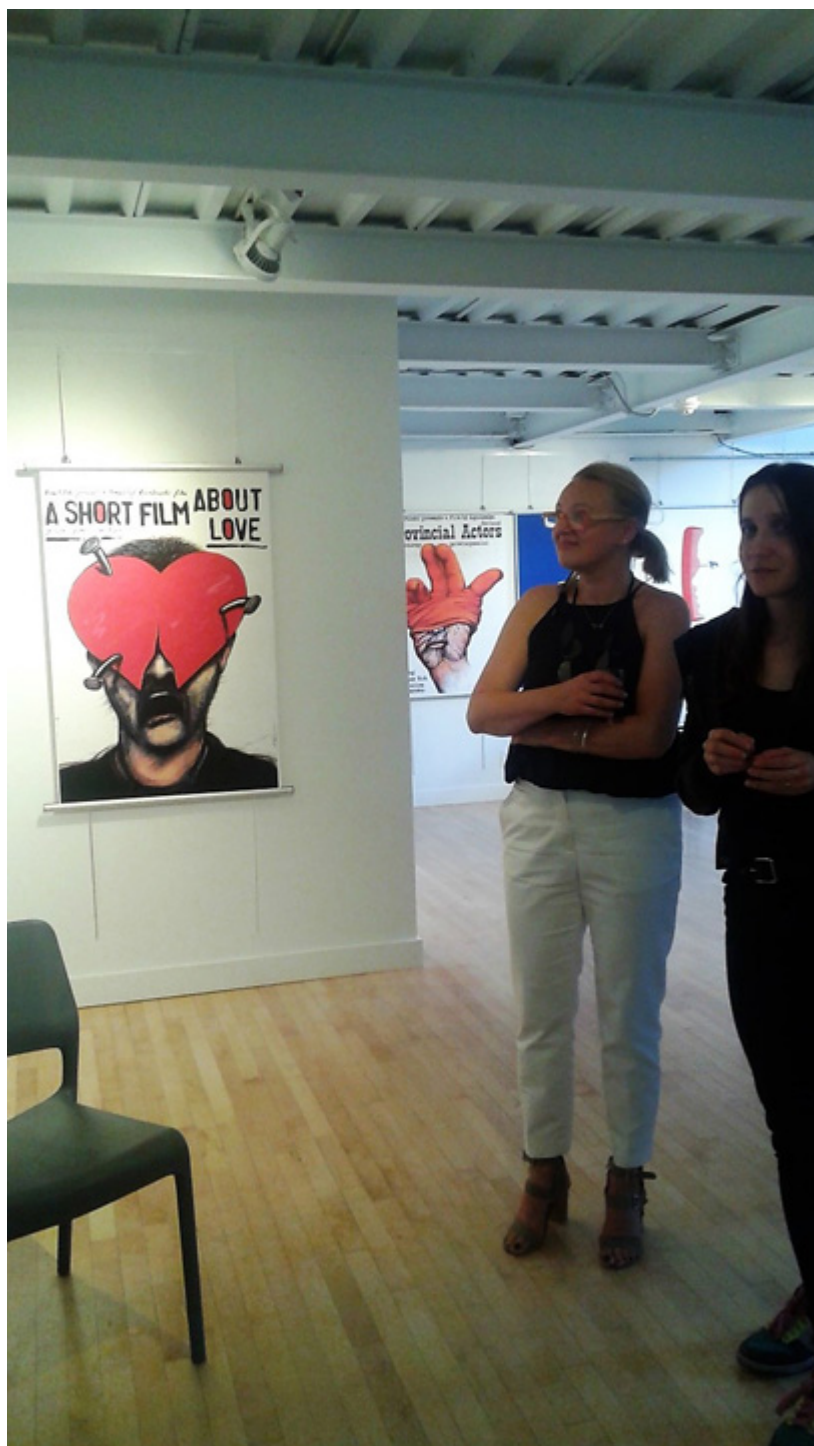
Wystawa prac polskich artystów w Ottawie