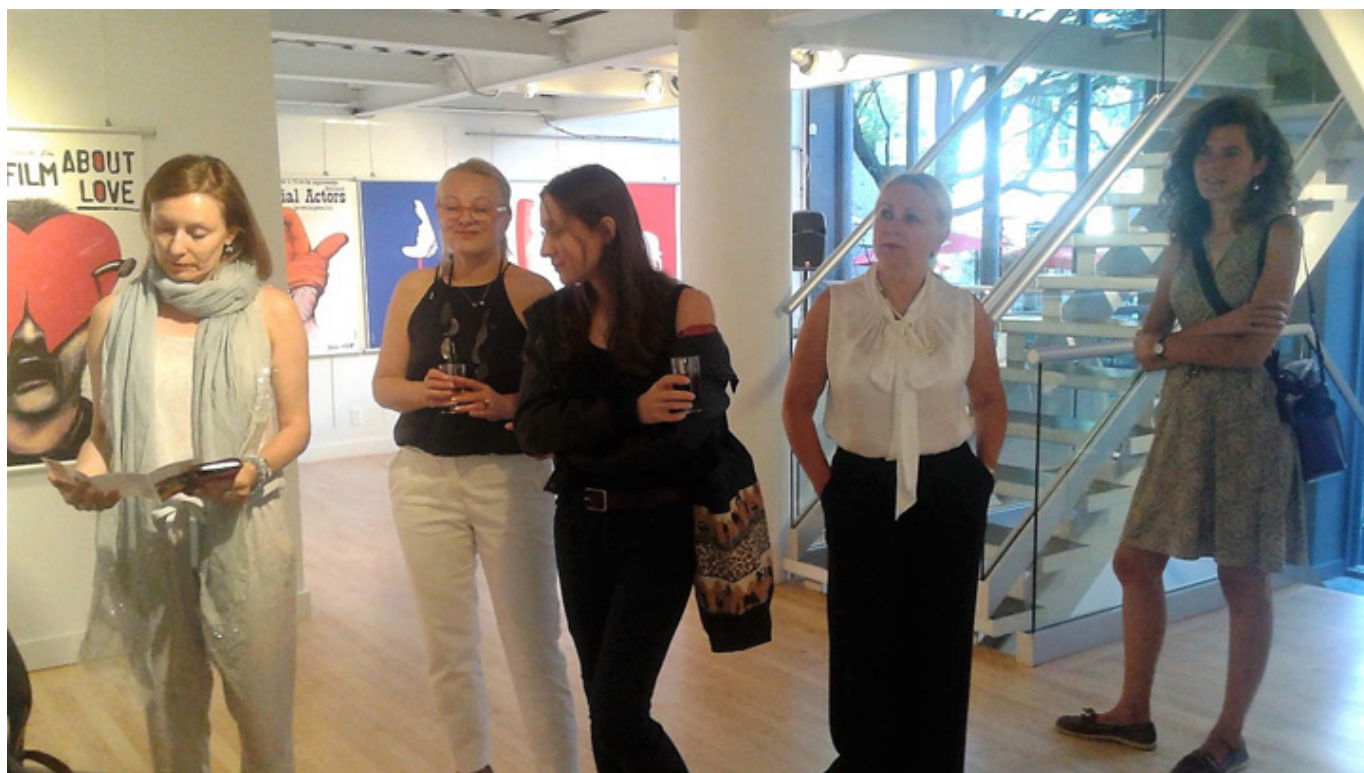
Wystawa prac polskich artystów w Ottawie, fot. arch. autorki,