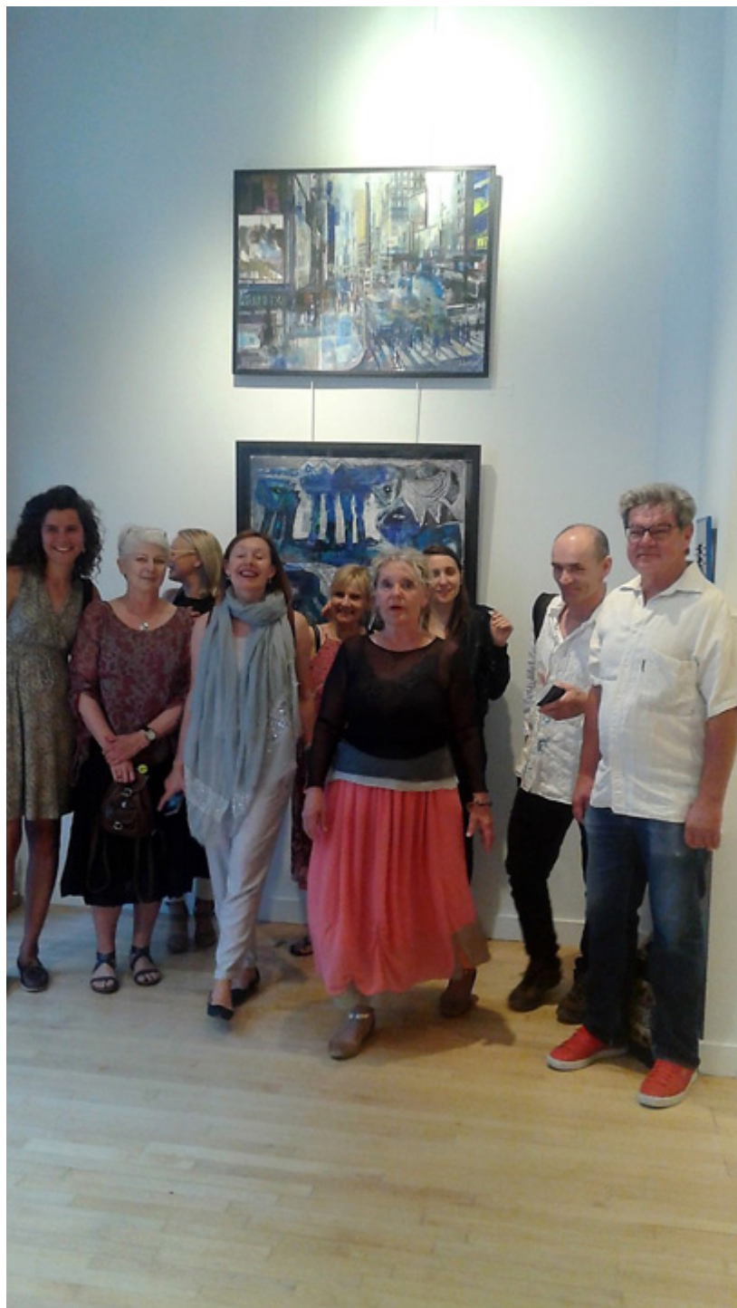
Wystawa prac polskich artystów w Ottawie, fot. arch. autorki,