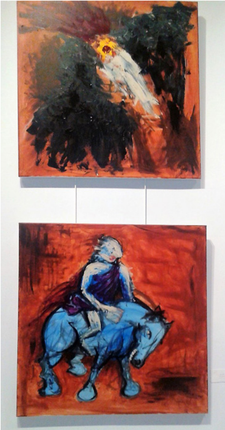
Prace polskich artystów na wystawie w Ottawie, fot. arch. autorki.