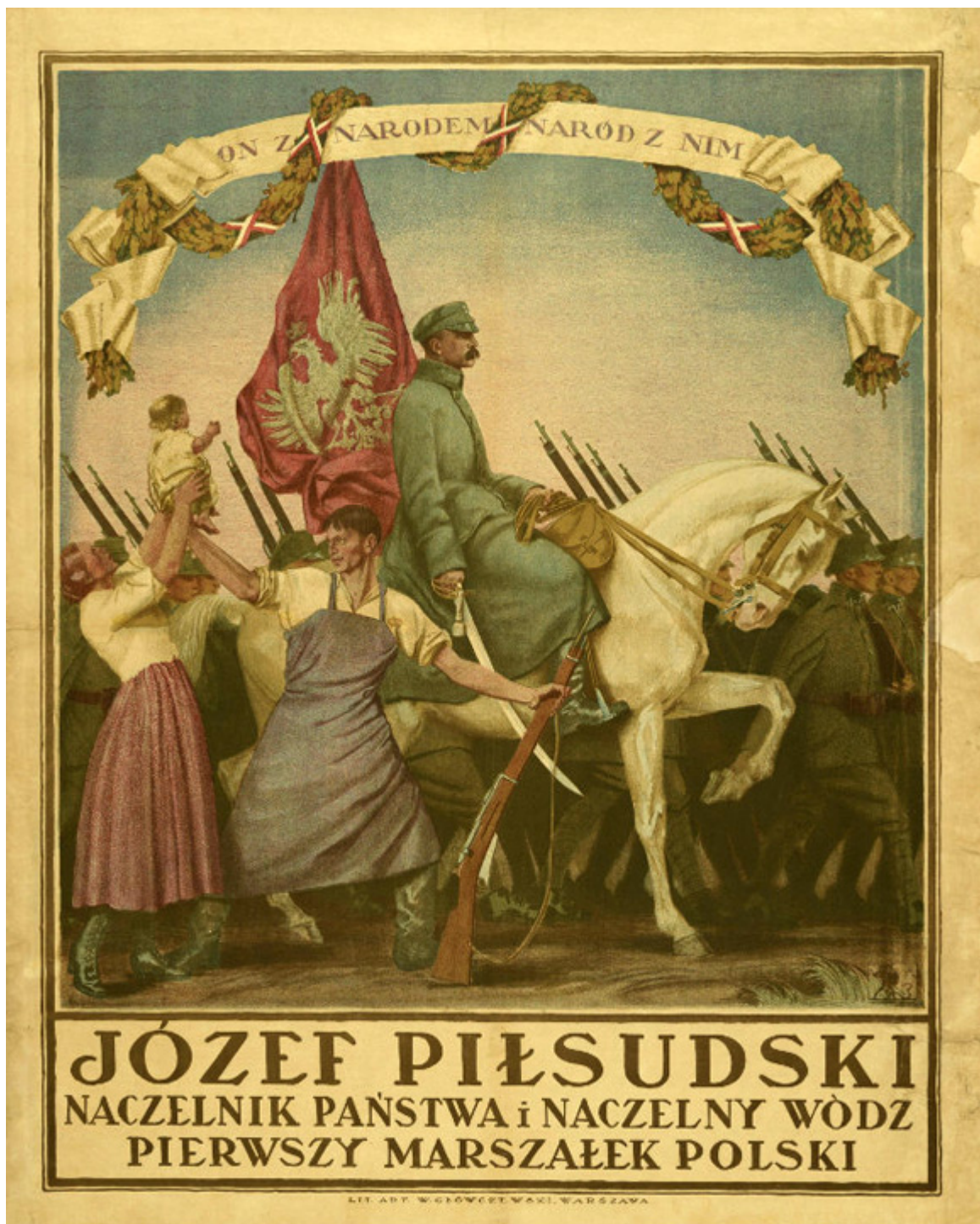
Anonim, lata 1930-te.