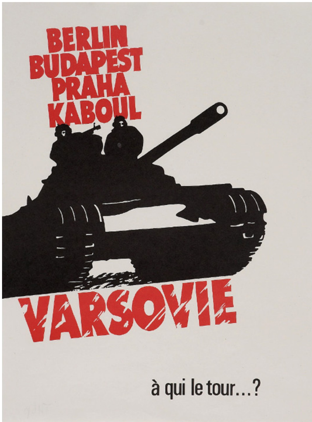
Anonim, 1981 r.