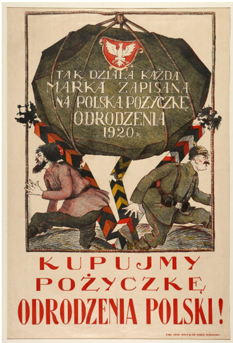
Anonim, 1920 r.