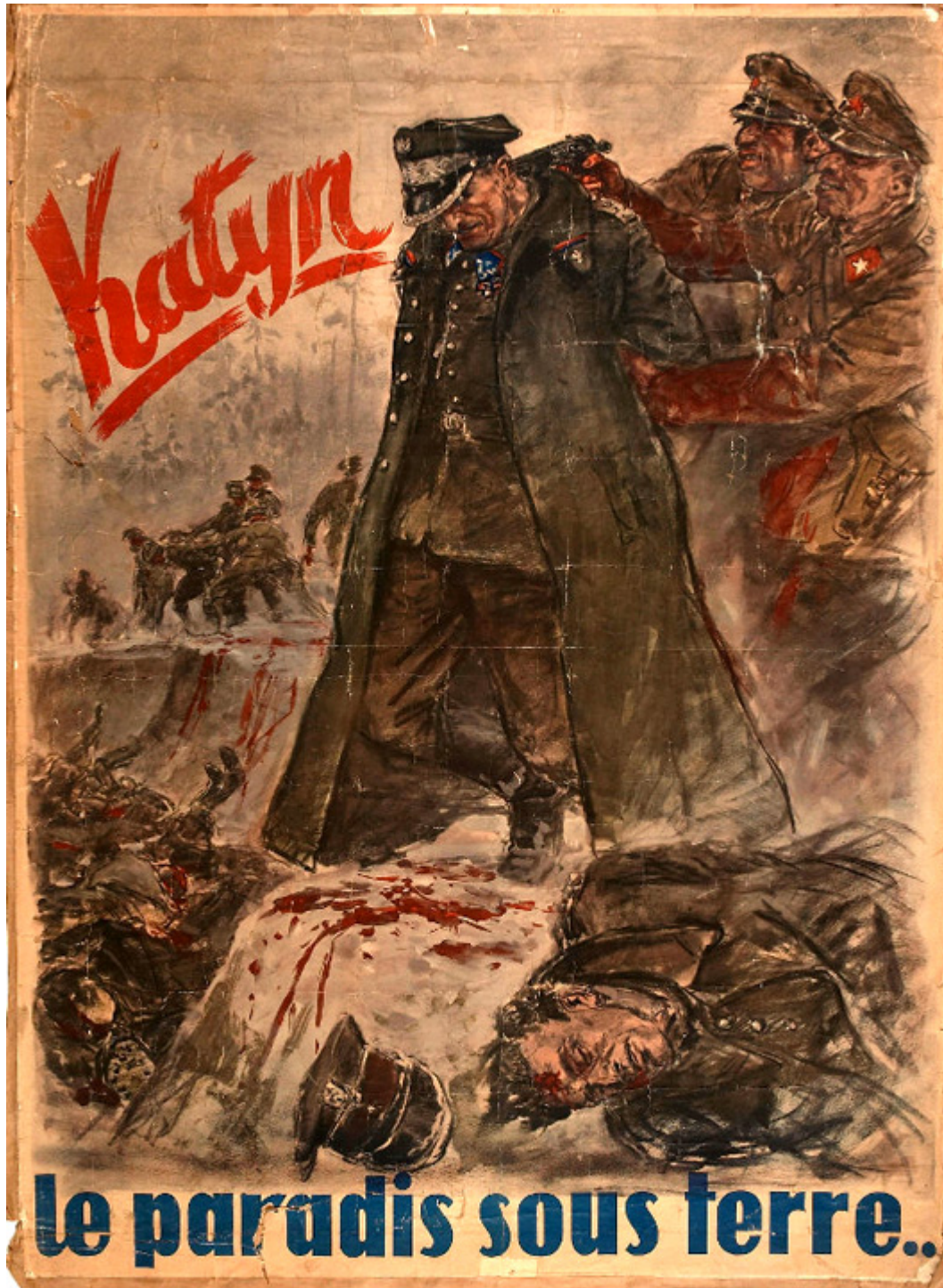
Anonim, 1943 r.