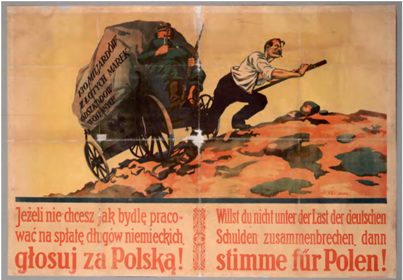
Anonim, 1921 r.