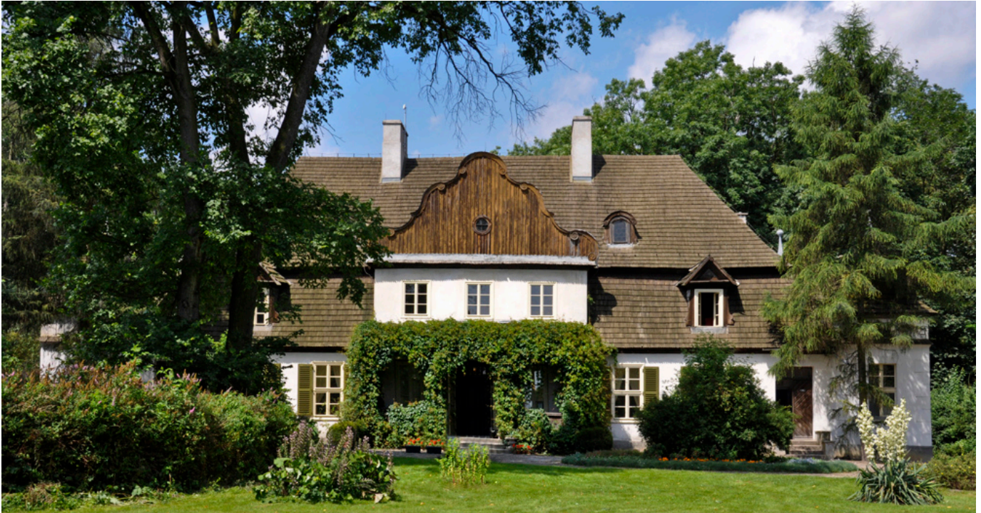
Dwór w Koszutach.

dwory kupione po 1990 roku i odremontowane na prywatne mieszkania. W około 30 dworach są muzea biograficzne (np. Sienkiewicza w Oblęgorku koło Kielc, Kraszewskiego w Romanowie (lubelskie), Konopnickiej w Żarnowcu (podkarpackie), Wybickiego w Będminie (pomorskie) lub lokalne muzea, w tym pokazujące wnętrza dworskie, np. w Ożarowie k. Wielunia, w Koszutach (wielkopolskie) lub Tubądzinie. Około 30 obiektów dworskich to pensjonaty, hotele i ośrodki konferencyjne, należące do firm lub osób prywatnych.