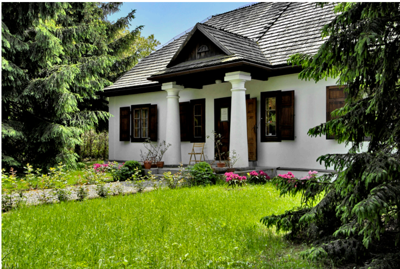
Dworek Wincentego Pola w Lublinie.

najwięcej się jeszcze ostało (dziewiętnastowiecznych około 500).