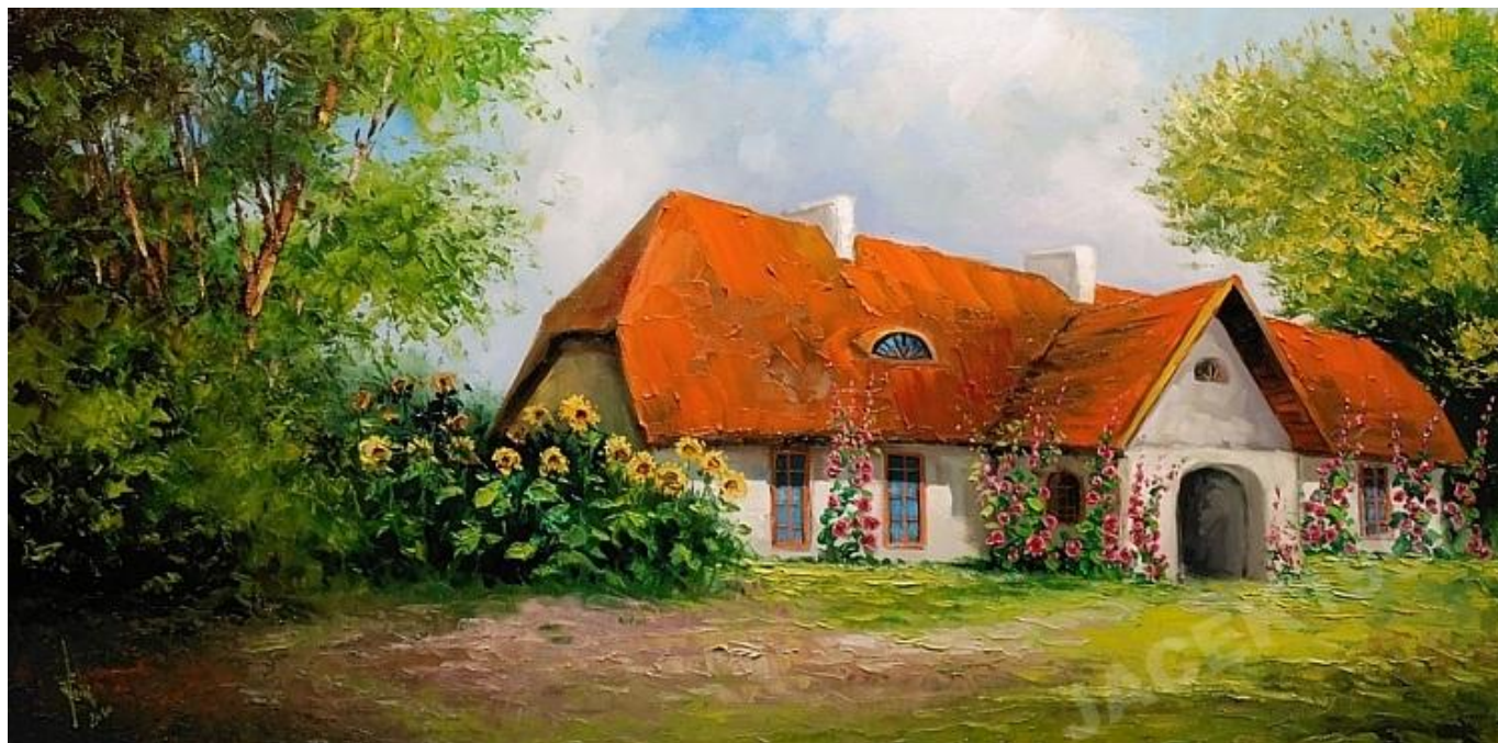
Dworej w malwach, olej na płótnie, Jacek Łącki.

Wymienione wyżej rezydencje oferują usługi na stosunkowo wysokim poziomie, ale niestety należą do mniejszości. Zdecydowana większość spośród wspomnianych 150 pałaców i zamków, przeznaczonych na cele hotelowo-konferencyjne, mimo ładnego obiektu i pięknego położenia świadczy jeszcze niski poziom usług i zdecydowanie wymaga doinwestowania.