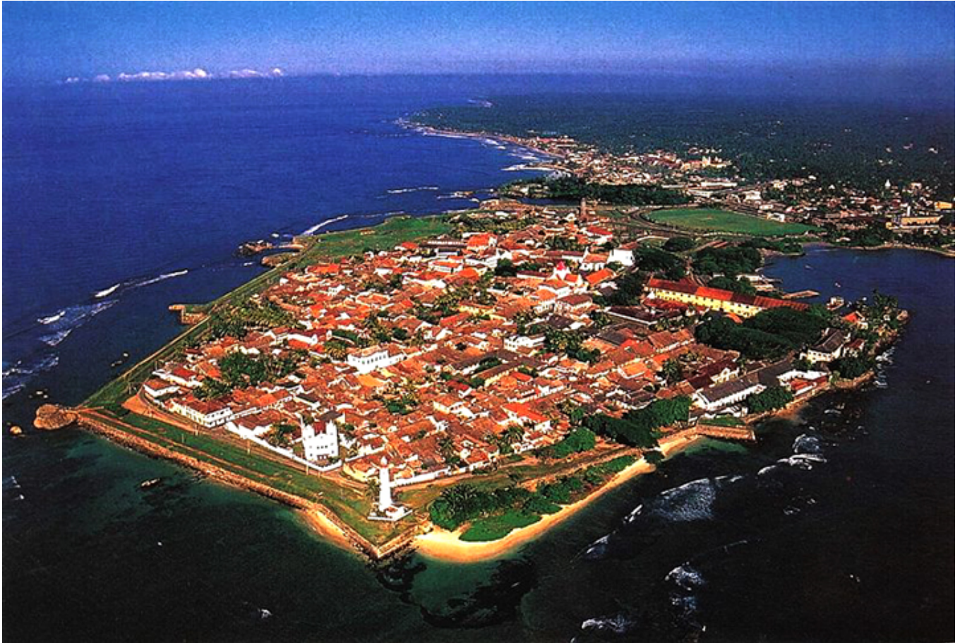
Galle. Widok ogólny.