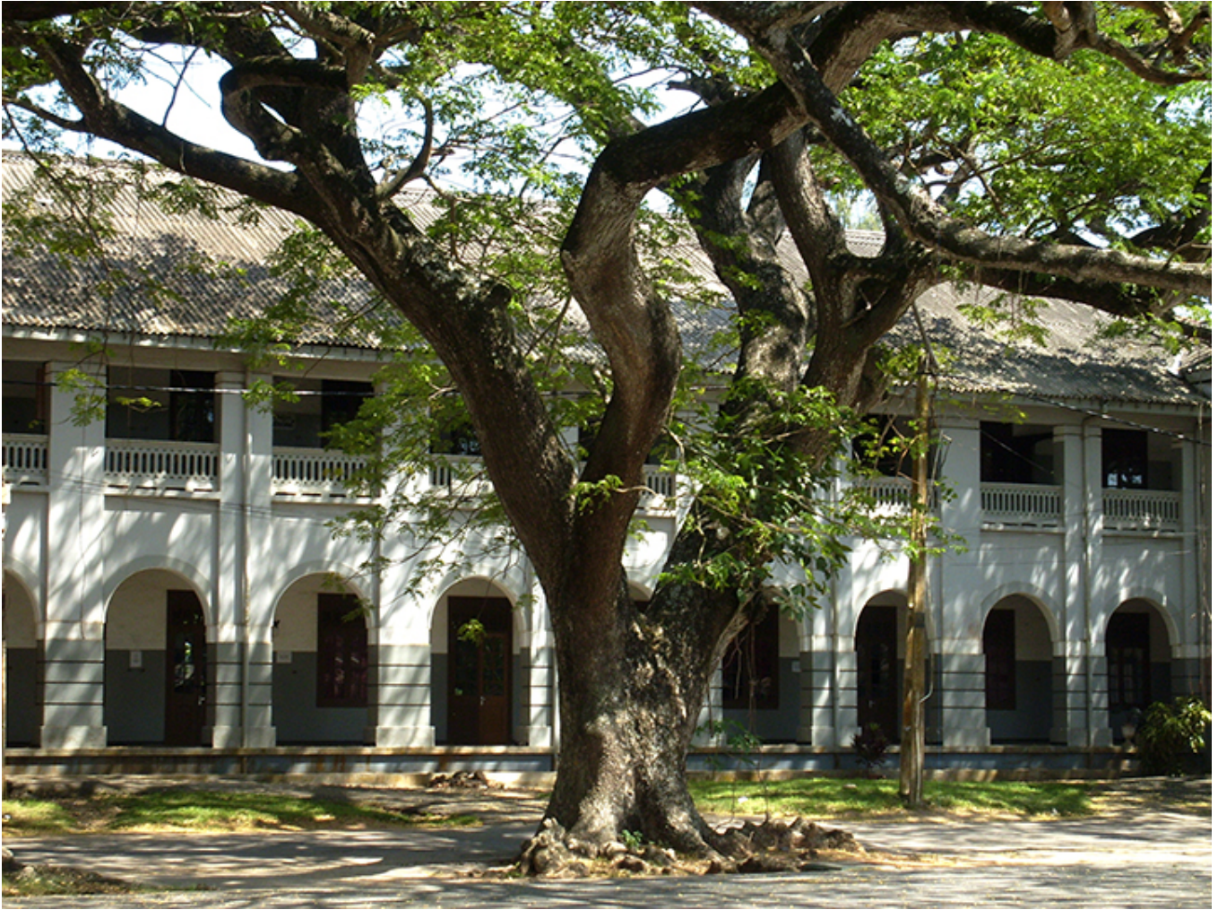
Galle. Główny plac w miasteczku.