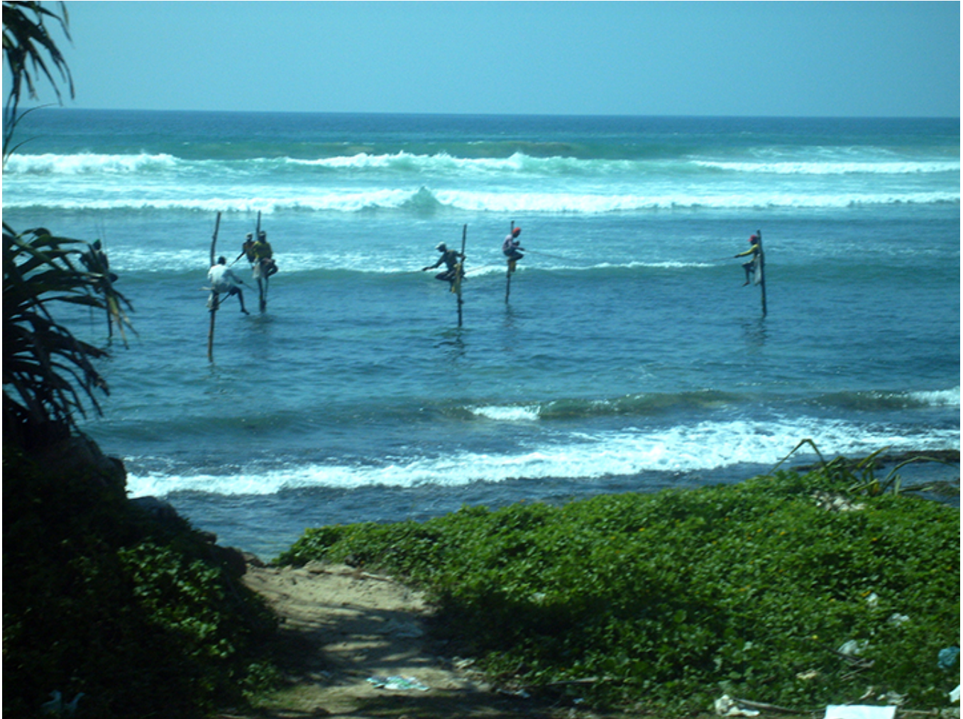
Rybacy na szczudłach tuż przed miastem Galle.