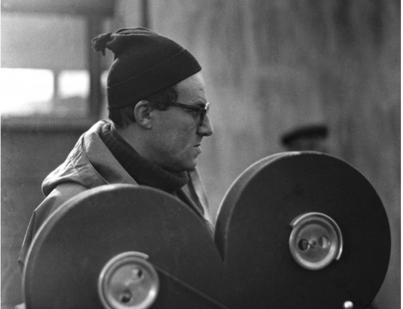
Andrzej Munk, fot. Studio Filmowe KADR.

symbole. Rzucił na szalę życie i piękno idei. Mimo niewielkiego dorobku filmowego, przerwane tragicznym wypadkiem, krytycy filmowi zaliczają go do grona wybitnych reżyserów swojej epoki, współtworzącego powojenne europejskie kino.