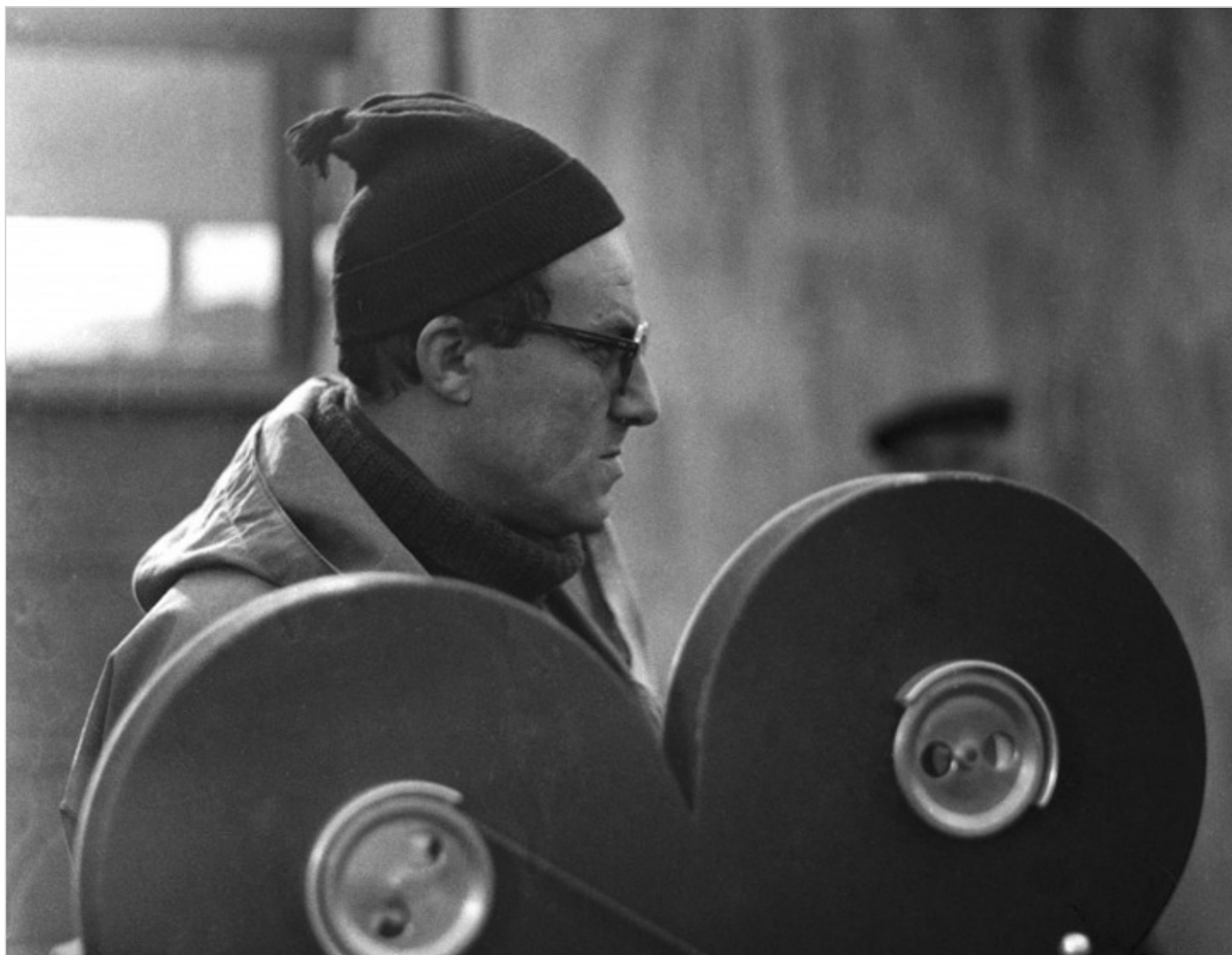
Andrzej Munk, fot. Studio Filmowe KADR.

reżyserów swojej epoki, współtworzącego powojenne europejskie kino.