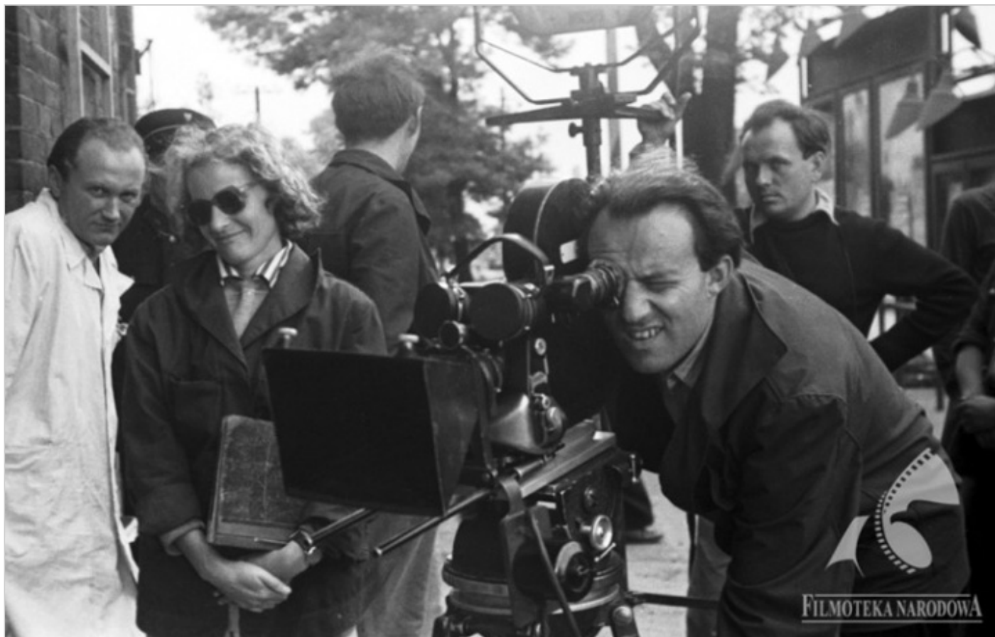
Andrzej Munk