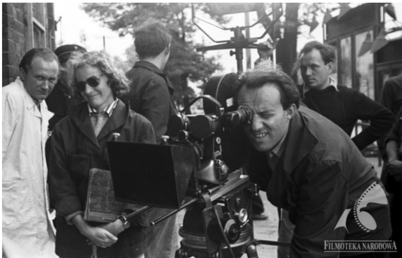
Andrzej Munk