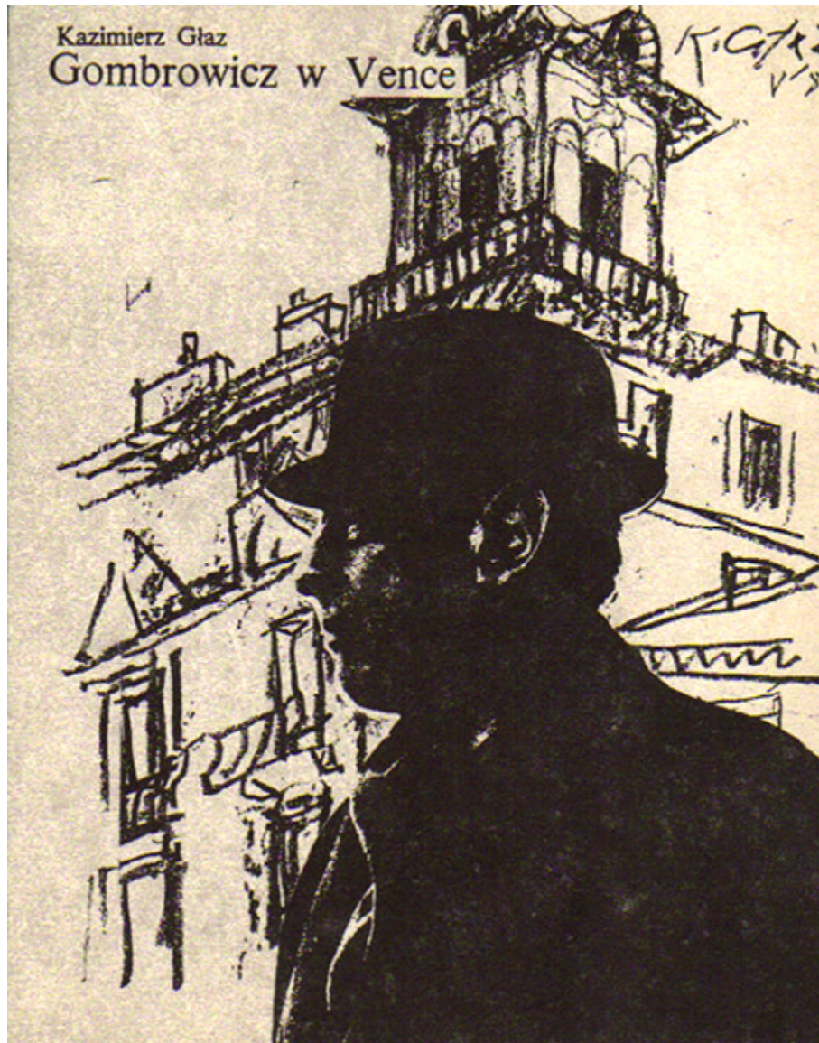
Okładka książki Kazimierza Głaza „Gombrowicz w Vence”, 1985 r.