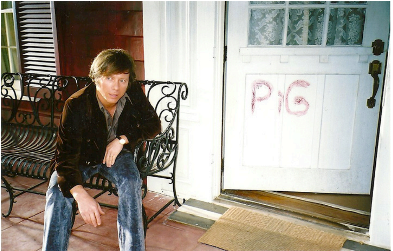
Marek Probosz jako Roman Polański w filmie "Helter Skelter"