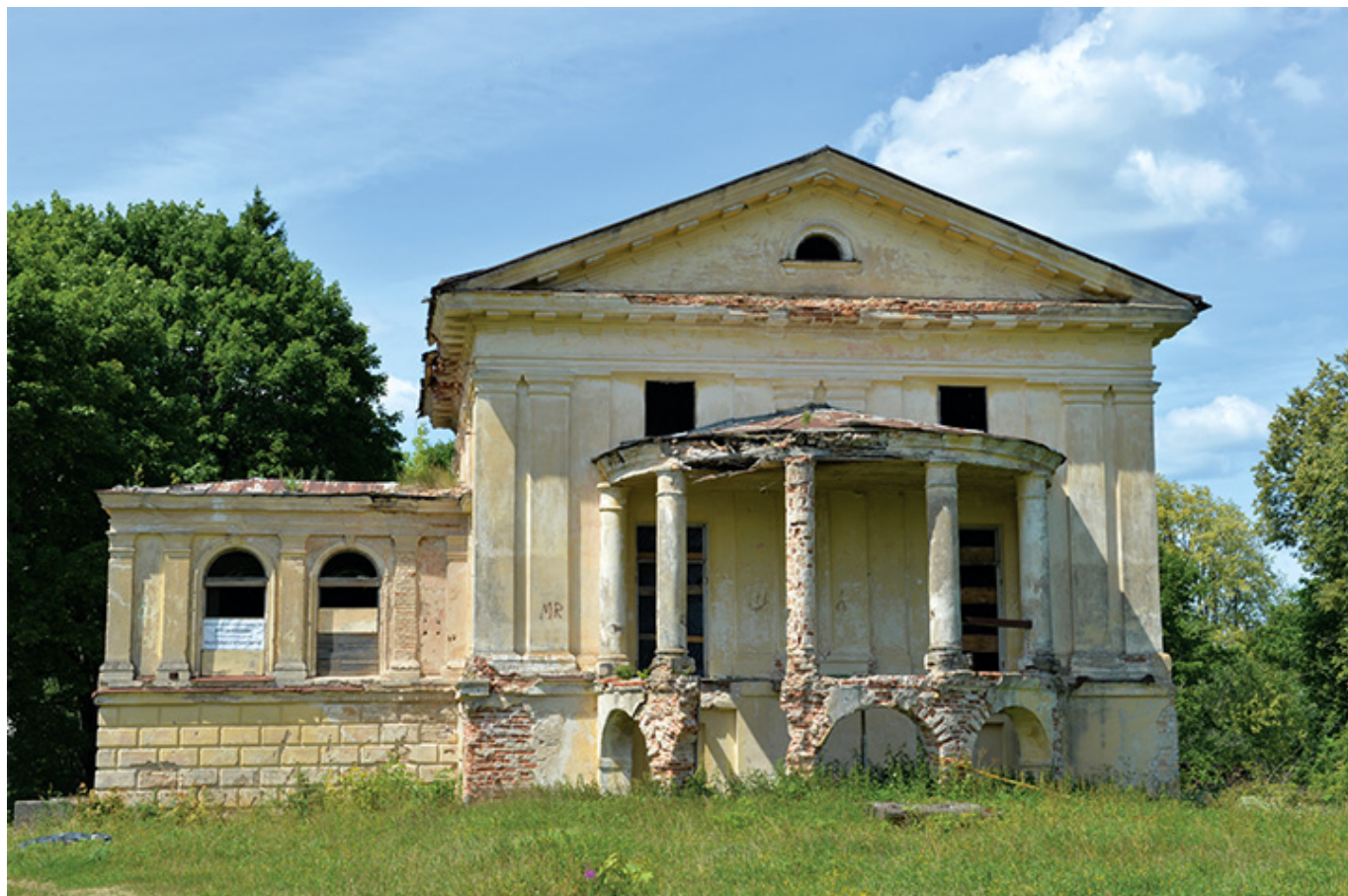
Pałac Parczewskich w Czerwonym Dworze, w Niemenczynie, fot. Jolanta Kłietkutė, 2018 r.