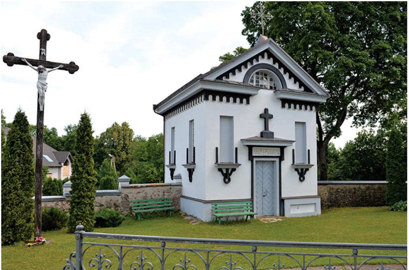
Kaplica-mauzoleum rodziny Parczewskich obok niemeńczyńskiego kościoła