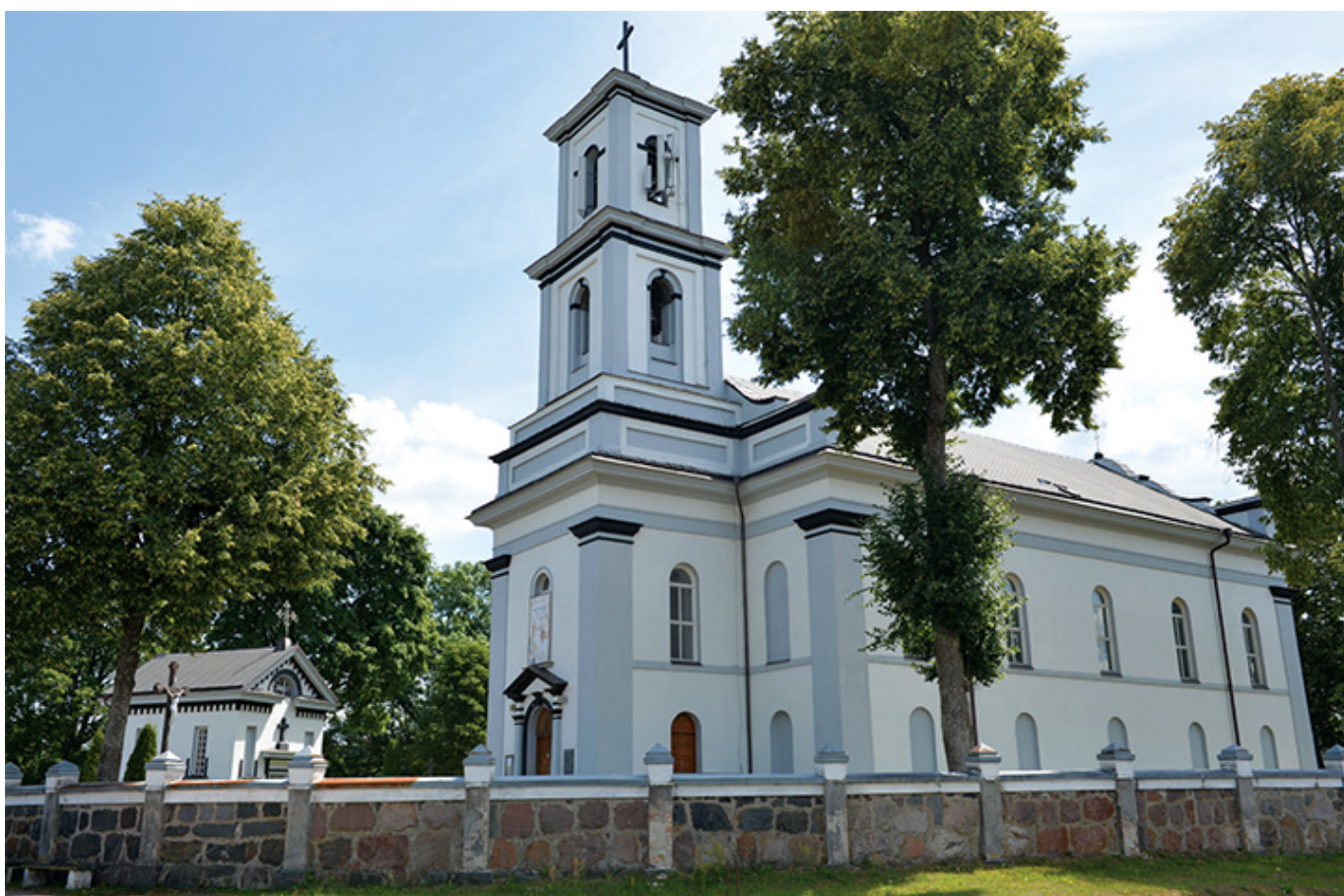
Kościół św. Michała Archanioła w Niemenczynie, fot. Jolanta Klietkutė, 2018 r.

Większą część swojego życia malarka spędziła w domu, w kręgu rodziny, w Czerwonym Dworze, była słabego zdrowia, co roku zapadała na zapalenie płuc. Raz tylko w 1847 r., będąc ze swoją bratanicą - Salomeą w Ciechocinku, aby leczyć płuca, zwiedziła Częstochowę i Warszawę. Niestety pobyt w uzdrowisku nie pomógł, przez kilka miesięcy była bardzo chora. W następstwie choroby 20 października 1852 roku o godzinie 12 w nocy, po uprzednim opatrzeniu Świętymi Sakramentami odeszła na zawsze, w otoczeniu bliskich w Czerwonym Dworze.