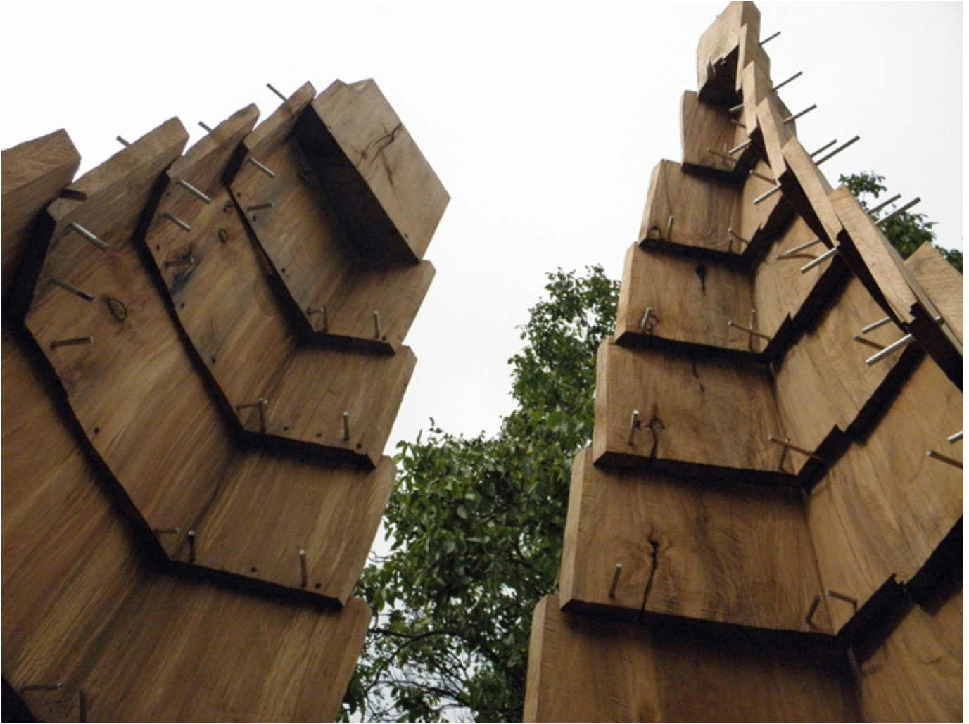
Ryszard Litwiniuk, Two Towers, Gdansk.