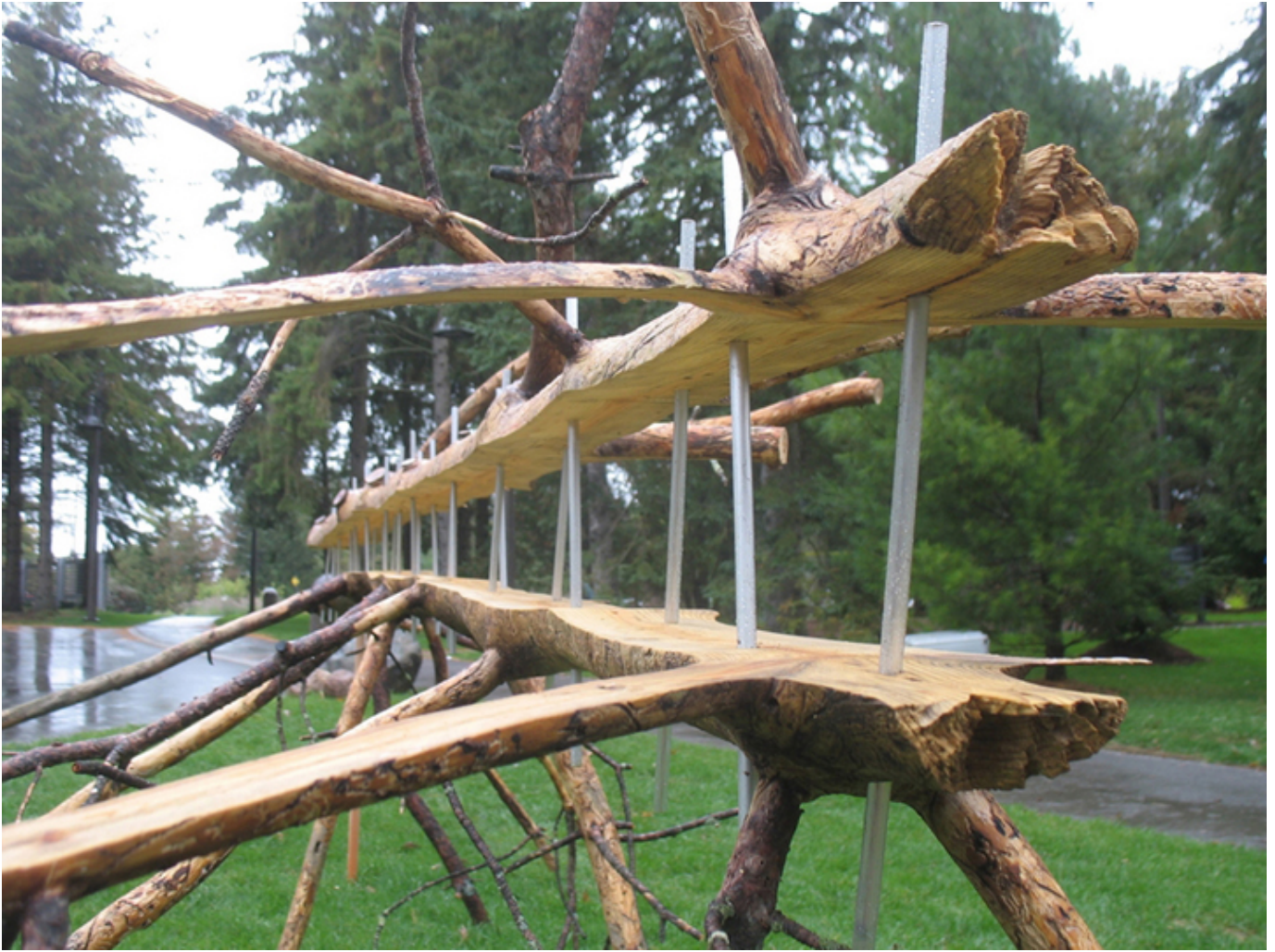
Ryszard Litwiniuk, Dead Tree, Project McMichael Canadian Art Collection 2011.