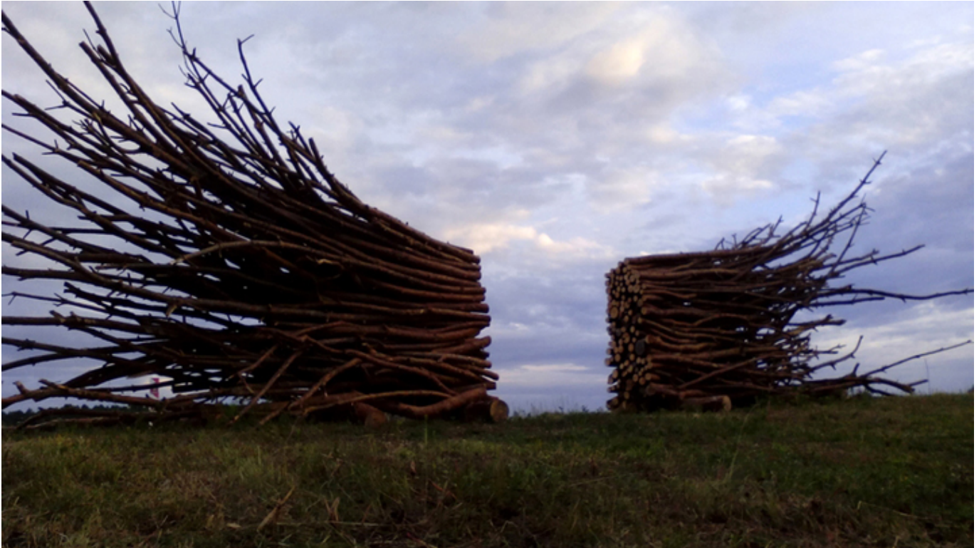
Ryszard Litwiniuk, The Gate, Land Art Festival, Poland.

Od 19 stycznia do 26 lutego 2017 r. w Centrum Sztuki Galeria EL w Elblągu trwa retrospektywna wystawa prac Ryszarda Litwiniuka „System otwarty”.