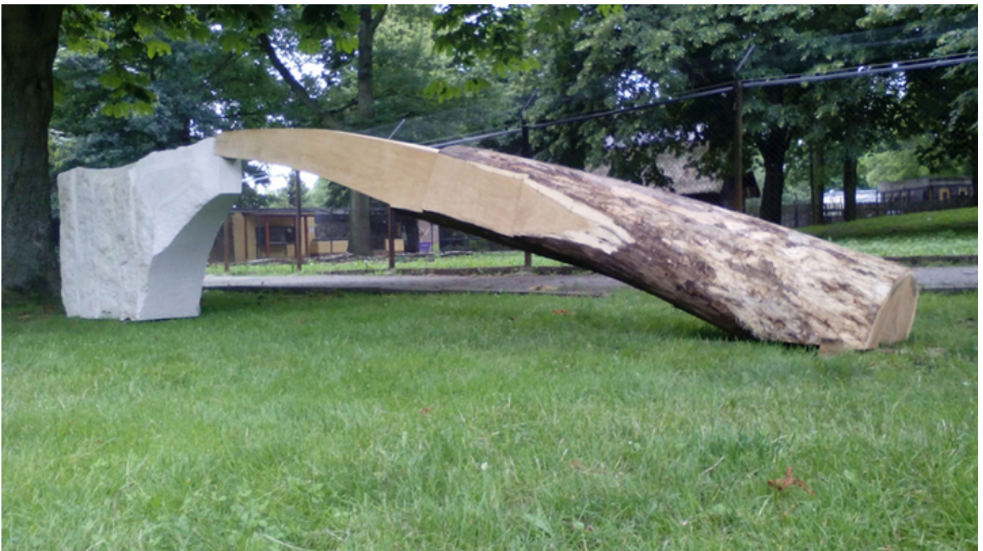
The Bridge Hoyerswerda, Germany.