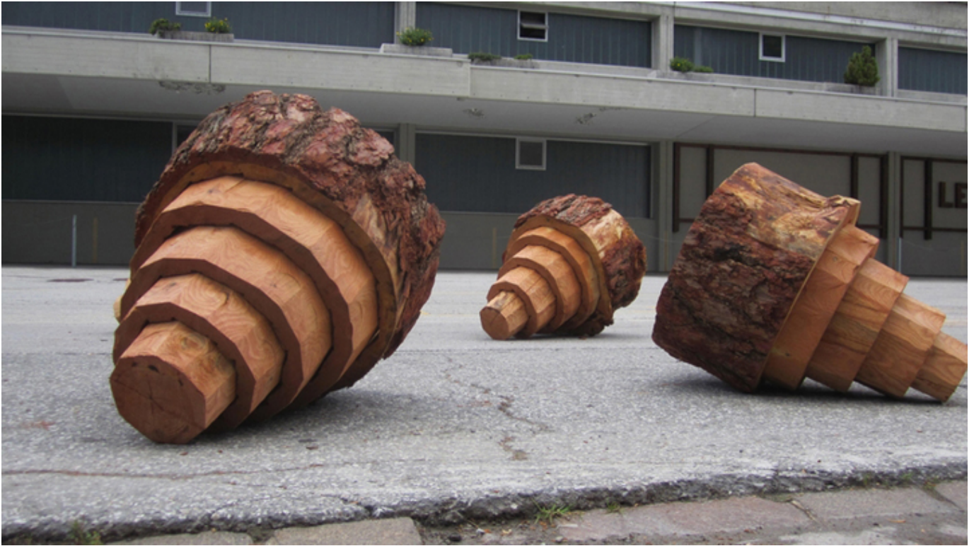
Ryszard Litwiniuk, The Source , Thyon. Switzerland.