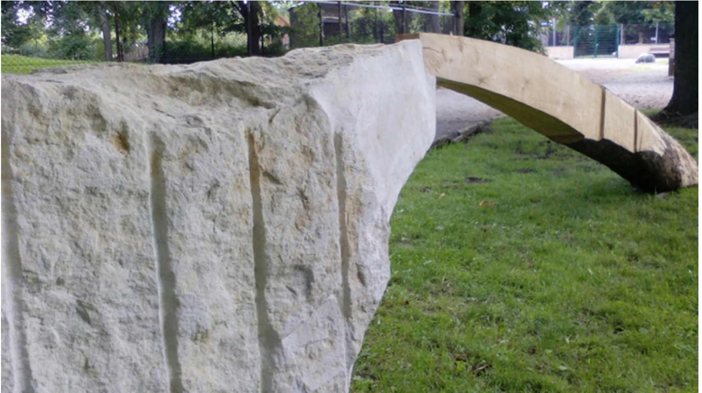
The Bridge Hoyerswerda, Germany.