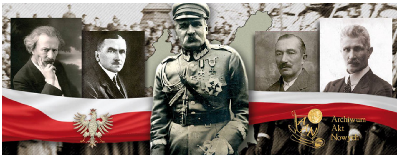
Twórcy polskiej niepodległości, od lewej: Ignacy Jan Paderewski, Roman Dmowski, Józef Piłsudski, Wincenty Witos, Ignacy Daszyński