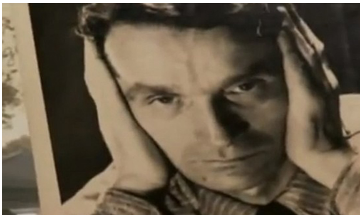
Sergiusz Piasecki. As polskiego wywiadu i znakomity pisarz.