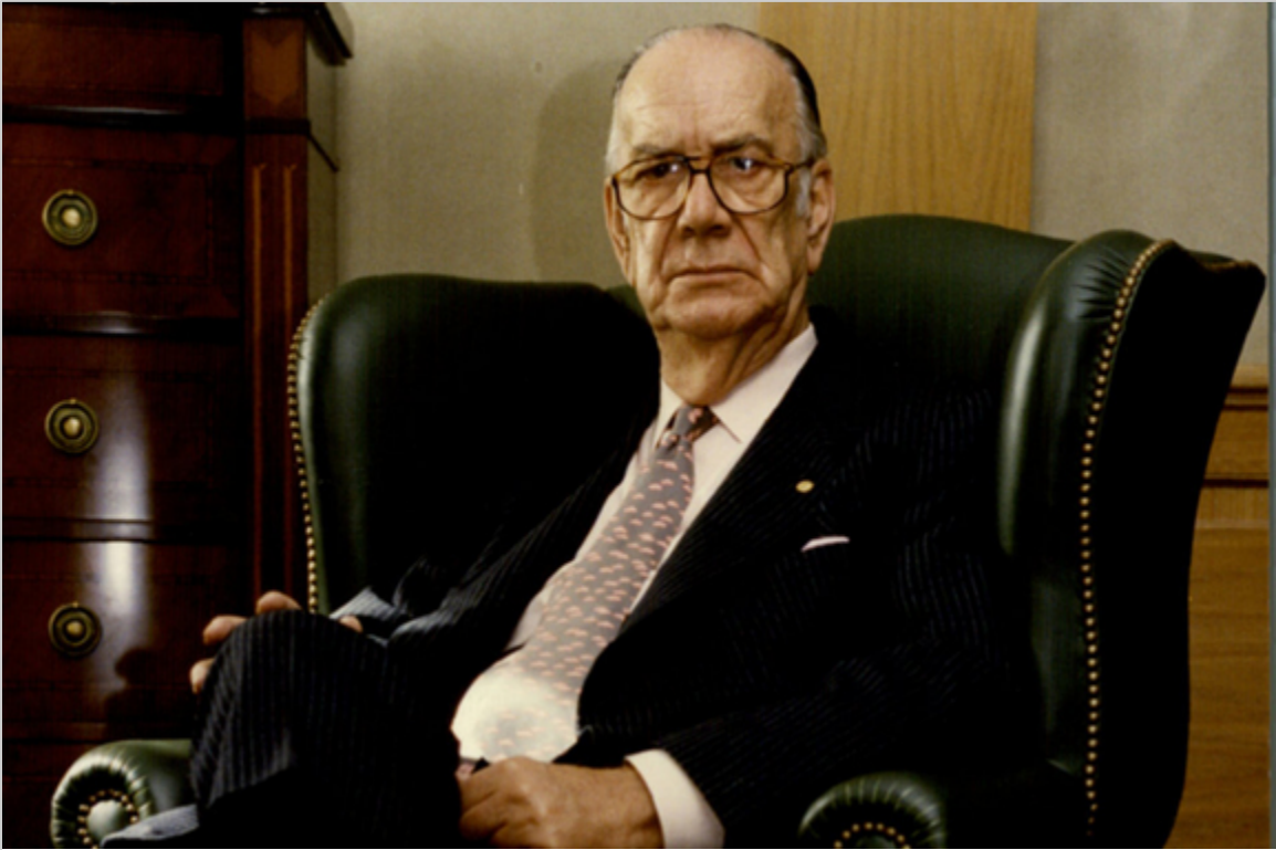
Camilo José Cela

Kiedy nawiązałem z Celą kontakt listowny, obie książki były już w rękach tłumaczy polskich. Pisarz sugerował, bym się podjął przekładu jakiejś innej jego książki. Nie skorzystałem. Najwyraźniej nie miałem nosa do interesu. Zresztą pisałem do niego w sprawie Sergiusza Piaseckiego.