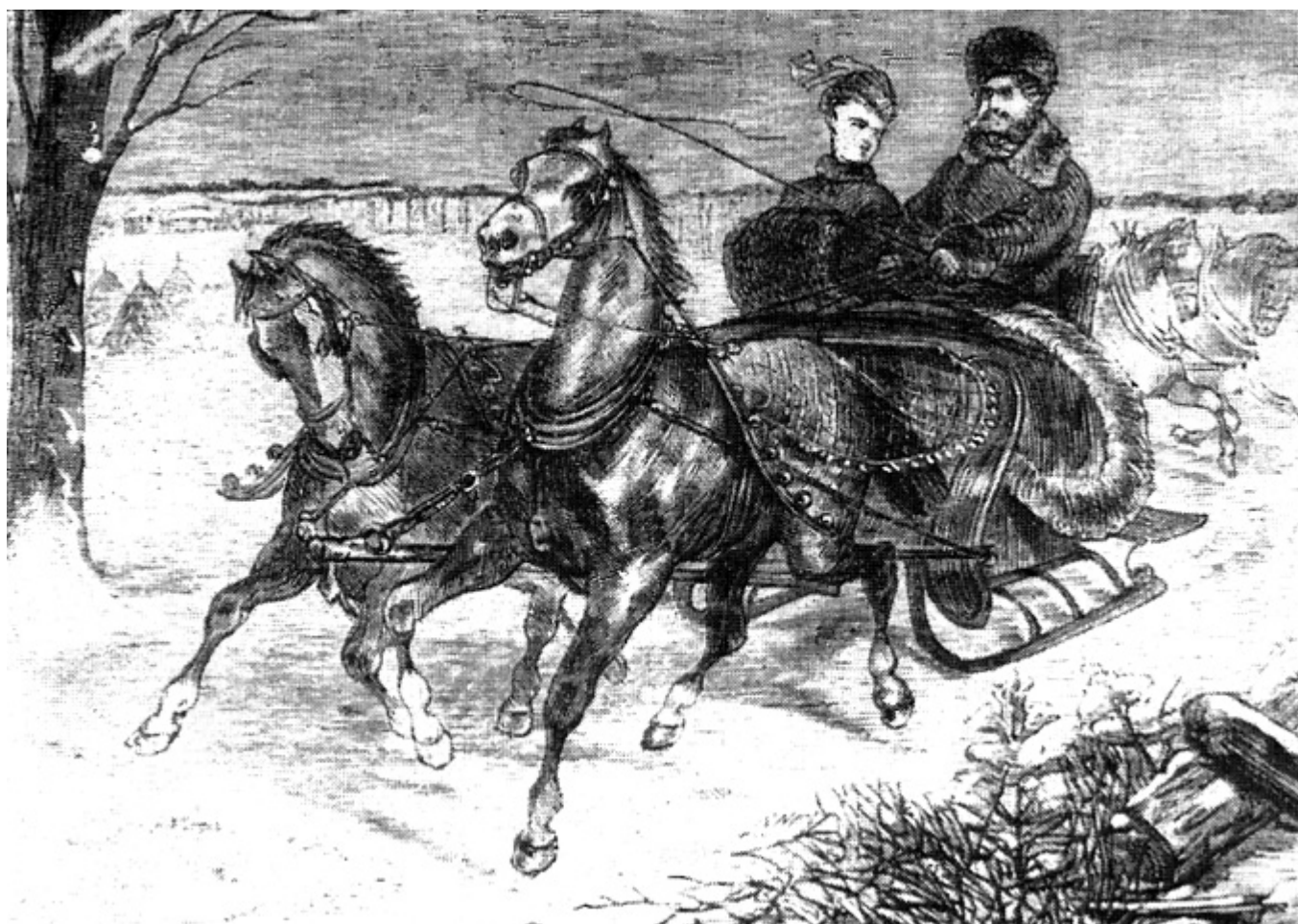
Kulig na starej rycinie.

Tak opisywał staropolskie zabawy karnawałowe, zwane u nas kuligami, wielki historyk obyczajów polskich - Łukasz Gołębiowski (1773-1849) w swej książce „Gry i zabawy różnych stanów” wyd. w Warszawie w 1831 r.