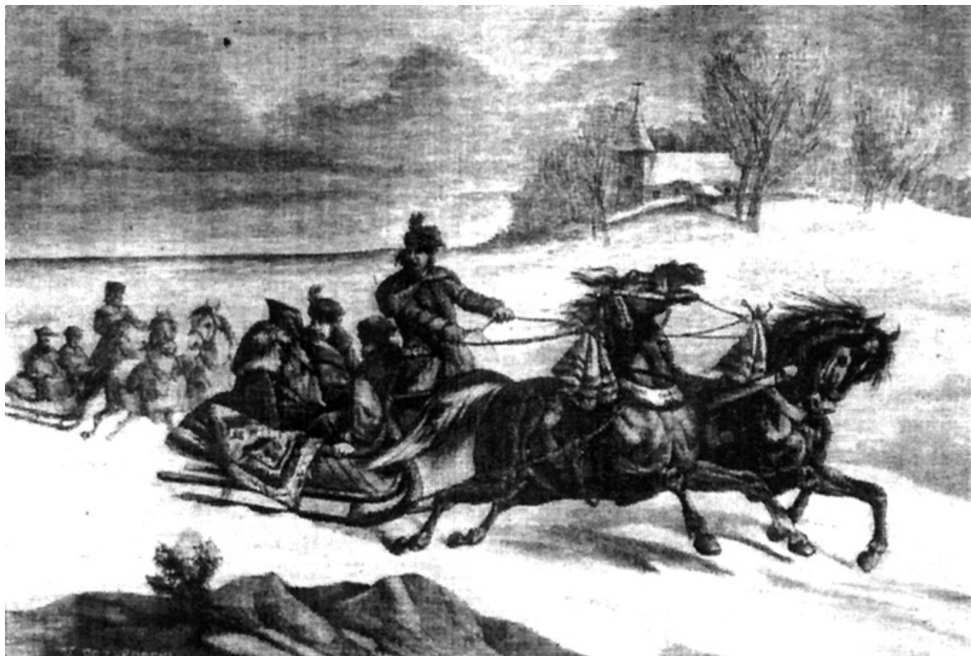
Kulig na starej rycinie.