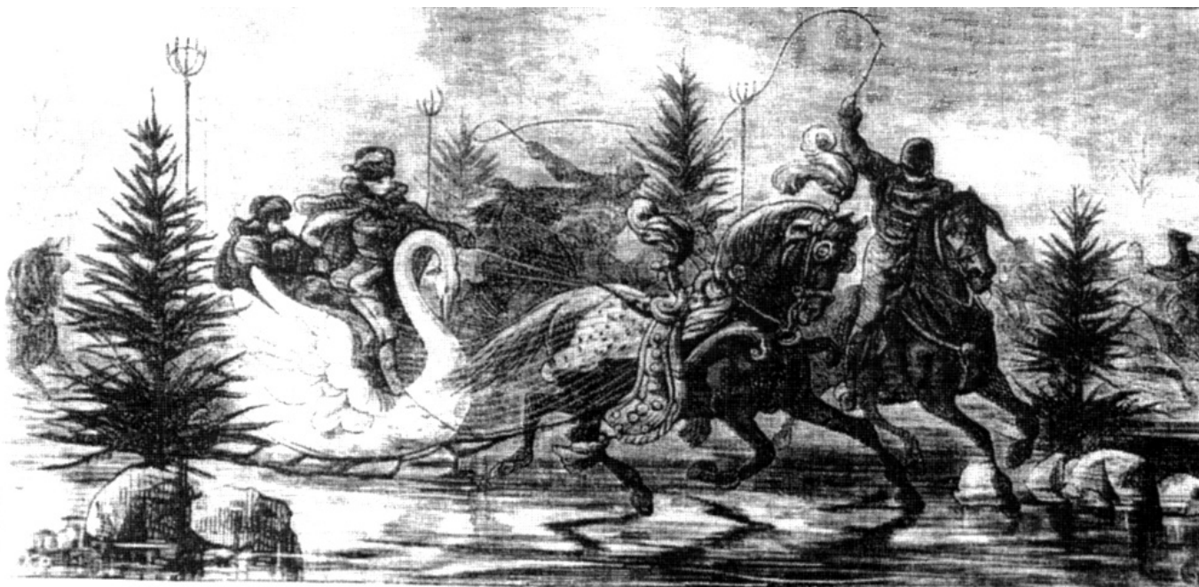
Kulig na starej rycinie.

Do 1944 roku w Paradnej Szorowni w Łańcucie stały przepiękne złote saneczki, w kształcie muszli, z której wyrastało bóstwo morskie - grubiutki, mały Tryton, grający