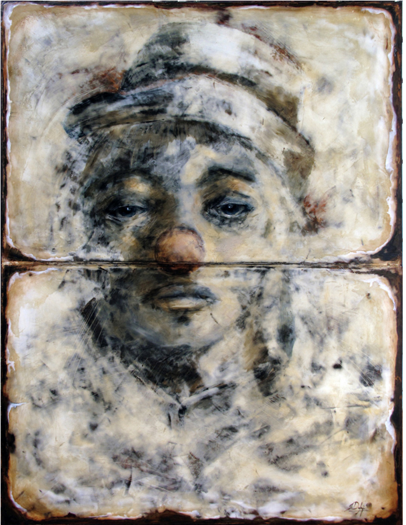
Iwona Dufaj, Apart - 36" x 48" plaster and oil on canvas.