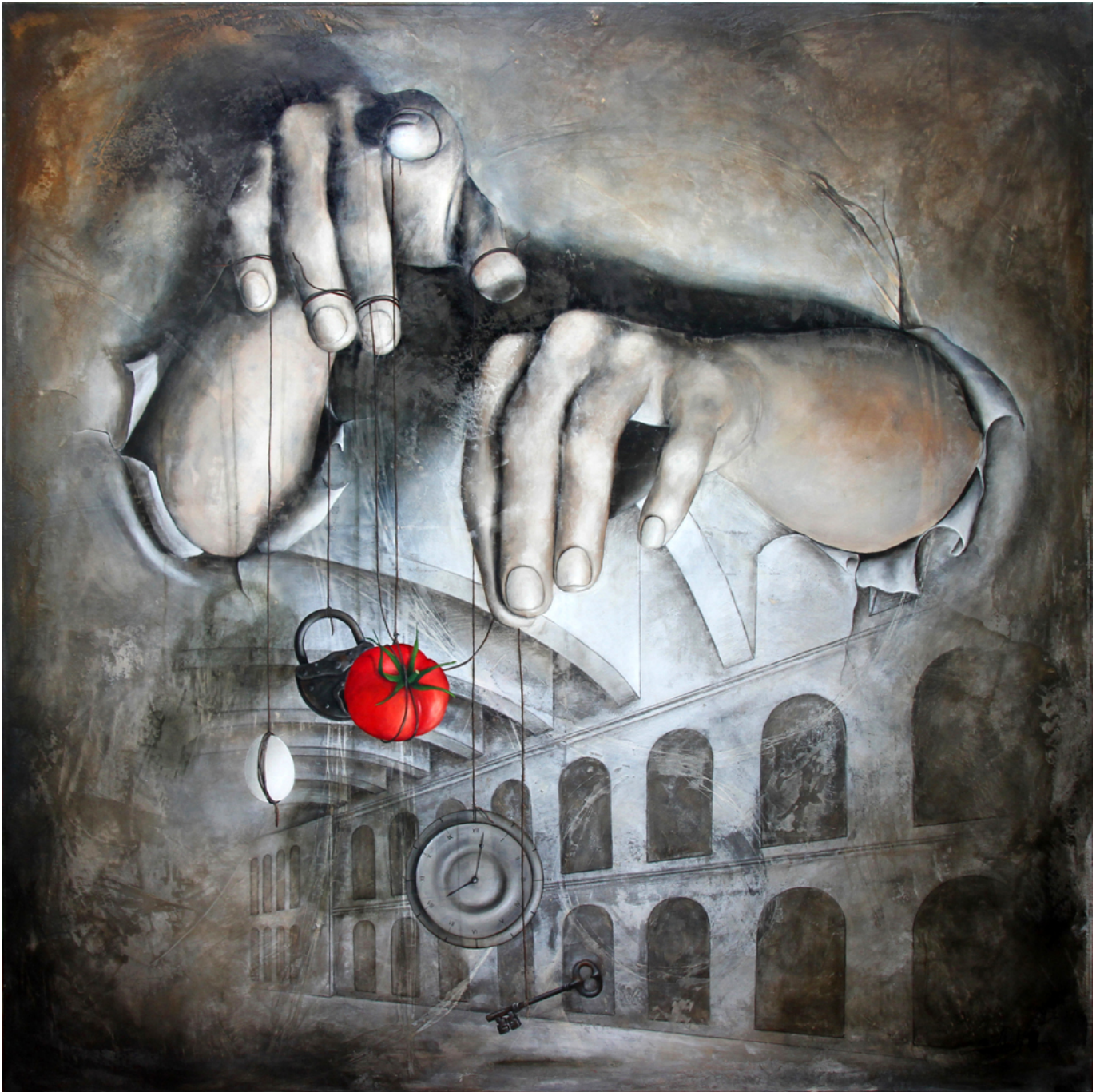
Iwona Dufaj, Fatum - 48" x 48" x 2" layers of polished Venetian plaster and oil on canvas.