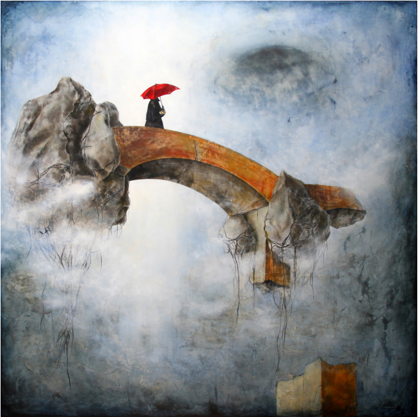
Iwona Dufaj, Rite of Passage (Innocence Lost) - 48" x 48" x 2" layers of polished Venetian plaster and oil on canvas.