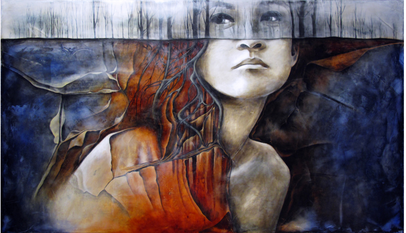
Iwona Dufaj, Healing - 36" x 60" plaster and oil on canvas.

Iwona Dufaj jest kanadyjską artystką, która w swoich obrazach olejnych odkrywa wizualną narrację, przekazując ideały emocjonalnych więzi ludzkiej natury.