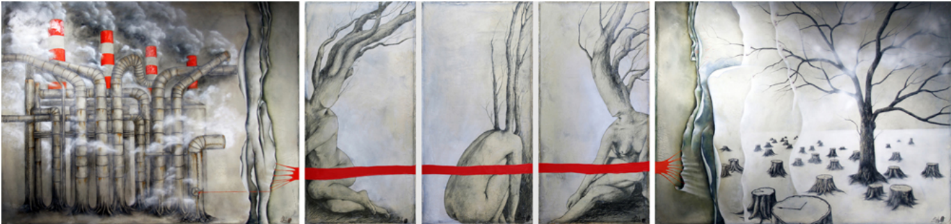
Iwona Dufaj, The Chase - 125" x 30" layers of polished Venetian plaster, pencil and oil on canvas.