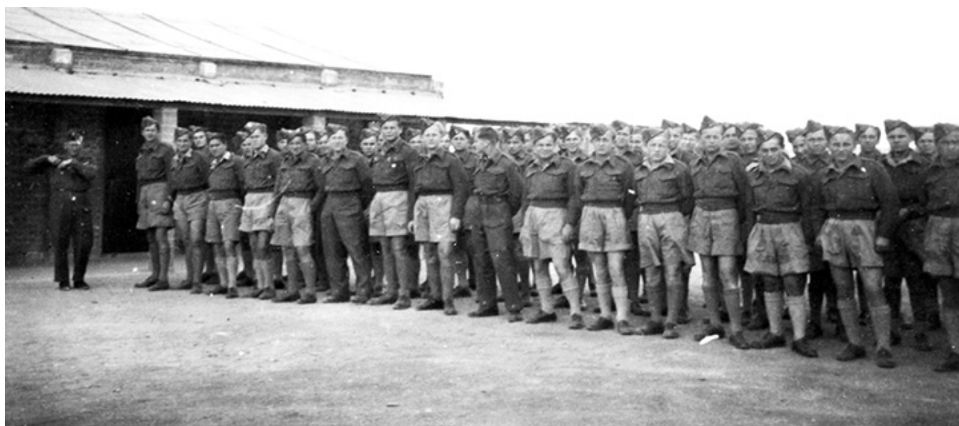
Pierwsze miesiące gimnazjum w Heliopolis, jeszcze w mundurach junackich. Obok w murowanym budynku znajdowały się klasy szkolne. Marzec 1943.