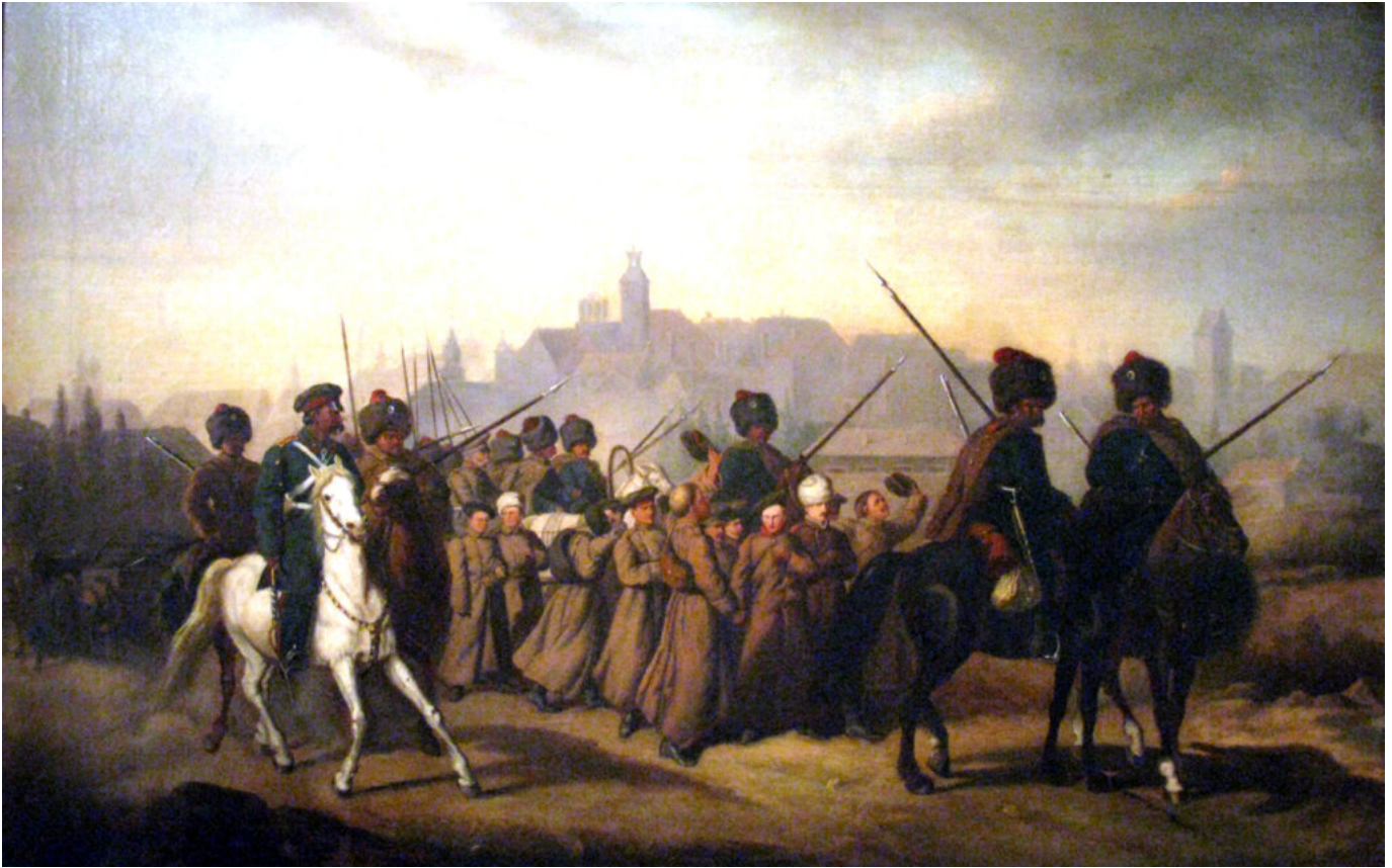
Aleksander Sochaczewski, Branka Polaków do armii rosyjskiej w 1863 r.