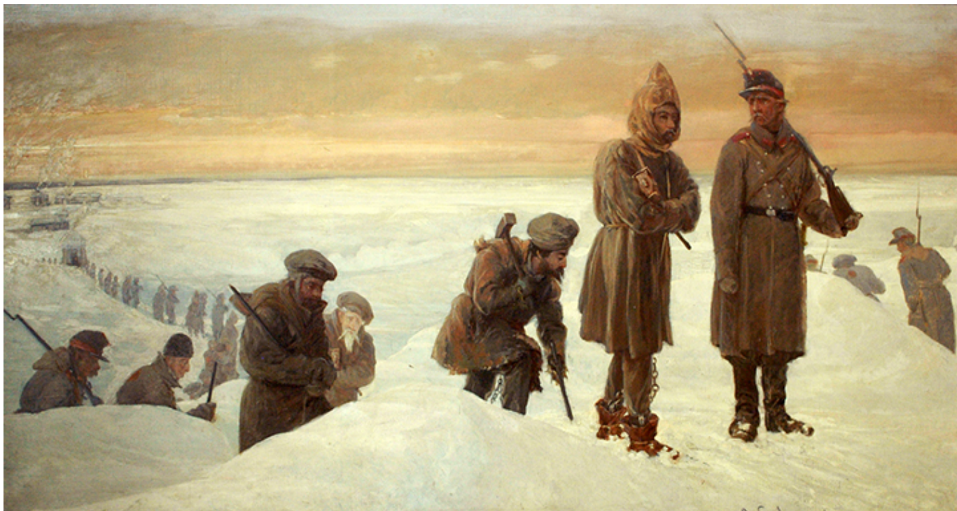
Aleksander Sochaczewski, W drodze na katorgę, ekspozycja stała Muzeum X Pawilonu Cytadeli Warszawskiej