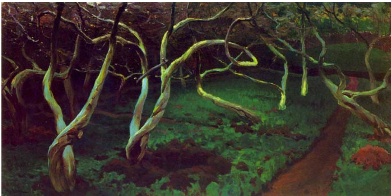
Ferdynand Ruszczyc, Stare jabłonie.