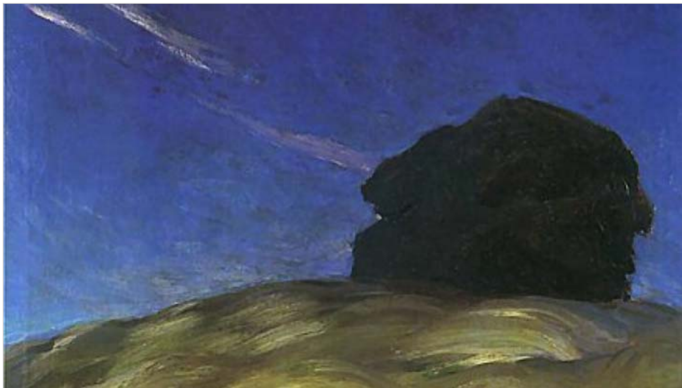
Ferdynand Ruszczyc, „Obłok”, 1902, olej na płótnie, 110 x 80 cm, wł. Muzeum Narodowe w Poznaniu.