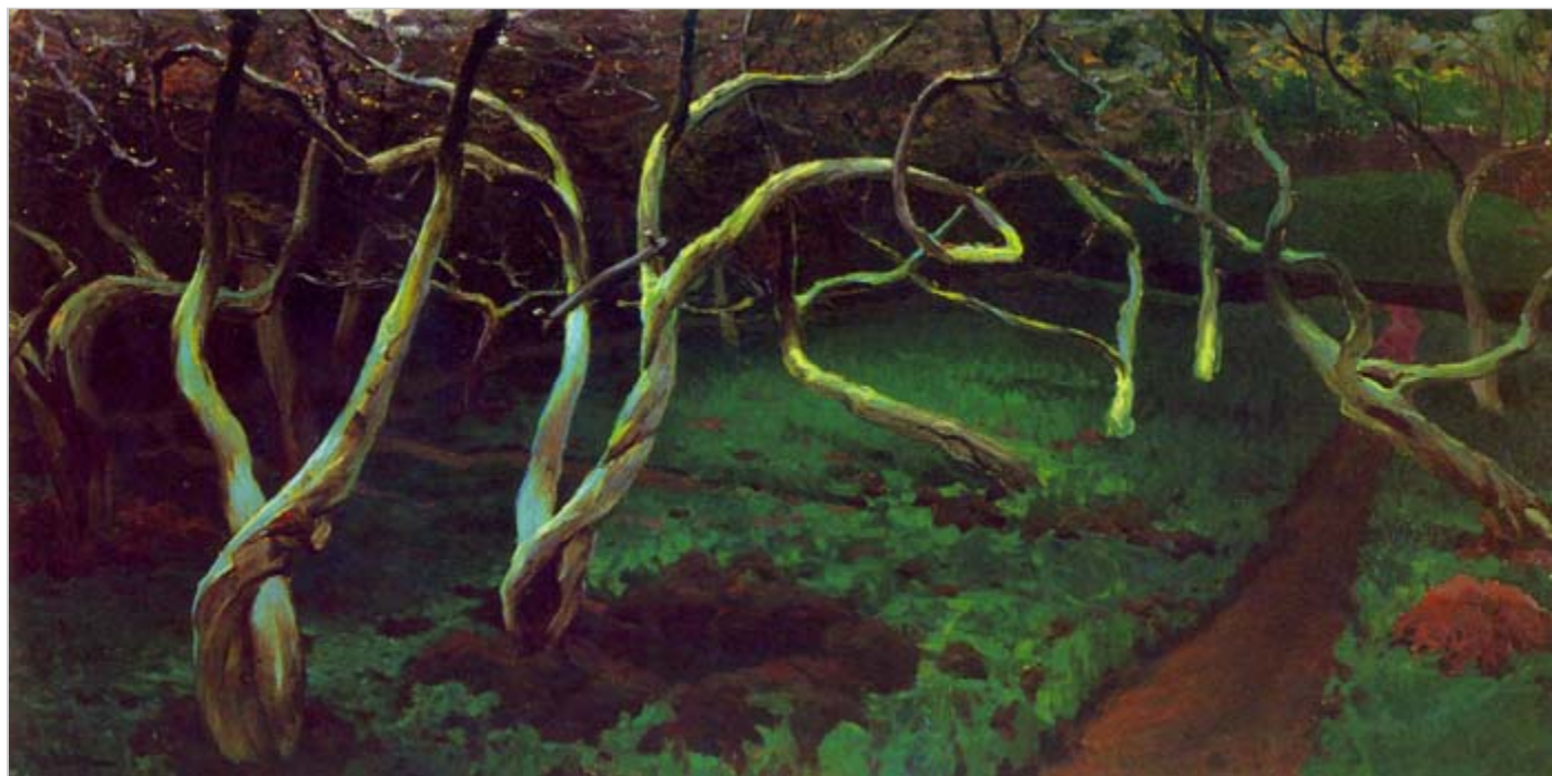
Ferdynand Ruszczyc, Stare jabłonie.

ludzie zbyt nie główkowali, dano im pracę nie ludzko ciężką i za marny grosz. Byle tylko utrzymać się przy życiu. Pod warunkiem, że zdrowie nie nawali.