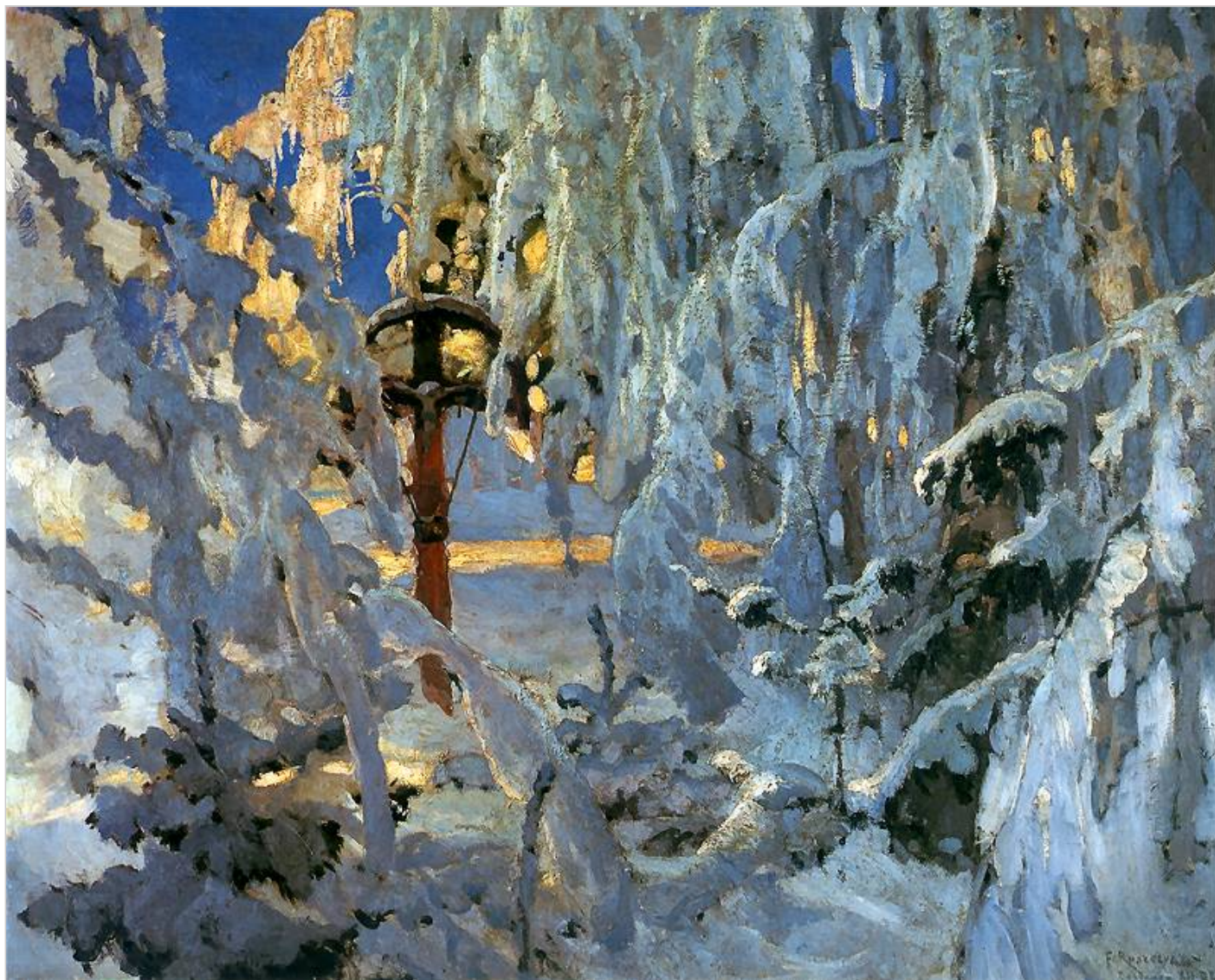
Krzyż w śniegu 1902. Olej na płótnie. 104 x 128 cm. Własność prywatna.