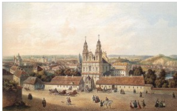
Zygmunt Vogel, Kościół Misjonarzy w Wilnie. Muzeum Narodowe, Kraków.

„Magia słów: Rzeczywiście jest zmierzch wieczorny nad Wilnem. Powinienem zapalić lampę, ale jakoś - nie chce się. Otwieram okno na tę cudowną jesień 1934... Balladami o romansami pachnie... Po tych ulicach chodził... Przystawał... Zamyślał się... Ucho natężał ciekawie... Chłopak zadziorny. Tu w Wilnie nad jego czułymi wierszami płakali najprostszy. A przecież był poetą <<awangardy>>. Jakie to dziwne. A jakie proste!”