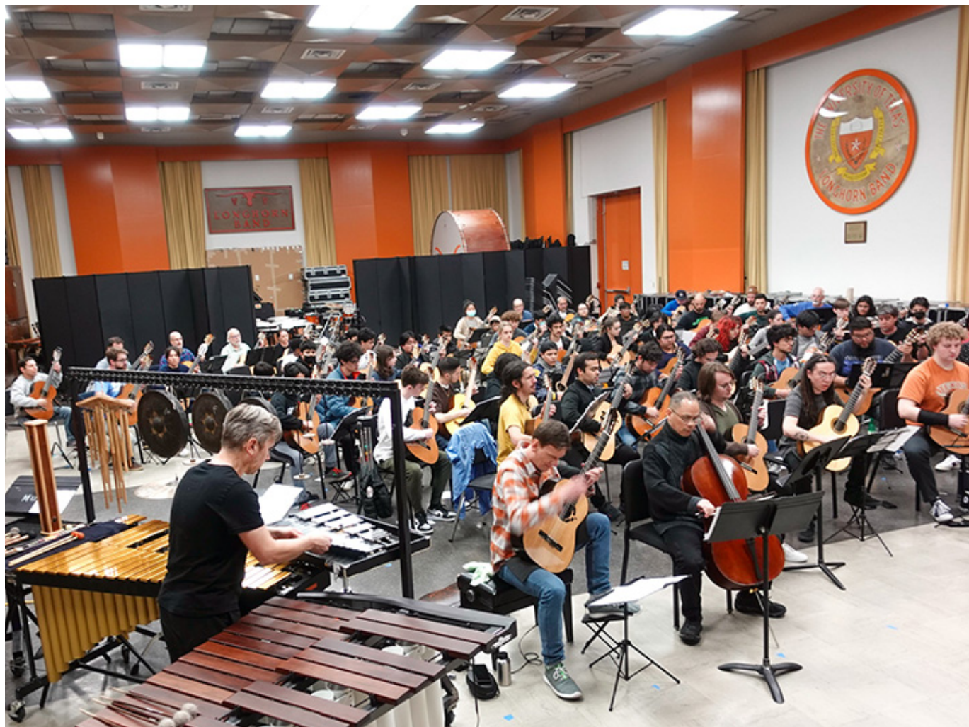
Próba przed koncertem w Austin