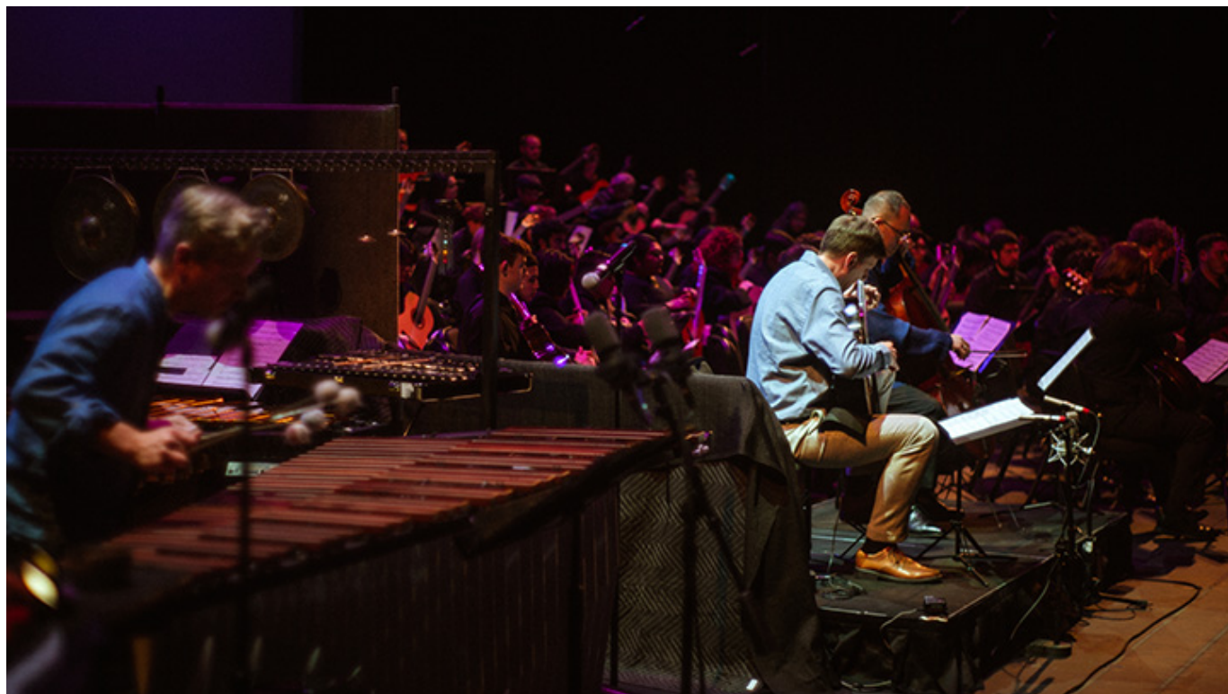
Fenomenalny koncert w Aisd Performing Arts Center w Austin, 18-tego lutego 2023 r., fot. Jack Kloecker