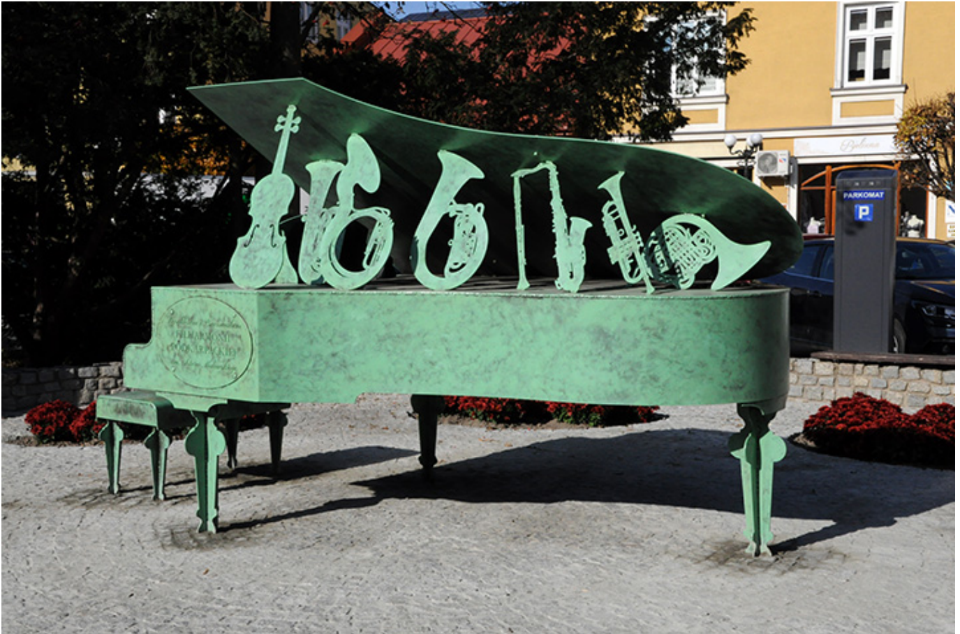
Pomnik poświęcony 60-tej rocznicy Dni Muzyki Kameralnej w Łańcucie