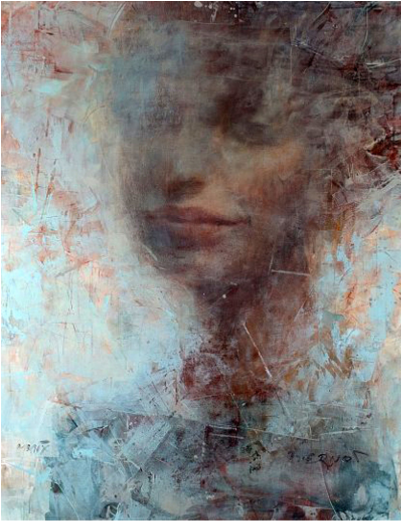
Danielle de Niese jako Eurydyka, acrylic, pastel, olej na płótnie, 145 x 209 cm.