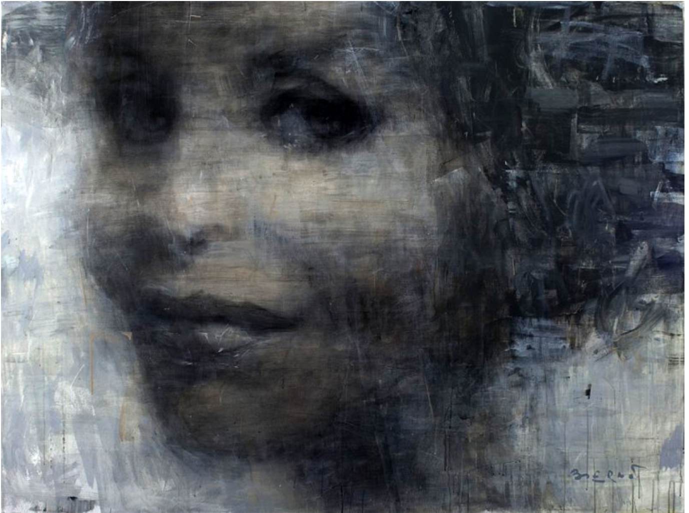
Renée Fleming, acrylic, pastel, olej na płótnie, 201 x 151 cm.