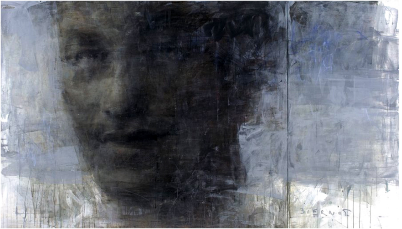
Piotr Beczała, acrylic, pastel, olej na płótnie, 211 x 120 cm.