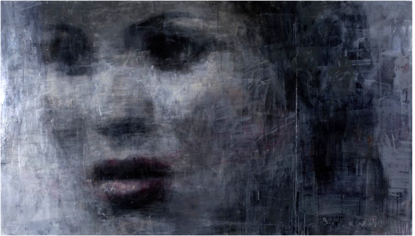
Anna Netrebko, acrylic, pastel, olej na płótnie, 211 x 120 cm.