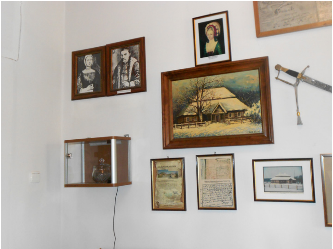
Muzeum Tadeusza Kościuszki w Maciejowicach

Pałac wymaga remontu, gdyż budowla została zniszczona od kul armatnich i podpalona przez Rosjan. Ciągłe zachwyca swoim dostojnym pięknem park krajobrazowy założony przez Stanisława Kostkę Zamoyskiego. Na przełomie XIX i XX wieku Podzamcze było chlubą polskiego ogrodnictwa. Podzamecka szkółka drzew i krzewów była największa nie tylko w Polsce, ale w całym Cesarstwie Rosyjskim. Na terenie parku znajduje się głąz upamiętniający ostatni bój Naczelnika Sił Zbrojnych w czasie insurekcji kościuszkowskiej. Tablica została postawiona w 1994 roku.