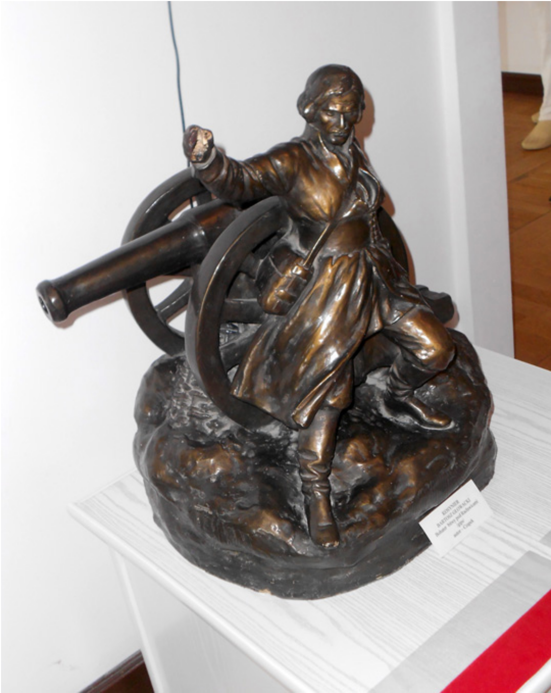
1800-1808 BUSTO ARSIZIO Busto bronze per l'armamento 1800-1808 anni - Europa