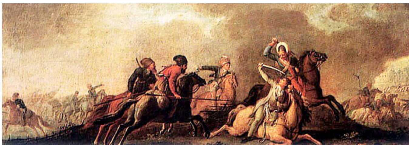
Jan Bogumił Plersch, Bitwa pod Maciejowicami, Tadeusz Kościuszko spada z konia

Pierwszy krok do zrzucenia niewoli to odważyć się być wolnym, pierwszy krok do zwycięstwa poznać się na własnej sile.