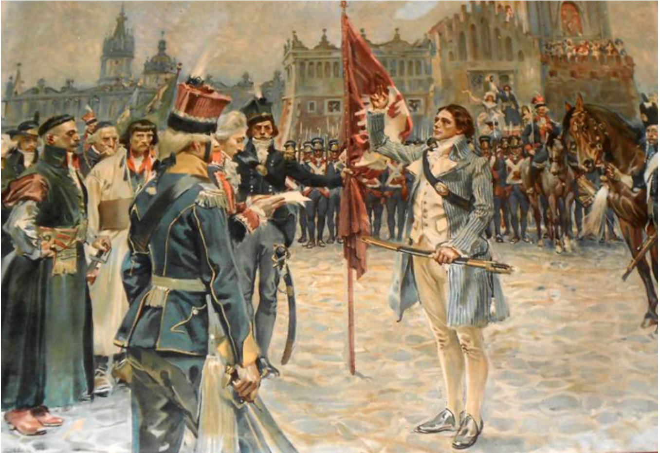
Wojciech Kossak, Przysięga Tadeusza Kościuszki na Rynku w Krakowie, Muzeum Tadeusza Kościuszki w Maciejowicach

W dniu 24 marca 1794 roku, na Rynku Głównym w Krakowie Naczelnik Tadeusz Kościuszko złożył uroczystą przysięgę, ogłaszając tym samym akt powstania narodowego, znanego w historii jako insurekcja kościuszkowska.