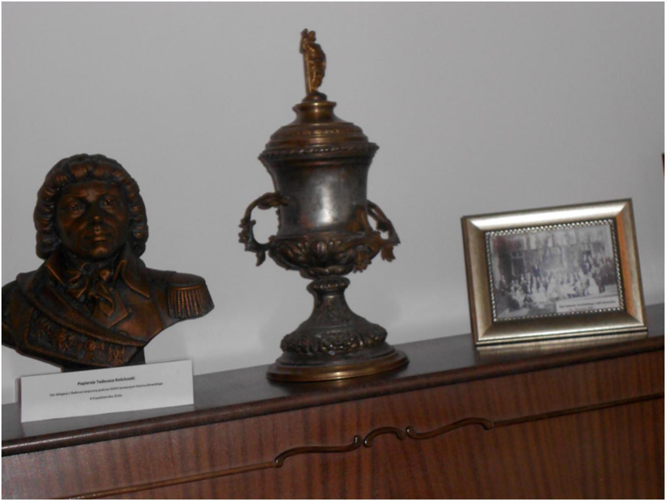
Papież Jan XXIII Wzrost 170 cm, waga 60 kg, data urodzenia 25 stycznia 1912 r., data śmierci 6 czerwca 1963 r., data pontyfikatu 21 czerwca 1963 r. - 24 czerwca 1963 r.