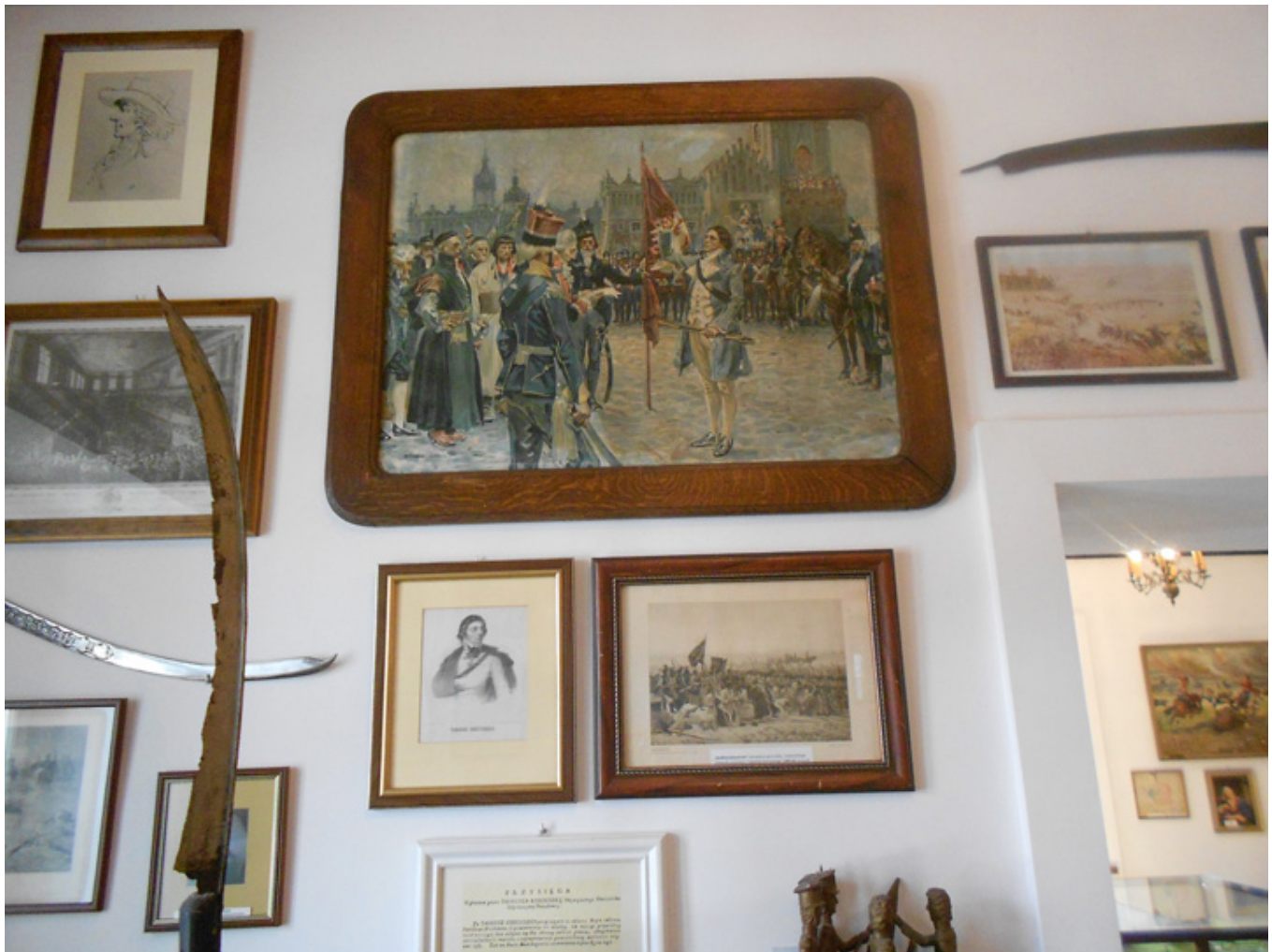
Muzeum Tadeusza Kościuszki w Maciejowicach, fot. Barbara Kukulska.

Muzeum urządzone z wielką starannością. Prezentowane są obrazy olejne, dokumenty, mapy, manekiny żołnierzy. Wzbudza wielkie zainteresowanie ciekawa makieta pola bitwy stoczonej pod Maciejowicami, na której figurki żołnierzy w kolorowych mundurach uplastyczniają przemieszczanie się wojsk. W kilku salkach Muzeum nagromadzono tak dużą ilość pamiątek, że w krótkim czasie nie sposób zapoznać się ze wszystkimi. Zbiory są dobrane z wielką skrupulatnością i znajomością tematu. W 220 rocznicę insurekcji kościuszkowskiej Muzeum otrzymało okolicznościowy medal.