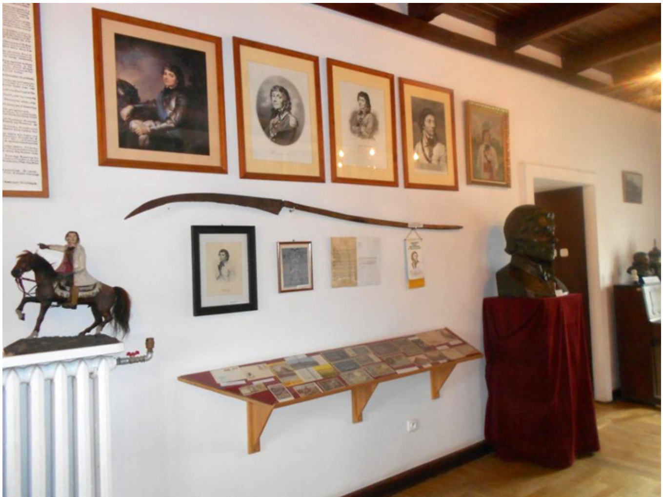
Muzeum Tadeusza Kościuszki w Maciejowicach, fot. Barbara Kukulska.

Wzbudzić potrzeba miłość kraju w tych, którzy dotąd nie wiedzieli nawet, że Ojczyznę mają.