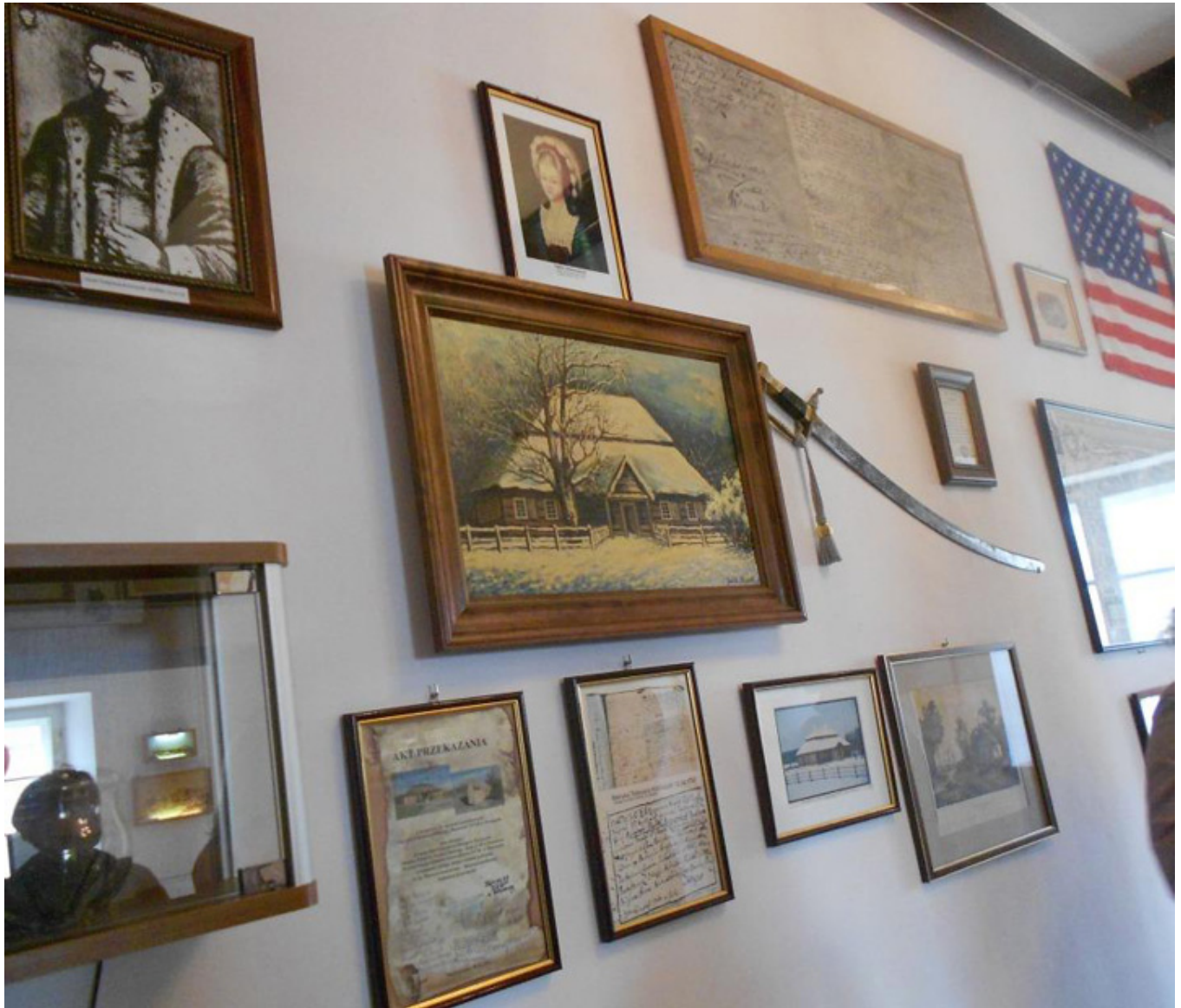
Muzeum Tadeusza Kościuszki w Maciejowicach