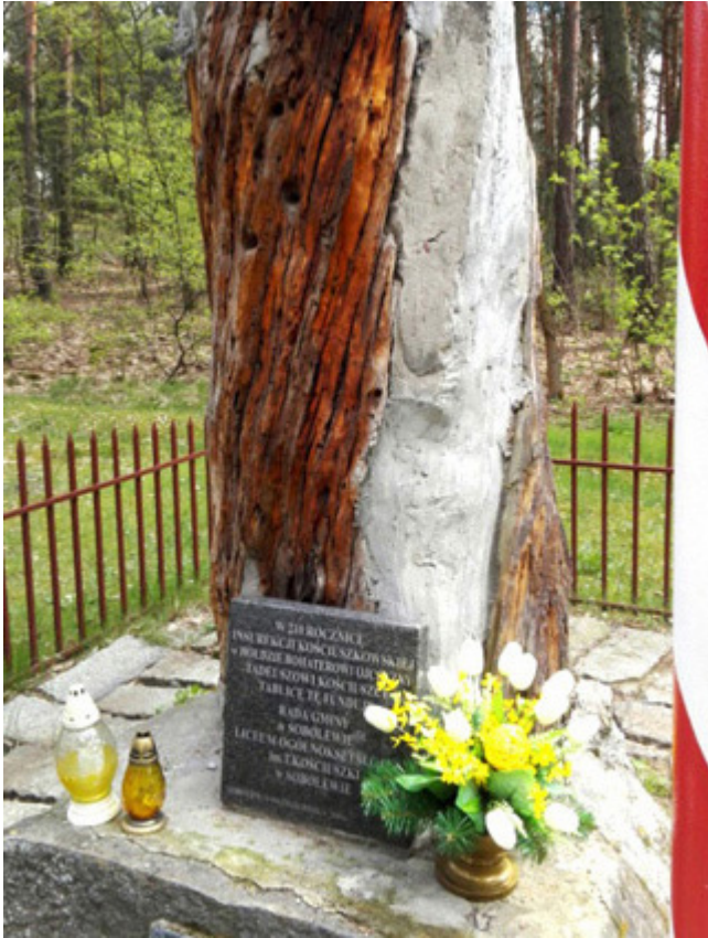
Pamiętkowe drzewo-pomnik, fot. Barbara Kukulska.

Na szczycie wzgórka zbudowanego z kamieni znajduje się na postumencie drewniany krzyż. Krzyż został wystawiony w setną rocznicę zgonu Tadeusza Kościuszki (zm. 15.10.1817), a usytuowanie Kopca według tradycji jest miejscem, gdzie wielki wódz przelał swą krew za wolność Ojczyzny.