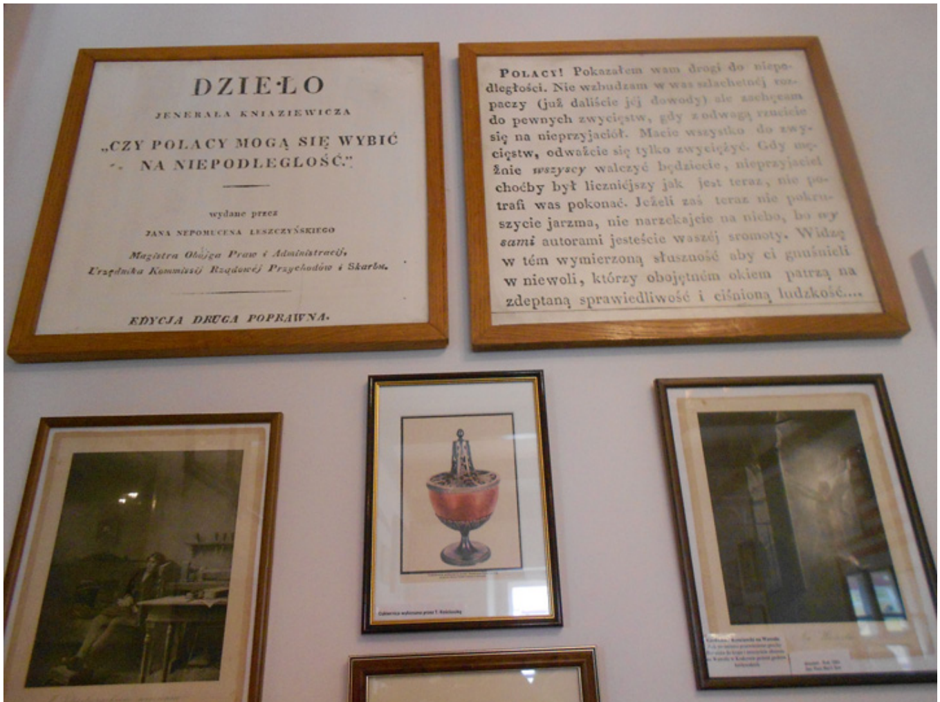
Muzeum Tadeusza Kościuszki w Maciejowicach, fot. Barbara Kukulska.