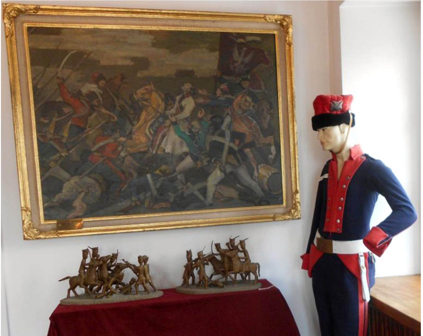
Muzeum Tadeusza Kościuszki w Maciejowicach, fot. Barbara Kukulska.