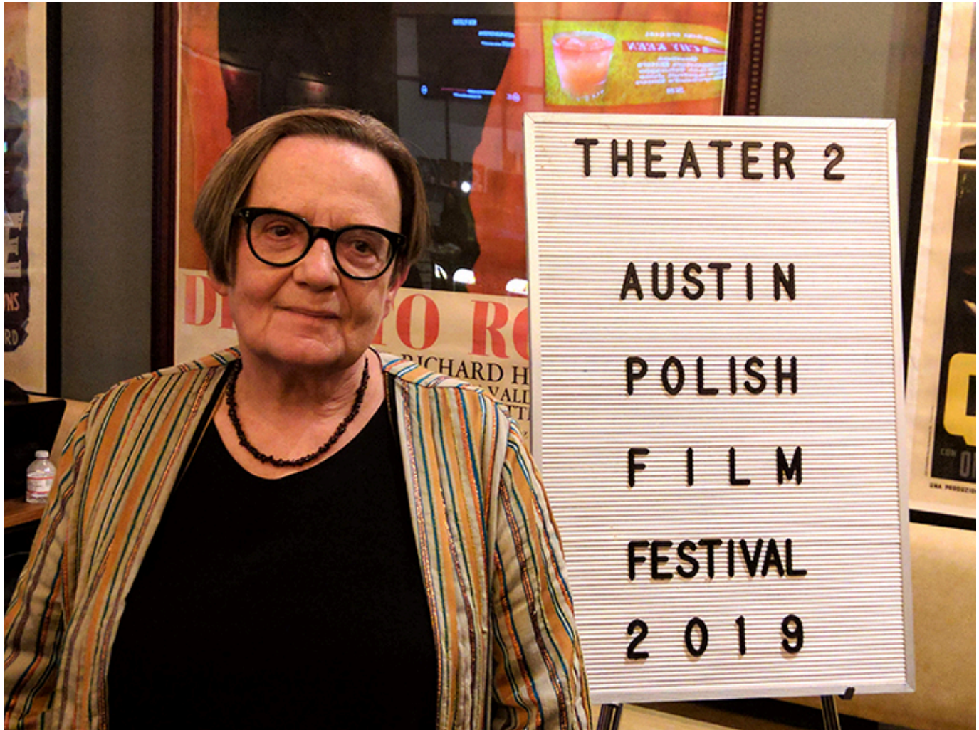
Agnieszka Holland

Interview with Agnieszka Holland about her film „Mr. Jones”