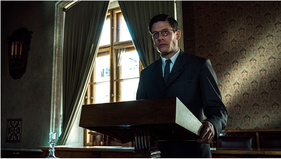
James Norton, jako Gareth Jones w filmie Agnieszki Holland „Mr. Jones” (2019)