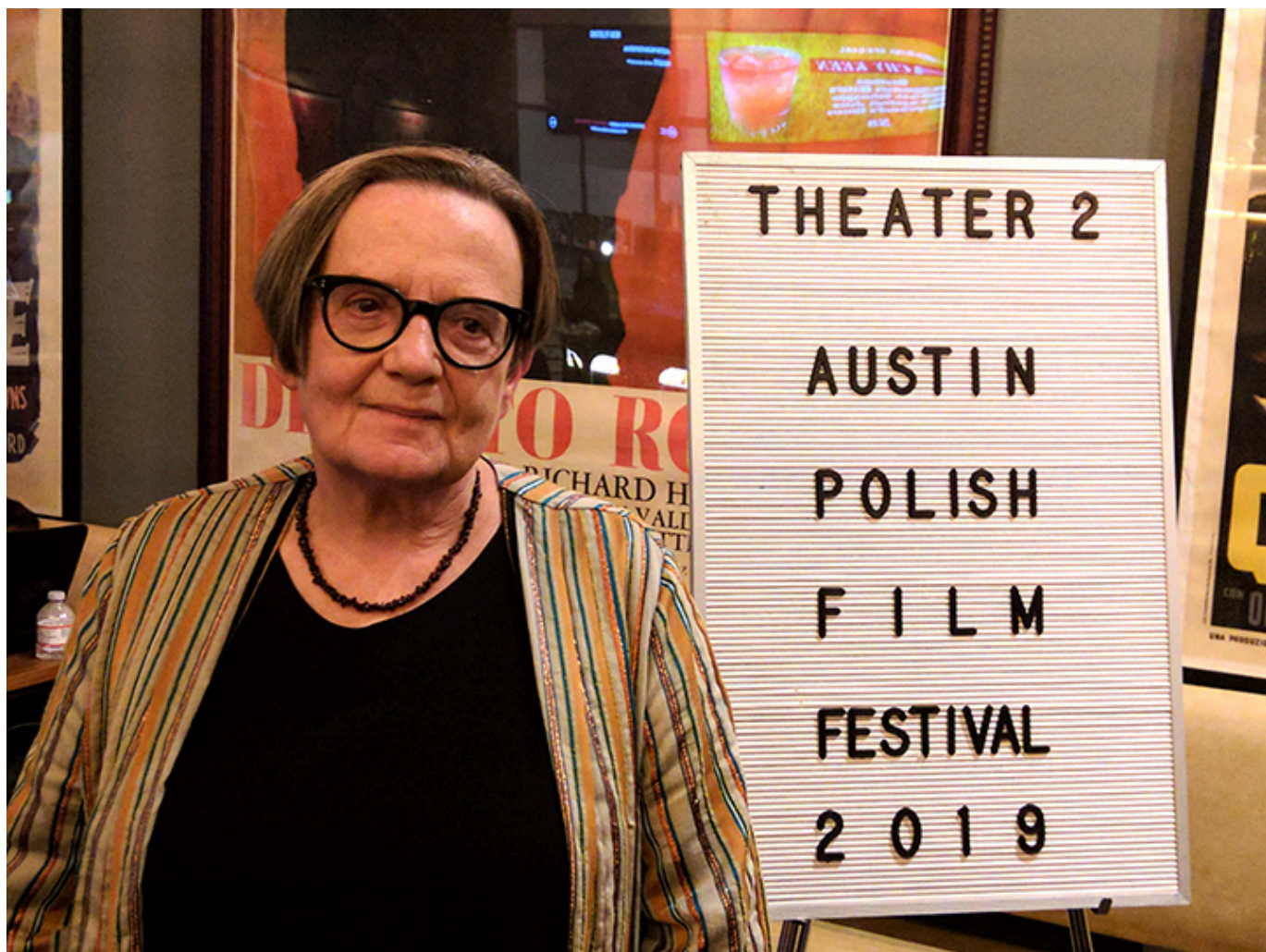
Agnieszka Holland