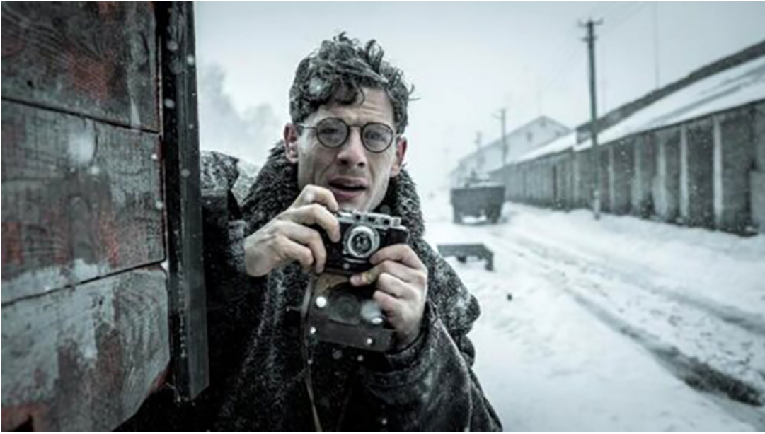
James Norton as Gareth Jones in Agnieszka Holland's film „Mr. Jones „(2019)