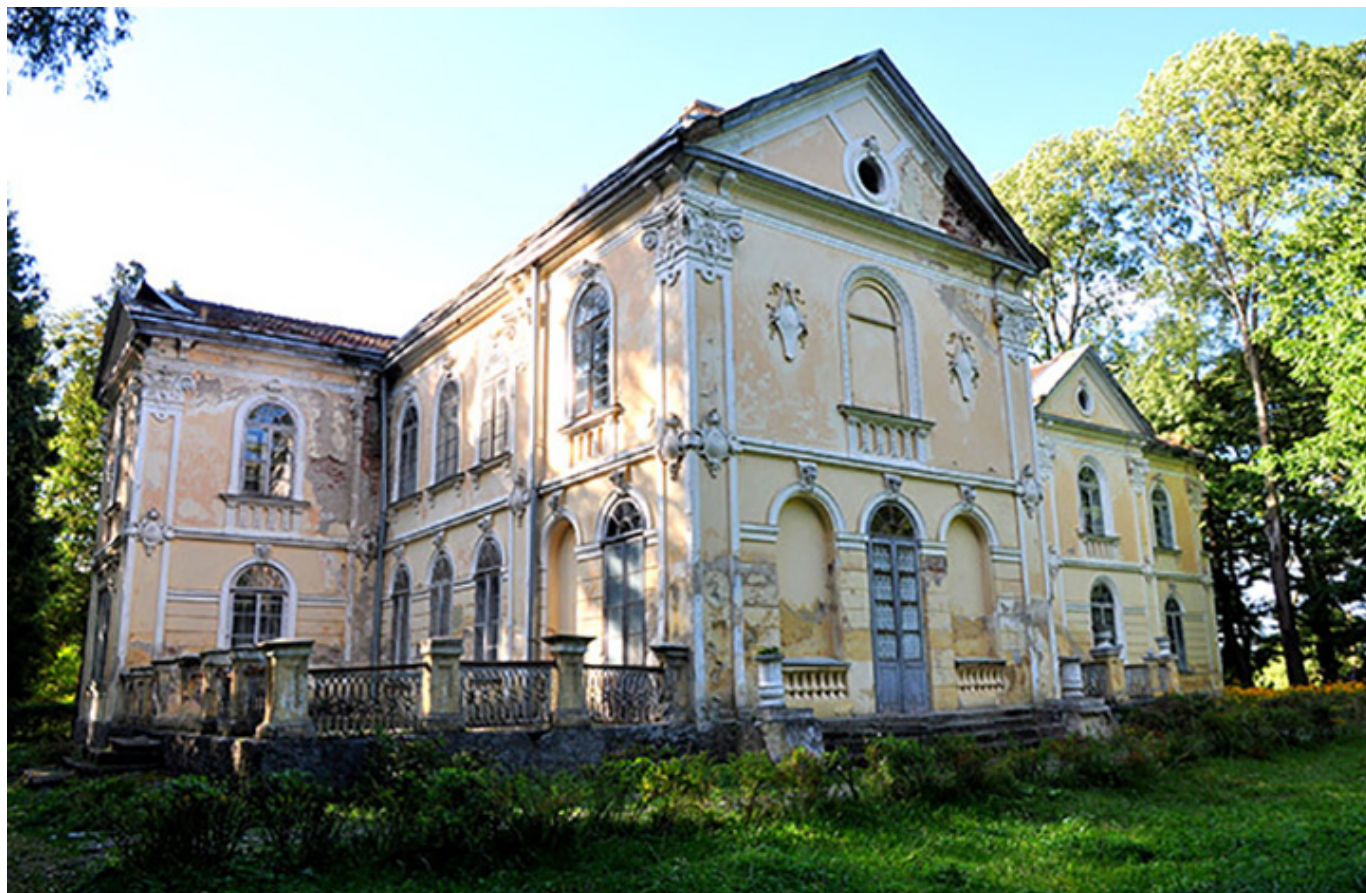
Pałac Fredrów w Bienkowej Wiszni, fot. Ewa Giszterowicz.