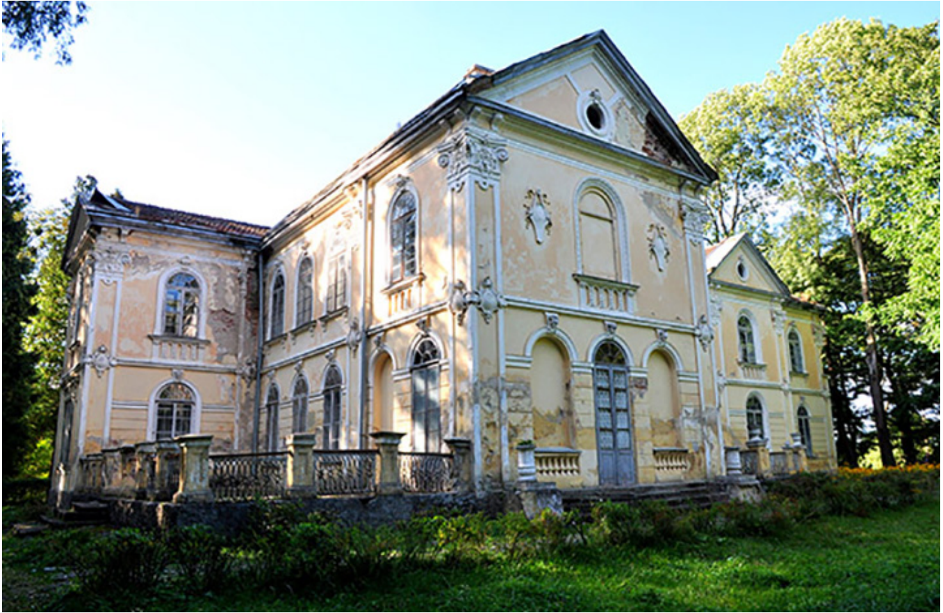
Pałac Fredrów w Bieńkowej Wiszni, fot. Ewa Giszterowicz.