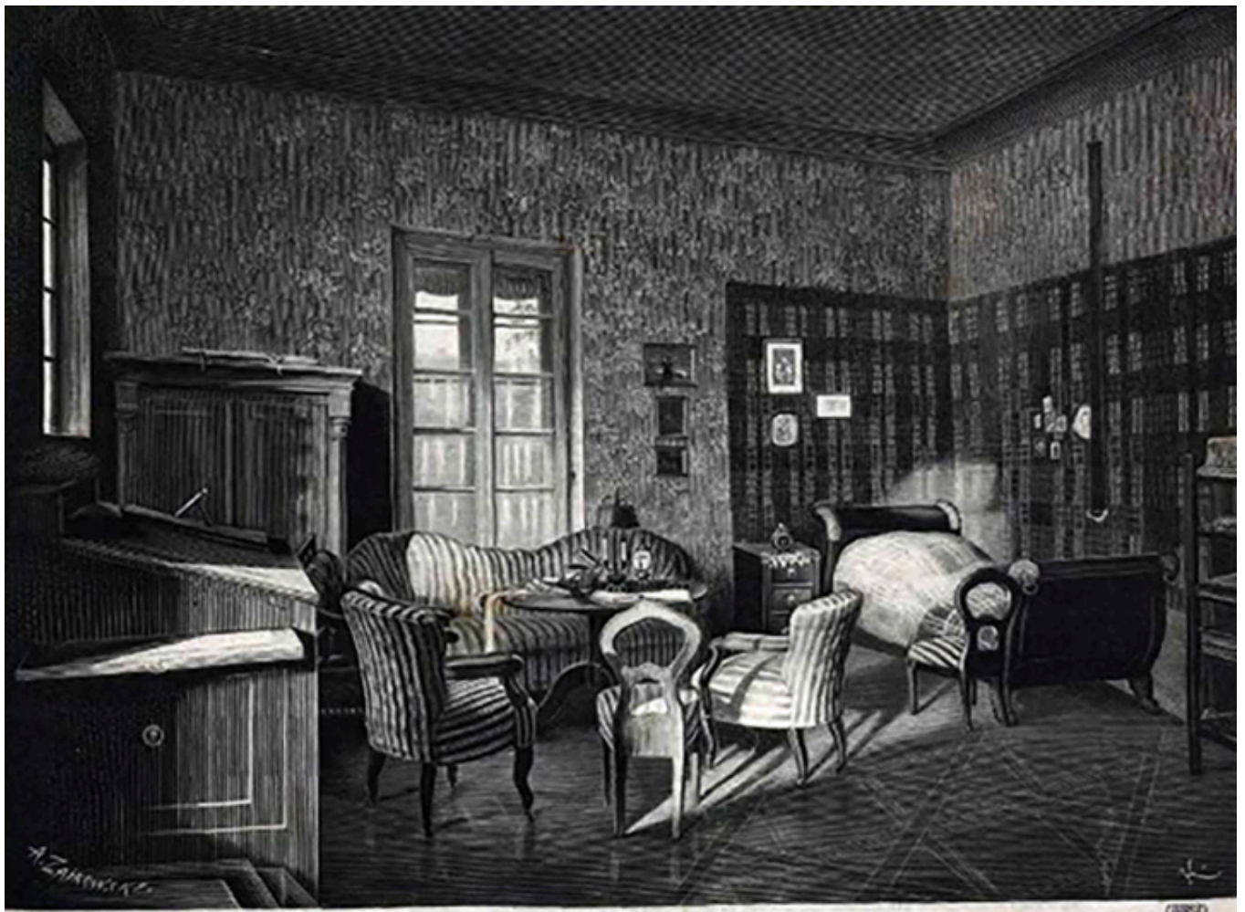
Wnętrze pokoju Aleksandra hr. Fredry.