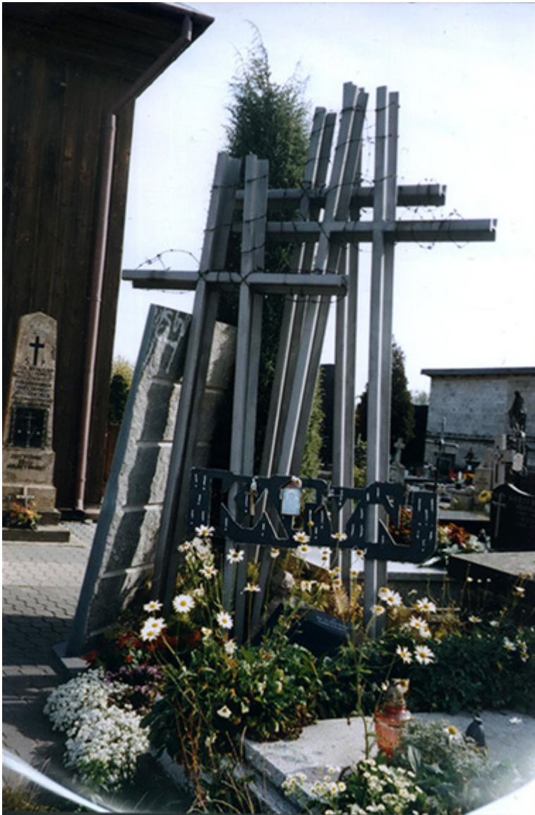
Pomnik Katyński na cmentarzu w Opocznie