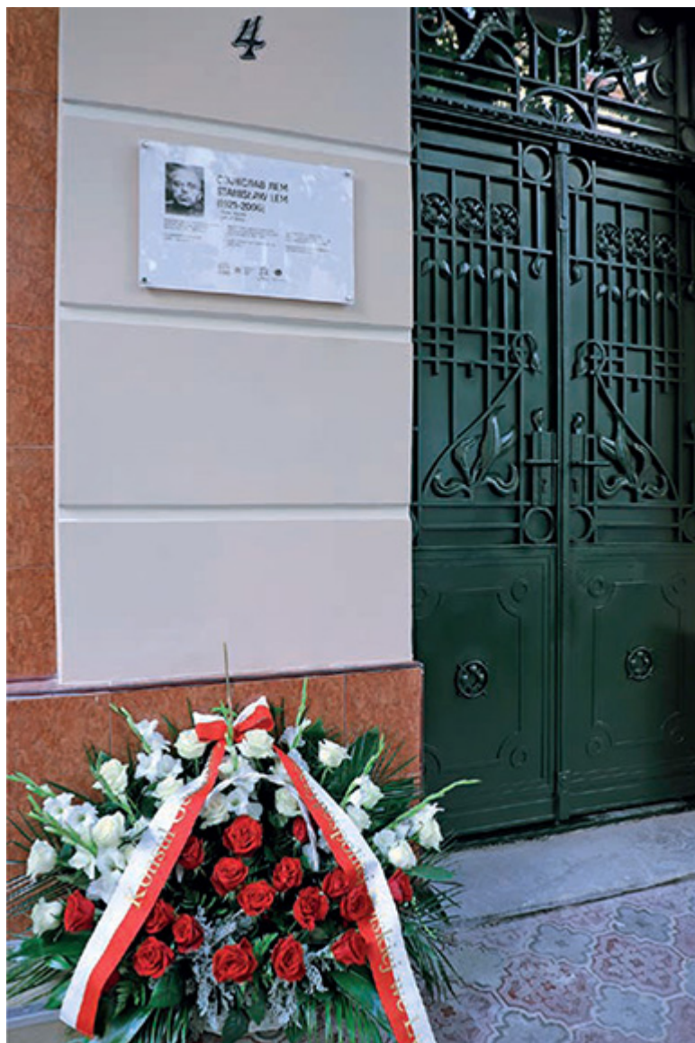
Tablica pamiątkowa na ścianie kamienicy przy ul. Brajerowskiej 4, w której mieszkał Stanisław Lem