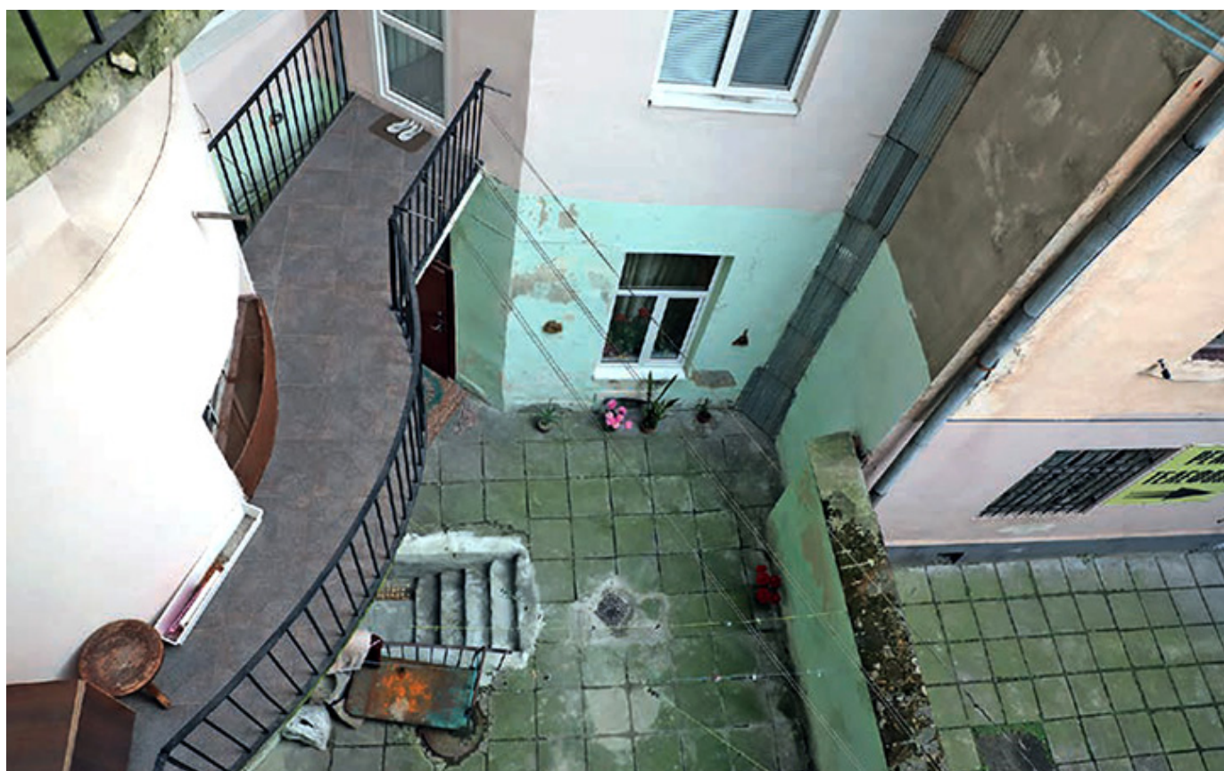
Balkony w kamienicy Lemów przy ul. Brajerowskiej 4 (obecnie Bohdana Łepkiego) od strony podwórka