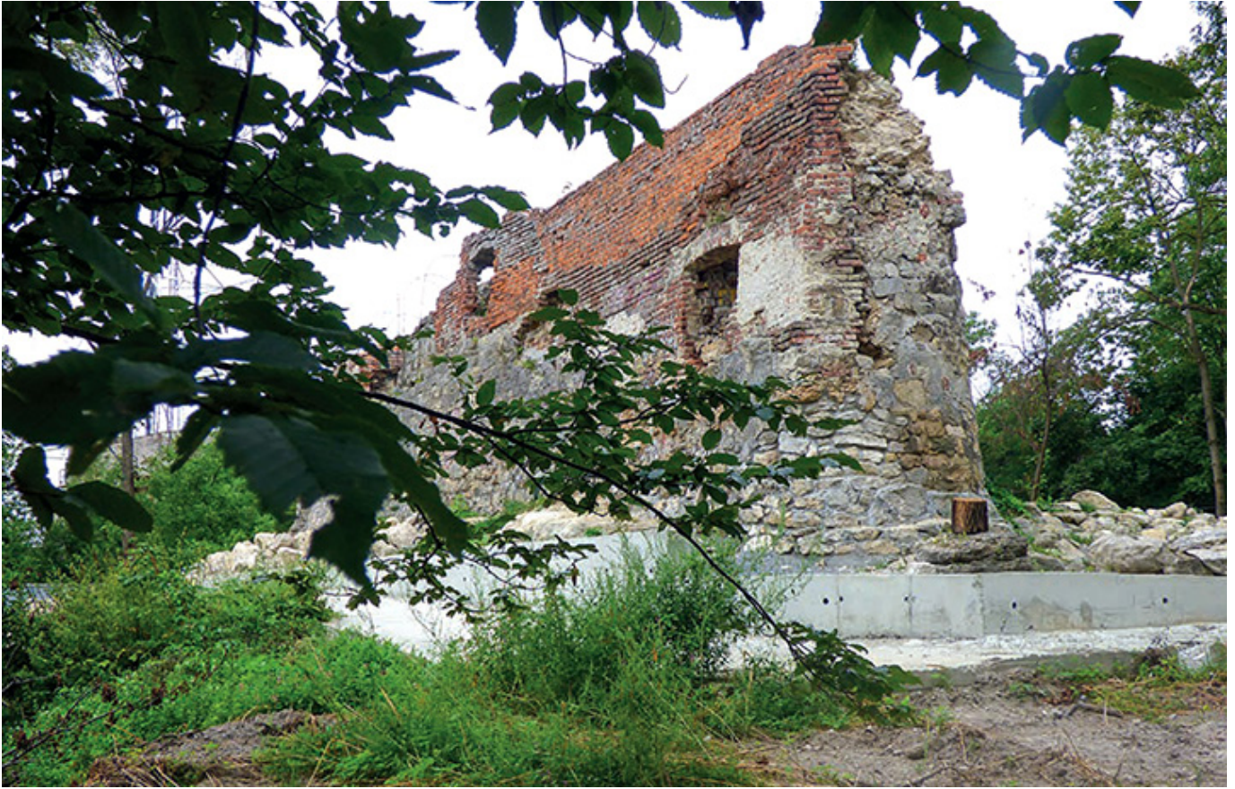
Ruiny murów obronnych Wysokiego Zamku