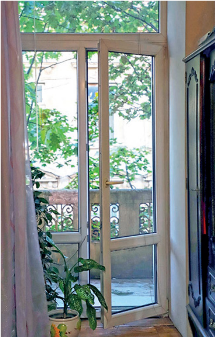
Widok na balkon z gabinetu ojca pisarza, Samuela Lema