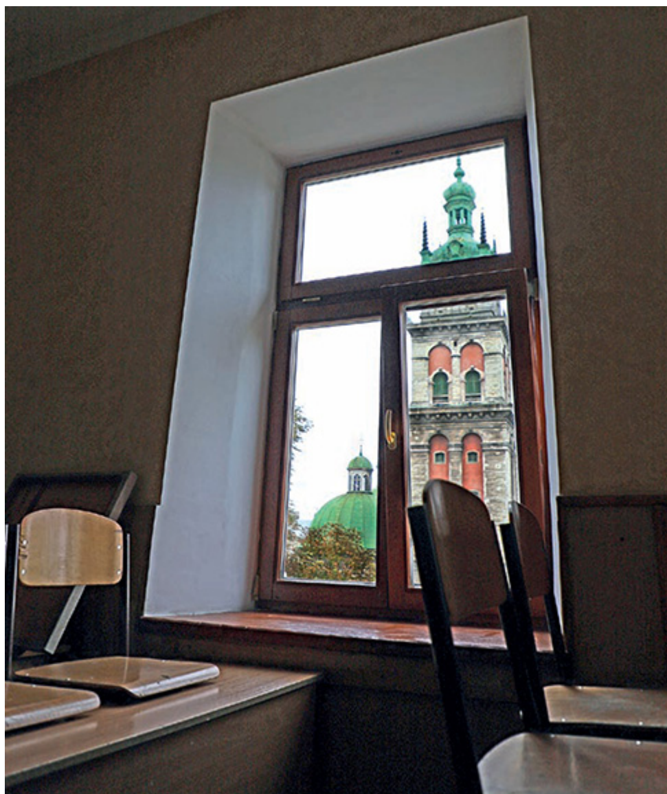
Widok z okna klasy dawnego II Państwowego Gimnazjum im. Karola Szajnochy na wieżę Korniaкта