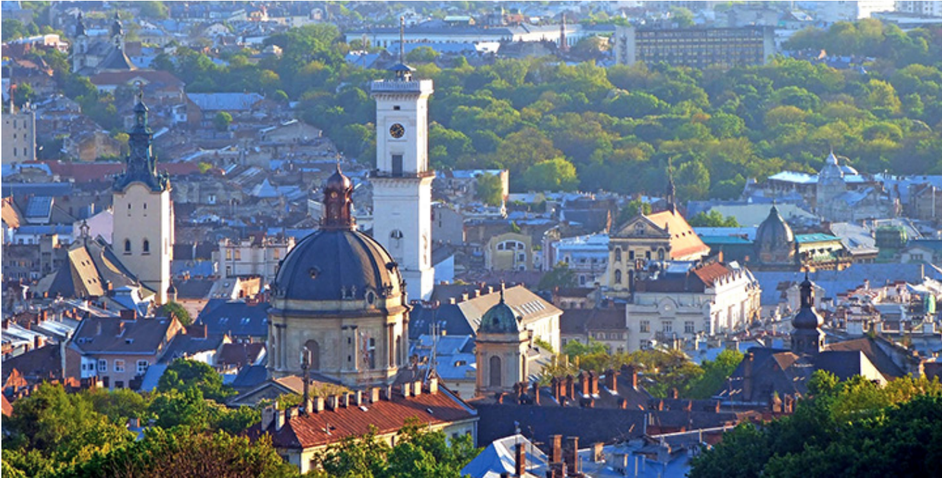
Lwów, panorama