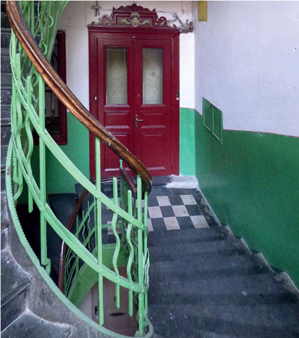
Fragment klatki schodowej i drzwi wejściowe do mieszkania Lemów